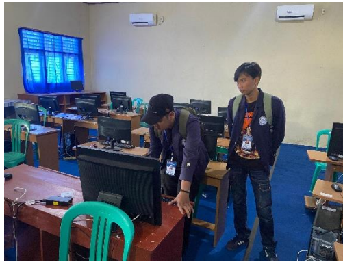
Gambar 10 Survey Lokasi dengan pihak SMA 2 Padang Cermin

Konsolidasi ke SMA 2 Padang Cermin dilaksanakan pada 16 februari 2024, melakukan kordinasi dengan pihak sekolah terkait sosialisasi yang akan dilakukan kelompok PKPM terhadap murid SMA 2 Padang Cermin