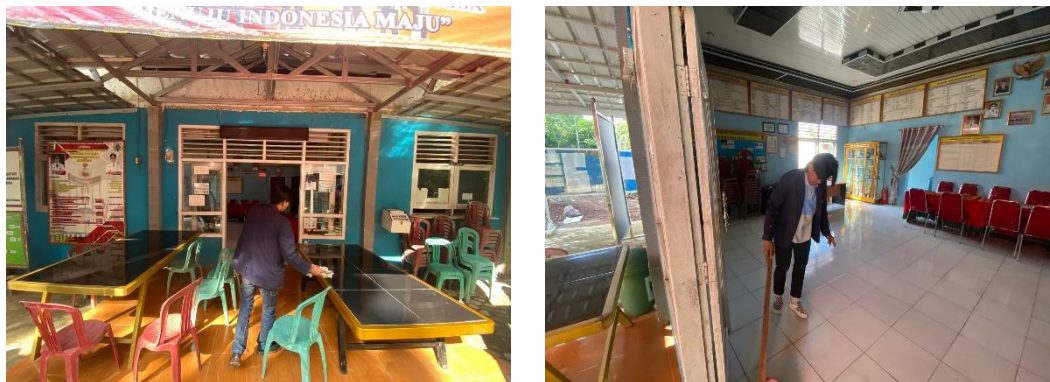
Gambar 7 Piket Balai Desa

Piket Balai Desa dilaksanakan pada Senin, 12 Februari 2024. Piket membersihkan balai desa di Wates Wayratai adalah tanggung jawab bersama untuk menjaga kebersihan dan keteraturan tempat tersebut. Dengan bergantian piket, gotong royong melakukan kegiatan pembersihan, merapikan ruangan, dan memastikan kenyamanan serta keindahan balai desa sebagai pusat kegiatan yang selalu dilakukan di Balai Desa Wates Way ratai.