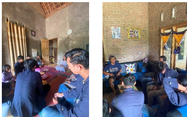
Gambar 3 Kunjungan di UMKM

Dan setelah melakukan pertimbangan dengan pemilik usaha, pemilik usaha terkendala dengan tidak sanggupnya order yang sangat tinggi sebab jumlah produksi yang minim.