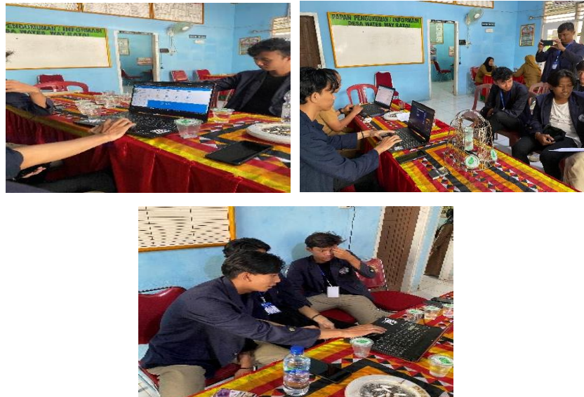
Gambar 2 Aktivitas Pengerjaan Pengembangan Web

Pengembangan situs web Desa Wates Way Ratai merupakan inisiatif penting yang bertujuan meningkatkan keterlibatan masyarakat, mempromosikan potensi ekonomi, dan meningkatkan daya tarik pariwisata. Melalui situs web ini, profil desa, kegiatan, dan potensi ekonomi, termasuk kesuburan tanah, dapat diakses dengan mudah oleh masyarakat lokal dan calon wisatawan. Informasi tentang agenda kegiatan, destinasi wisata, layanan publik, dan proyek pembangunan desa akan memberikan pemahaman yang lebih baik tentang dinamika dan potensi pembangunan di Desa Wates Way Ratai. Selain itu, keberadaan fitur partisipasi masyarakat, berita terkini, dan galeri visual dapat membangun komunikasi dua arah antara pemerintah desa dan warganya, menciptakan ikatan yang kuat dan mendukung pertumbuhan ekonomi desa secara berkelanjutan.