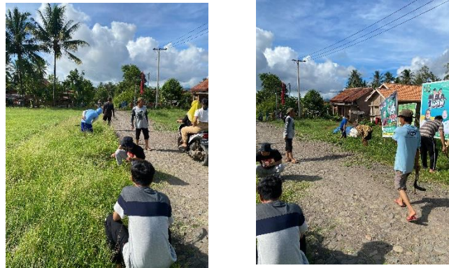
Gambar 4 Kerja bakti dengan warga setempat

Kerja bakti bersama warga dusun Bumi Rejo dilaksanakan 09 februari 2024, kerja bakti dilakukan berupaya untuk membersihkan lingkungan disekitar dusun Bumi Rejo dan juga untuk membentuk ikatan dengan warga sekitar