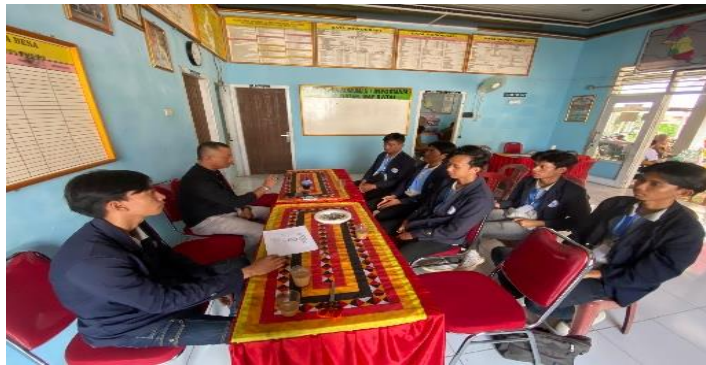
Gambar 6 Pertemuan dengan kepala desa

Pertemuan dengan kepala desa Wates Way Ratai dilaksanakan pada 12 februari 2024, pertemuan dengan kepala desa Wates Way Ratai bermaksud untuk pemaparan program kerja yang akan dilaksanakan.