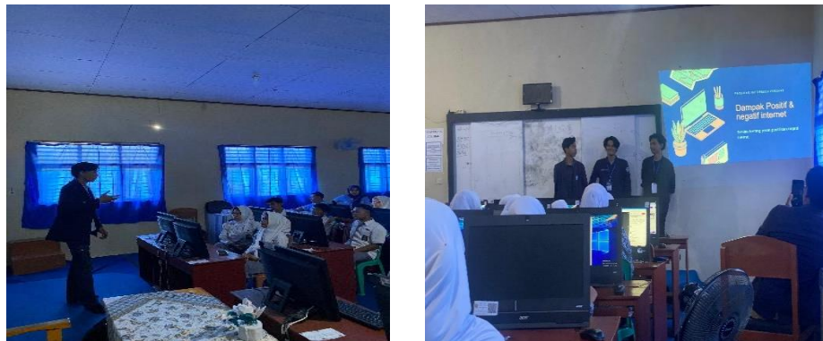
Gambar 11 Sosialisasi ke SMA 2 Padang Cermin

Sosialisasi ke SMA 2 Padang Cermin dilaksanakan pada 20-21 februari 2024, tujuan dilakukannya sosialisasi ke SMA untuk memberikan wawasan tambahan bagi para murid untuk bekal dimasa depan nantinya