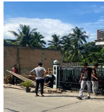
Gambar 13 Gotong Royong di Masjid