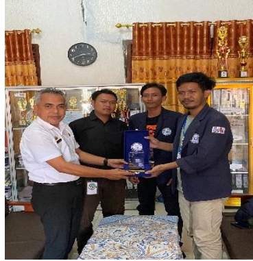
Gambar 12 Penyerahan plakat kepada kepala sekolah