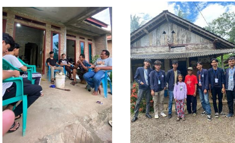
Gambar 5 Kunjungan Ke Rumah RT dan Warga Di Dusun Setempat

Kunjungan ke kediaman kepala dusun dan rt di dusun Bumi Rejo dilaksanakan pada 10 februari 2024, sebagai perkenalan dari kelompok PKPM sekaligus mencari informasi yang dibutuhkan untuk program kerja yang akan dilaksanakan kedepannya.