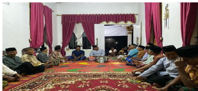
Gambar 9 Kegiatan Keagamaan

Kegiatan keagamaan rutin di Desa Wates Wayratai mencakup berbagai aktivitas, seperti shalat berjamaah, pengajian, dan ceramah keagamaan. Masyarakat secara berkala berkumpul untuk memperkuat ikatan keagamaan, meningkatkan pemahaman agama, serta memperdalam nilai-nilai spiritual. Kegiatan ini juga dapat melibatkan acara-acara keagamaan khusus, seperti peringatan hari besar keagamaan atau program sosial yang berorientasi pada nilai-nilai keagamaan.