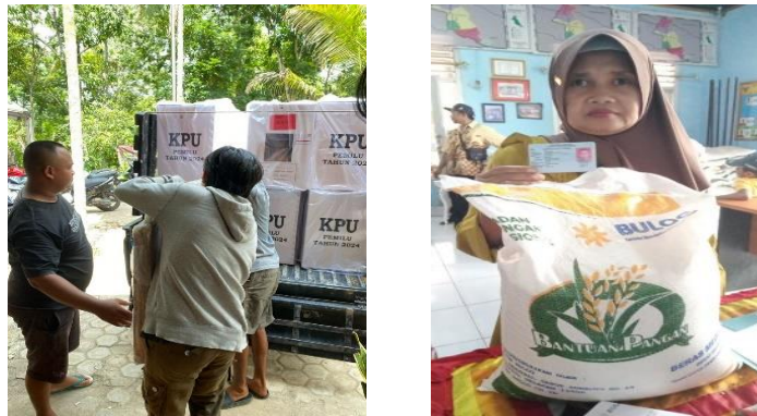
Gambar 8 Membantu Pelayanan Masyarakat

Dalam kegiatan ini membantu pelayanan masyarakat di Balai Desa Wates Wayratai adalah langkah positif untuk berkontribusi dalam kemajuan komunitas. Ini dapat mencakup memberikan informasi kepada warga, membantu administrasi, atau terlibat dalam program sosial yang bertujuan meningkatkan kesejahteraan masyarakat setempat. Dengan keterlibatan aktif, turut berperan dalam membangun hubungan yang harmonis dan pelayanan masyarakat yang lebih baik.