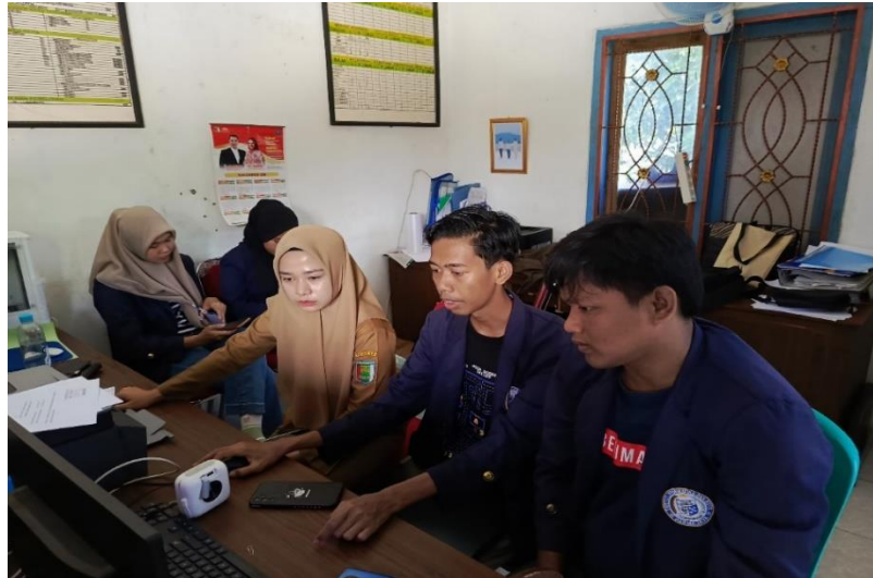
Lampiran 1. 19 Pelatihan registrasi online ke aparat