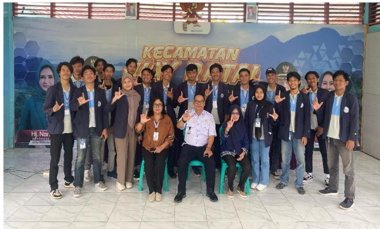
Lampiran 1. 26 Pelepasan di kantor camat dan penjemputan