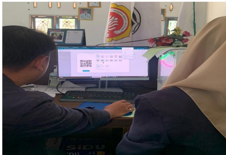
Lampiran 1. 20 Pembuatan e-singnature kepala desa