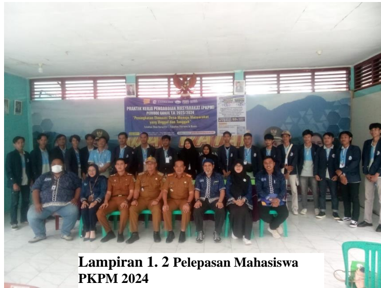
Lampiran 1. 2 Pelepasan Mahasiswa PKPM 2024