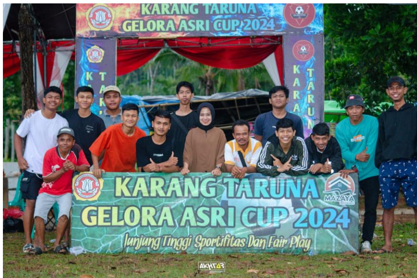
Lampiran 1. 13 Menghadiri event sepak bola final dan pembagian hadiah