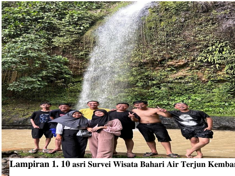
Lampiran 1. 10 asri Survei Wisata Bahari Air Terjun Kembar