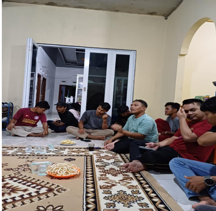
Lampiran 1. 5 Silaturahmi dengan pemuda/i