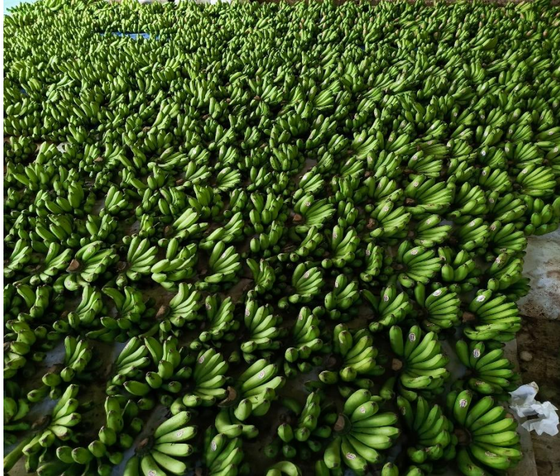
Lampiran 1. 8 Kunjungan ke Gudang penyortiran & pengepakan pisang milik bumdes