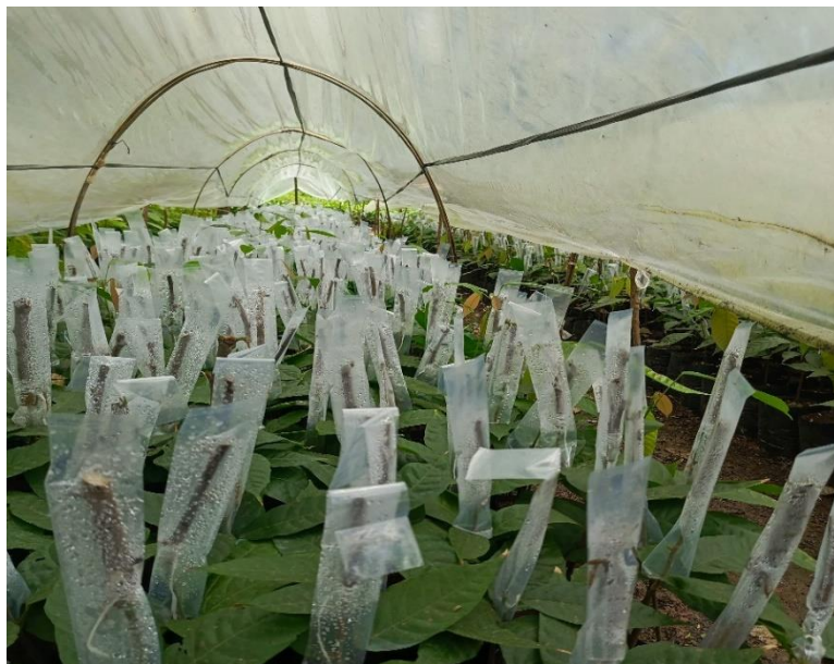
Lampiran 1. 7 Kunjungan ke tempat pembibitan kakao