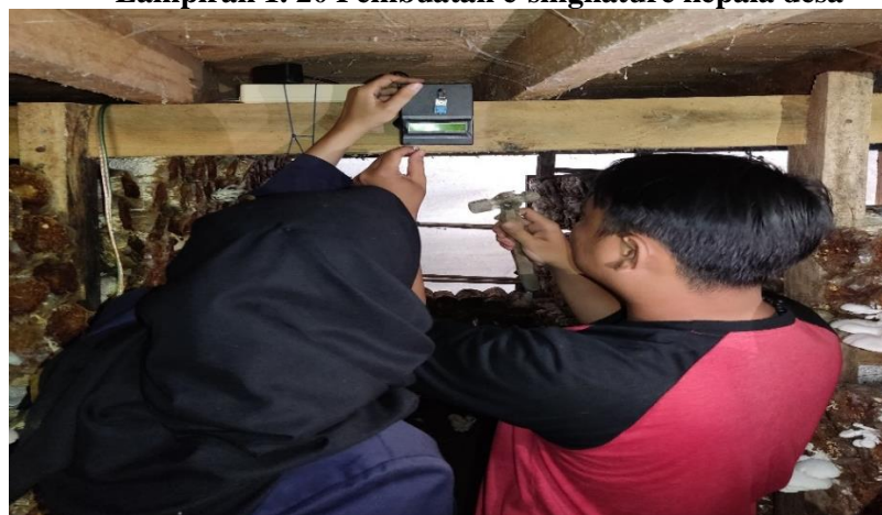
Lampiran 1. 21 Intalasi alat monitoring suhu dan kelembapan