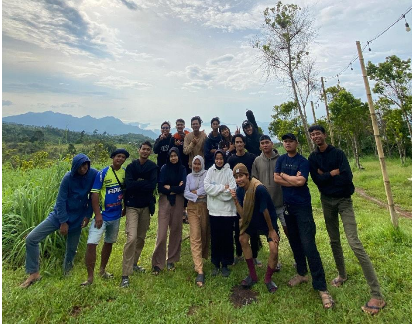
Lampiran 1. 12 Kegiatan perpisahan mahasiswa PKPM 2024