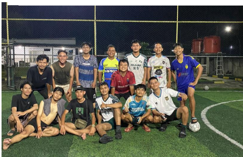
Lampiran 1. 11 Bermain futsal Bersama pemuda ceringin