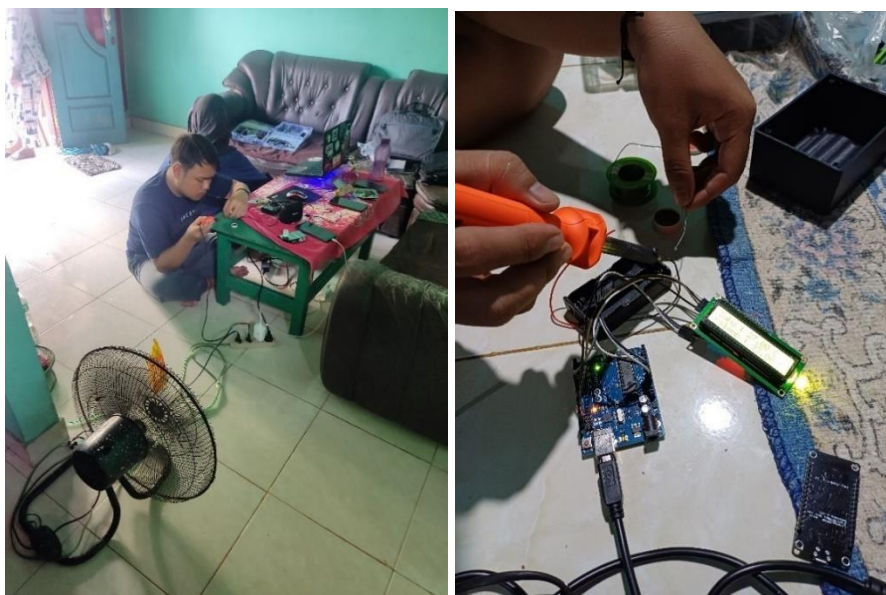
Gambar 2. 4 Perancangan Alat Monitoring Suhu Dan Kelembapan

Pada kegiatan ini perancangan alat yang akan ditujukan untuk memudahkan pemilik kumbung jamur dapat memonitoring suhu dan kelembapan pada kumbung jamur tiram.