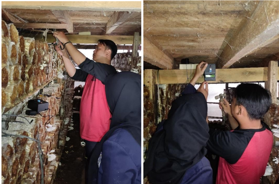
Gambar 2. 5 Pemasangan alat suhu dan kelembapan

Dalam kegiatan ini bertujuan untuk pemasangan alat monitoring suhu dan kelembapan yang sudah kami rancang sebelumnya untuk kebutuhan pemantauan di kumbung jamur tiram,