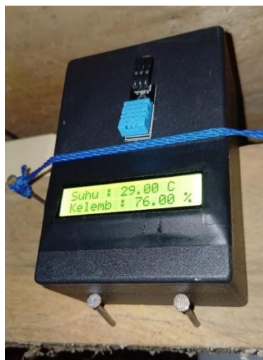
Gambar 2. 6 Pengujian alat monitoring suhu dan kelembapan

Pada kegiatan ini ditujukan untuk pengujian alat yang telah di pasang, tujuannya untuk mengetahui alat berfungsi atau tidak. Dan hasil yang di dapat ialah alatnya dapat berfungsi dengan baik.