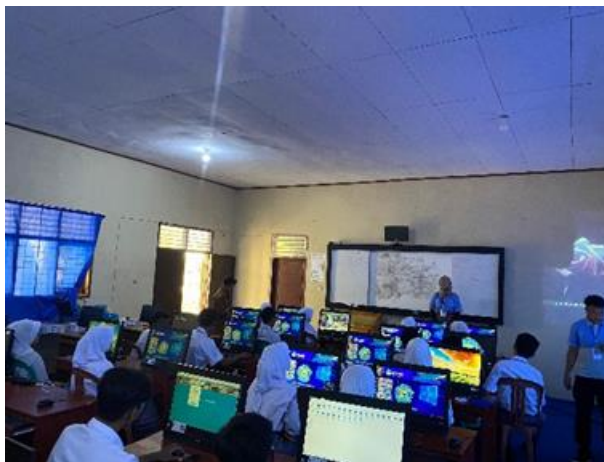
Gambar 2.7 Pelatihan e-sertifikat dan cv di canva