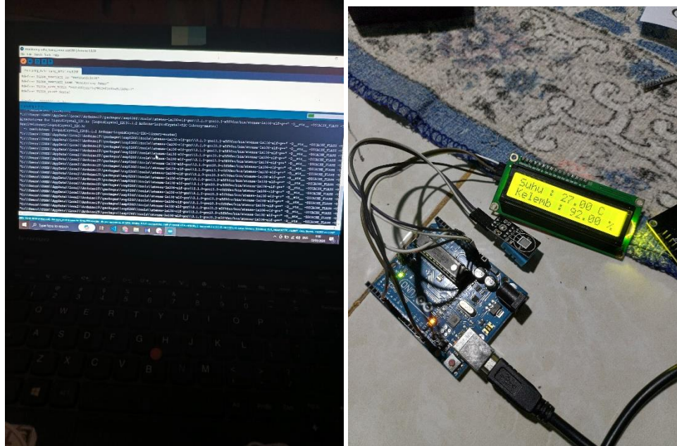
Gambar 2. 3 Meng-upload source code pada alat

kegiatan ini yaitu, proses upload source code yang telah di buat ke mikrokontroler Arduino uno.