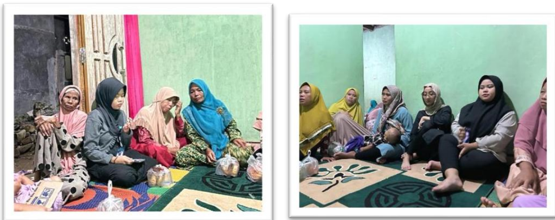
Gambar 2.6 mengikuti pengajian ibu-ibu di tempat ibu RT 02

Mengikuti pengajian rutin ibu-ibu RT 02 setiap senin malam