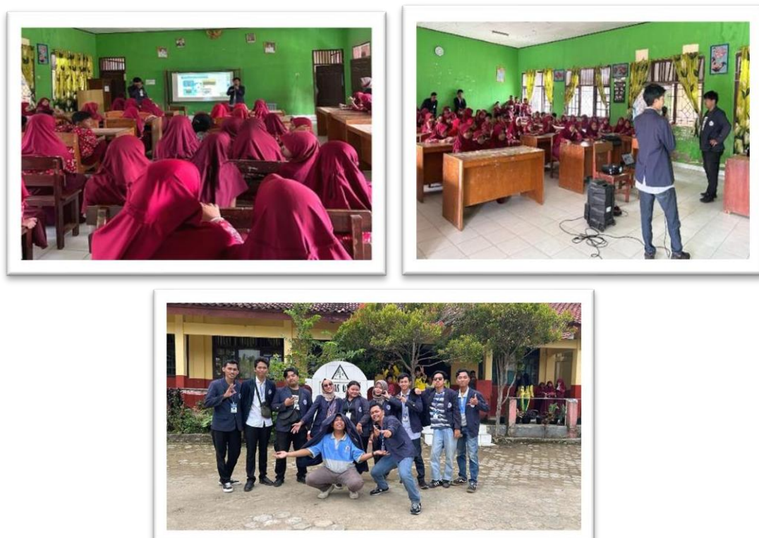
Gambar 2.14 Sosialisasi Ke SDN14 Padang Cermin Tentang Komputer dan Bahaya Internet

Sosialisasi kepada anak-anak sekolah tentang komputer dan bahaya internet guna mencerdaskan generasi muda