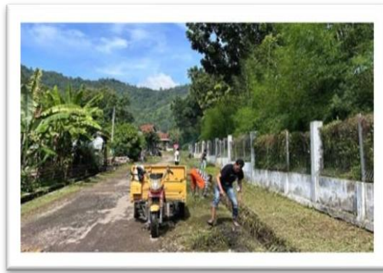
Gambar 2.10 gotong royong membersihkan desa bersama aparatur desa dan warga