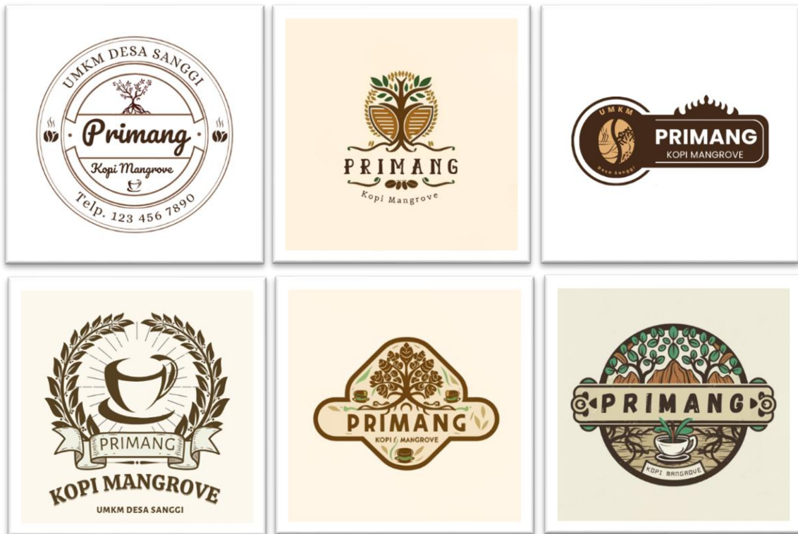
Gambar 2.3. Desain Logo