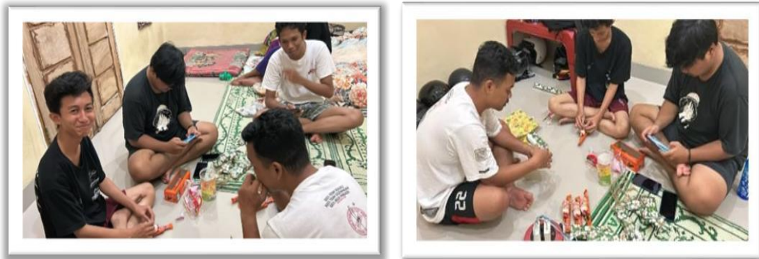
Gambar 2.13 Membuat Hadiah Untuk Sosialisasi Ke SDN 14 Padang Cermin

Membuat hadiah kecil untuk anak-anak saat menjawab kuis menarik yang diberikan oleh kakak-kakak PKPM