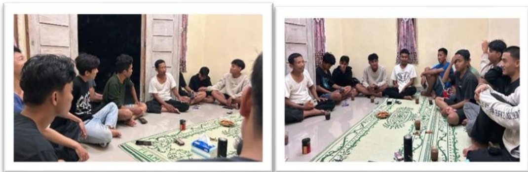
Gambar 2.8 perkenalan dan kunjungan pemuda-pemuda desa sanggi di posko

Perkenalan dan kunjungan pemuda-pemuda desa sanggi di posko agar mempererat silaturahmi antara mahasiswa dan pemuda desa.