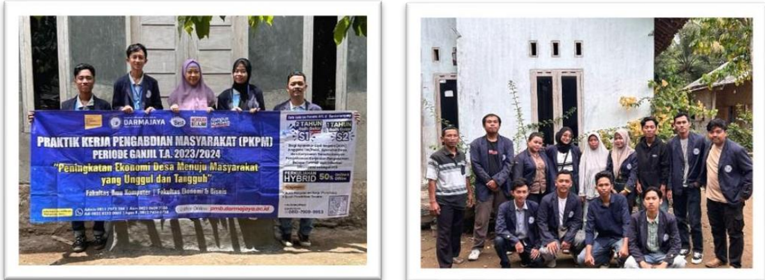
Gambar 2.5 foto bersama ibu pembimbing lapangan di posko

Kunjungan hari pertama kedatangan mahasiswa PKPM dan ibu dosen pembimbing lapangan ke posko.