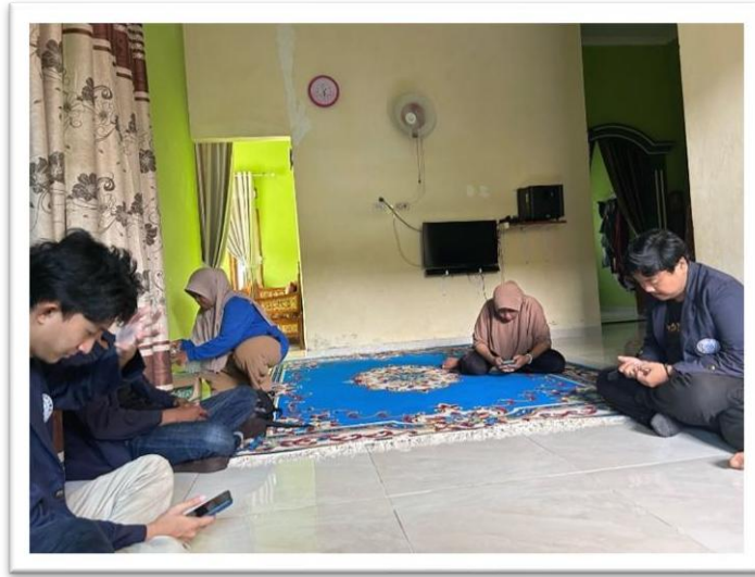
Gambar 2.1. Sosialisasi Kepada Pemilik UMKM