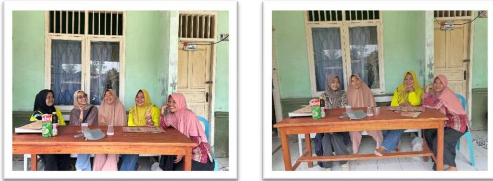
Gambar 2.15 ikut serta dan membantu posyandu anak-anak dan ibu hamil didesa sanggi

Mengikuti dan membantu posyandu anak-anak dan ibu hamil di desa sanggi piabung guna menjaga kesehatan dan juga mempererat silaturahmi antara mahasiswa dan warga desa.