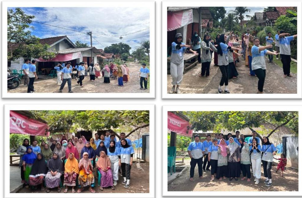
Gambar 2.7 mengikuti posyandu lansia dan senam bersma ibu-ibu desa sanggi

Mengikuti dan membantu posyandu lansia dan senam bersama ibu-ibu di desa sanggi piabung guna menjaga kesehatan dan juga mempererat silaturahmi antara mahasiswa dan warga desa.