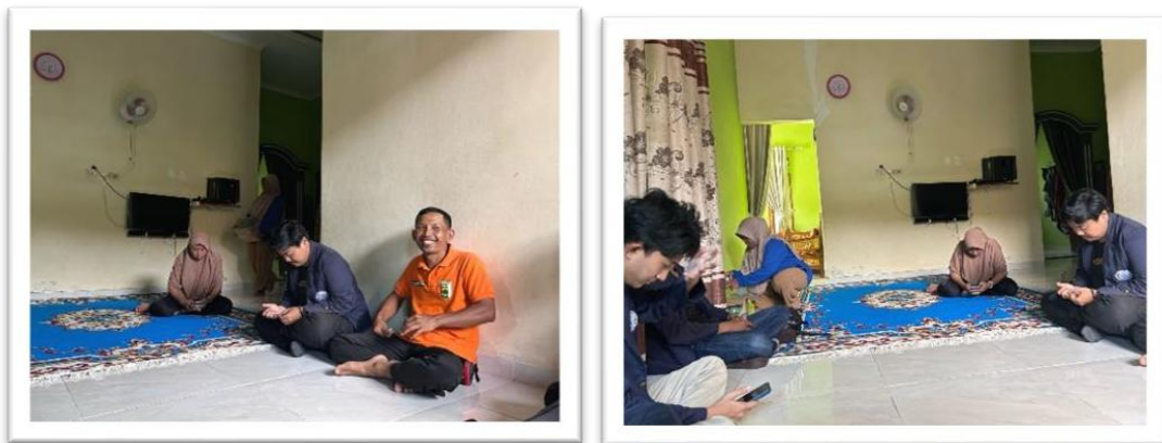
Gambar 2.12 silaturahmi ibu lurah dan perkenalan karang taruna

Silaturahmi ke rumah ibu lurah dan perkenalan karang taruna serta berdiskusi tentang UMKM di desa sanggi.