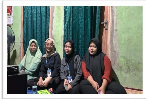
Gambar 2.9 mengikuti pengajian rawis bersama risma desa sanggi

Gotong royong membersihkan lingkungan desa bersama aparatur desa dan warga desa sanggi