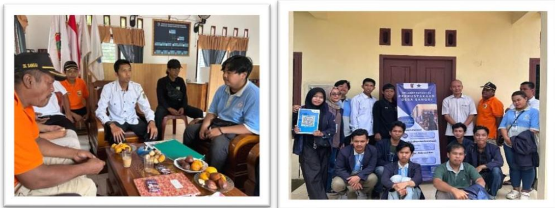
Gambar 2.16 Pemaparan Program Kerja Serta Perpisahan Dengan Aparat Desa

Pemaparan program kerja dan pemberian hasil simbolis kepada aparat desa di balai desa