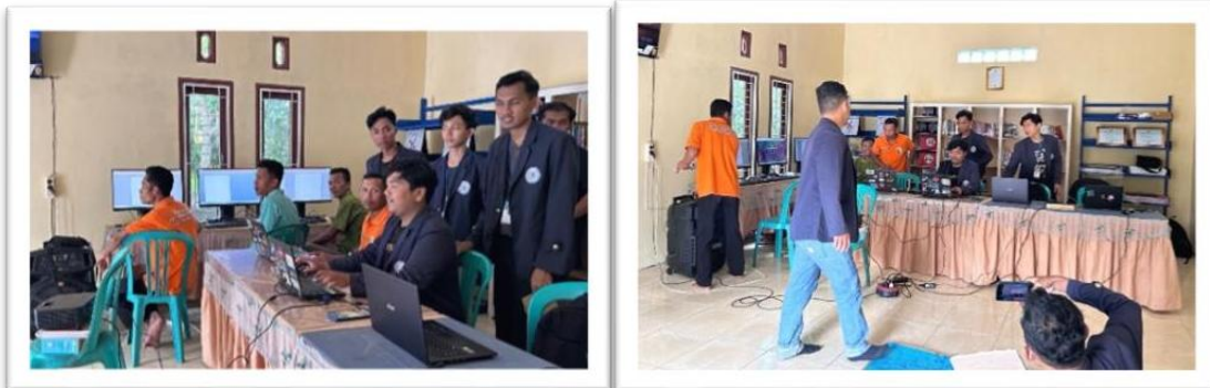
Gambar 2.11 pelatihan Ms. word kepada aparatur RT Desa Sanggi

Pelatihan Ms. Word yang diikuti oleh aparatur desa sanggi seperti RT dan kepala dusun yang dilaksanakan di perpustakaan desa.