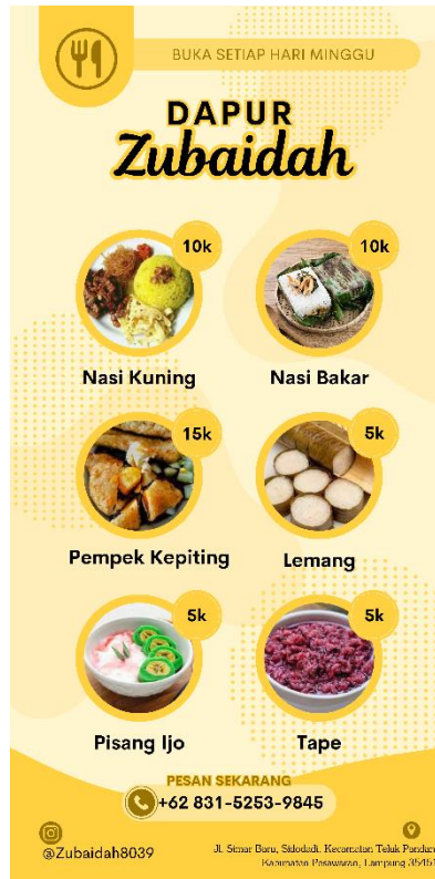
Gambar 2. 4 Informasi Produk Untuk UMKM Dapur Zubaidah