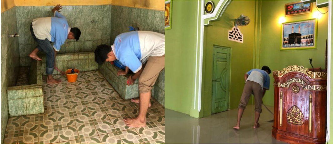
Gambar 2. 5 Kegiatan Gotong Royong Masjid