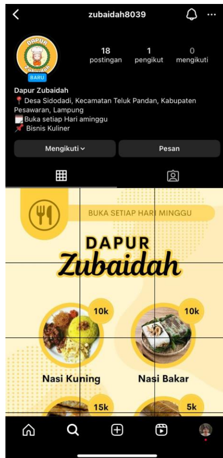
Gambar 2. 2 Media Sosial Instagram