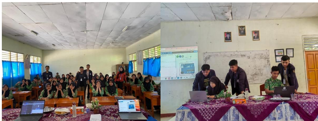
Gambar 2. 9 Sosialisasi SMPN 25 Pesawaran