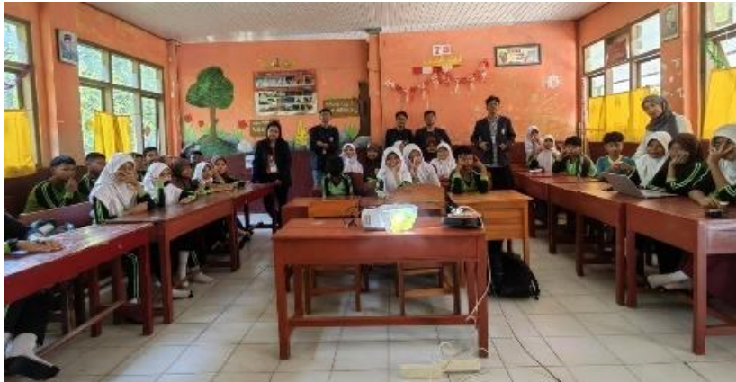
Gambar 2. 8 Sosialisasi SDN 05 Teluk Pandan