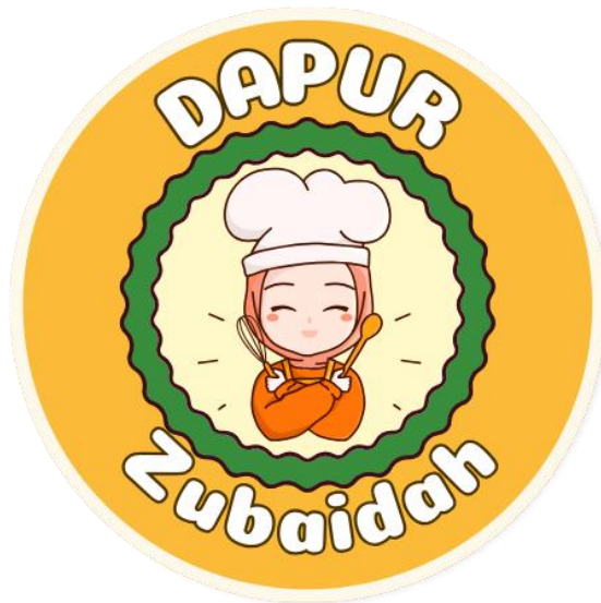
Gambar 2. 3 Pembuatan Disain Logo UMKM

Di era digital yang semakin maju, branding menjadi satu hal yang tidak boleh diabaikan dalam bisnis, termasuk Usaha Mikro Kecil dan Menengah (UMKM). Salah satu komponen penting dalam upaya branding adalah memiliki logo yang memikat dan kuat. (Ainun et al., 2023)