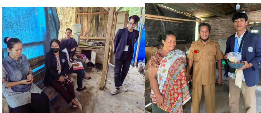
Gambar 2. 7 Kunjungan UMKM jamur & Melinjo

kunjungan pertama ke UMKM Jamur dan Melinjo yang dilaksanakan pada tanggal 17 Februari 2024 yang dimana pada saat itu melakukan kunjungan dan silaturahmi dengan pemilik UMKM serta berbincang mengenai permasalahan-permasalahan yang terjadi. Sehingga hasil dari perbincangan tersebut dapat menemukan titik terang mengenai program kerja yang akan dilaksanakan agar dapat membantu dari segala permasalahan yang terjadi.