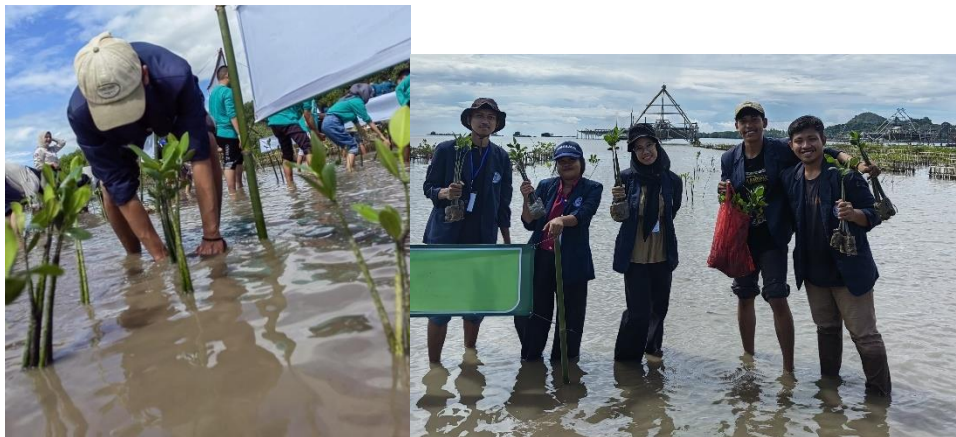
Gambar 2. 6 Penanaman Bibit Mangrove

Penanaman bibit mangrove yang dilakukan pada tanggal 07 Februari 2024 yang dilaksanakan di lokasi wisata cuku nyinyi Desa Sidodadi, penanaman bibit mangrove ini bertujuan untuk memulihkan dan menjaga ekosistem mangrove yang diharapkan dapat melindungi pantai dari abrasi dan erosi.