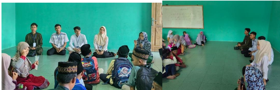
Gambar 2. 10 Mengajar Ngaji TPA

Kegiatan mengajar ngaji pada TPA Dusun 1 yang dilaksanakan pada tanggal 20 Februari 2024 dengan harapan dapat membantu pengurus TPA dalam mengajar dan juga dapat Kegiatan mengajar ngaji bertujuan untuk membantu anak-anak dalam mempelajari dan memahami ajaran agama Islam dengan lebih baik, serta meningkatkan pemahaman mereka terhadap Al-Qur'an dan hadis.