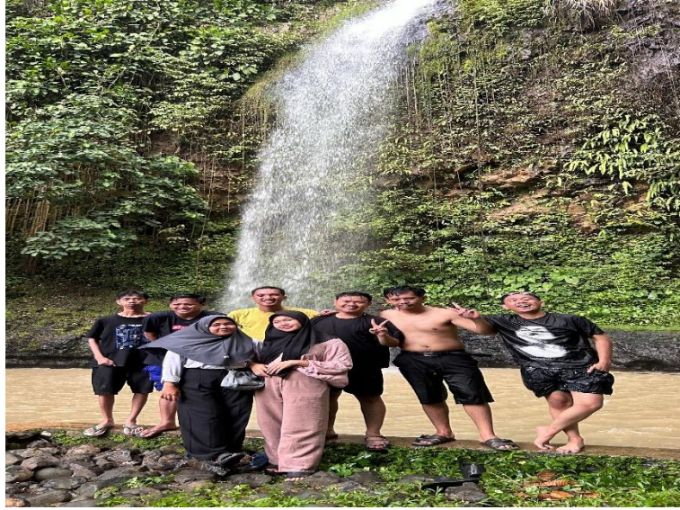
Lampiran 1. 10 Survei Wisata Bahari Air Terjun Kembar