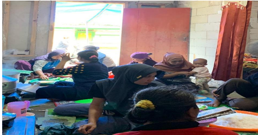
Lampiran 1. 14 Membantu mempersiapkan yasinan rutin