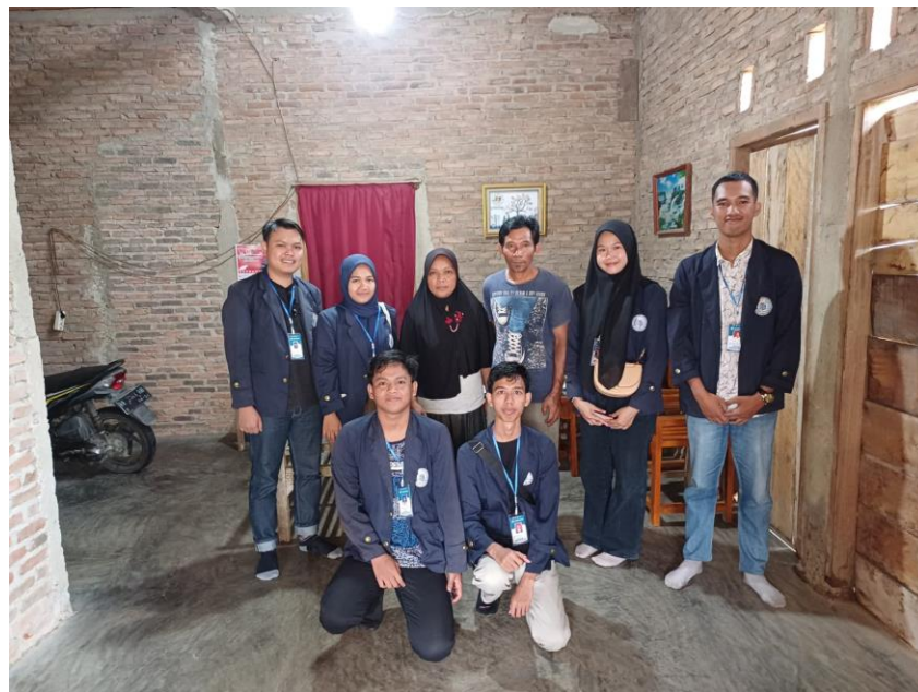
Lampiran 1. 6 Survei ke UMKM