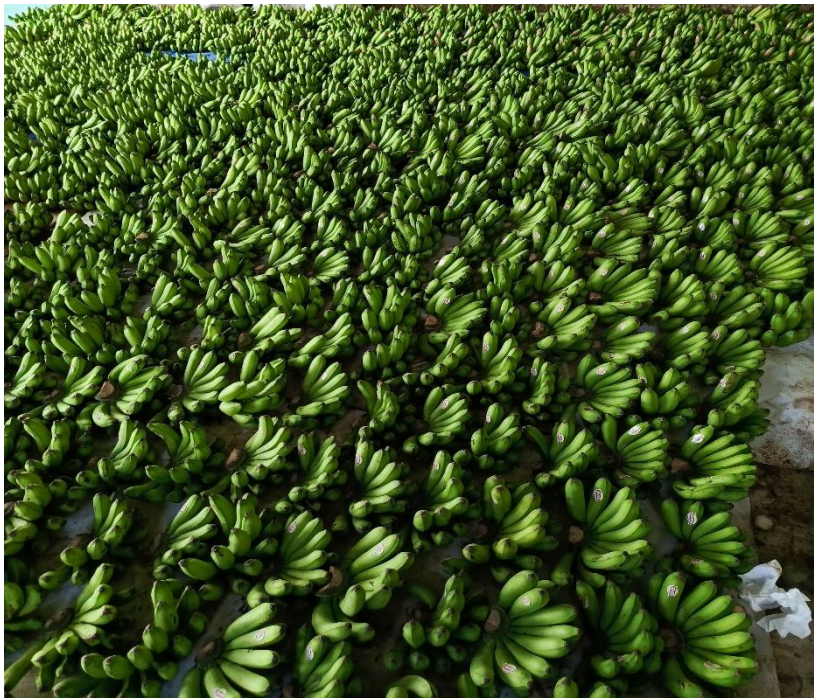
Lampiran 1. 7 Kunjungan ke Gudang penyortiran & pengepakan pisang milik bumdes