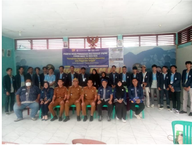
Lampiran 1. 1 Pelepasan Mahasiswa PKPM 2024