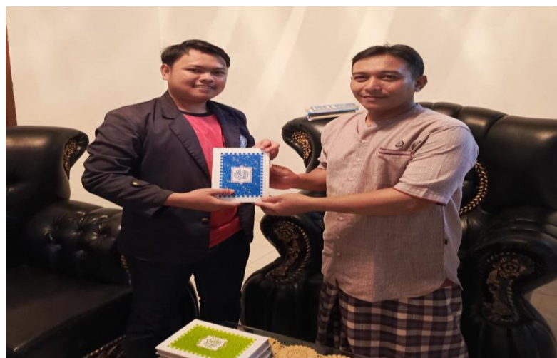
Lampiran 1. 23 Penyerahan peninggalan mahasiswa PKPM 2024