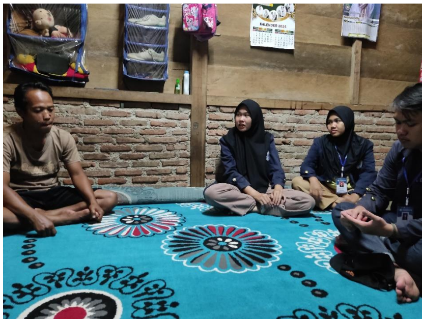
Lampiran 1. 3 Silaturahmi kerumah Kadus dan Pak Rt