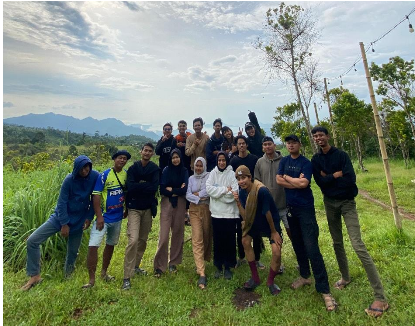
Lampiran 1. 12 Kegiatan perpisahan mahasiswa PKPM 2024