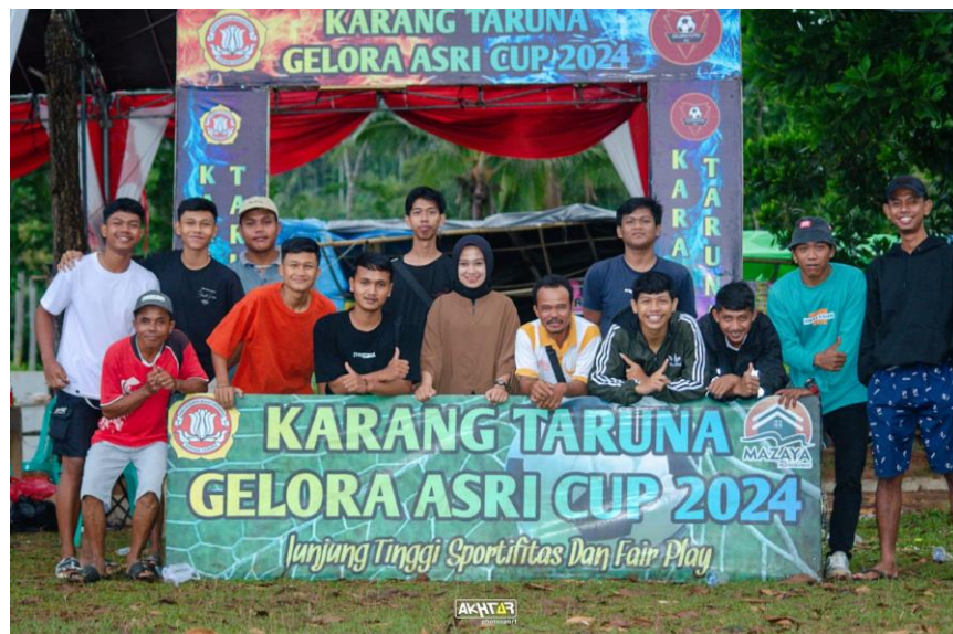
Lampiran 1. 13 Menghadiri event sepak bola final dan pembagian hadiah