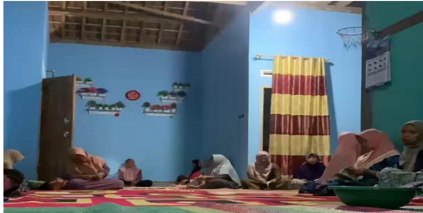
Lampiran 1. 17 Mengikuti yasinan rutin ibu-ibu