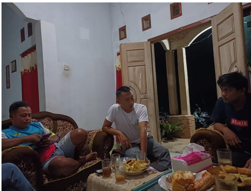
Lampiran 1. 4 Silaturahmi kerumah Kades dan Sekdes