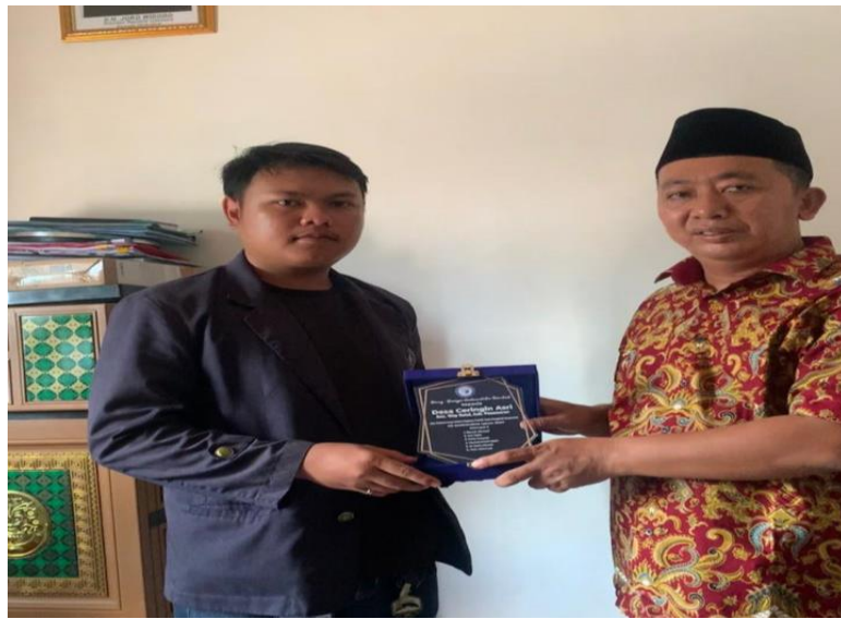
Lampiran 1. 25 Perpisahan dan penyerahan cenderamata mahasiswa PKPM 2024 ke kepala desa