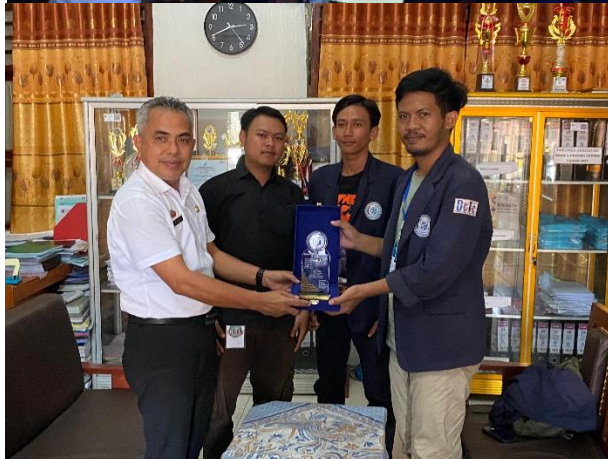
Lampiran 1. 18 Pelatihan e-sertifikat dan cv menggunakan canva dan penyerahan cenderamata di SMA N 02 padang cermin