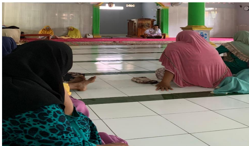
Lampiran 1. 16 Mengikuti pengajian rutin