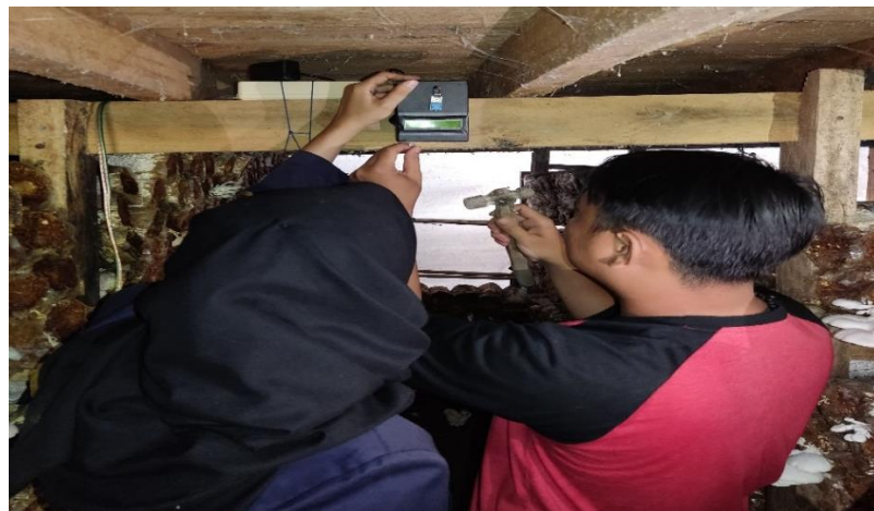
Lampiran 1. 21 Intalasi alat monitoring suhu dan kelembapan