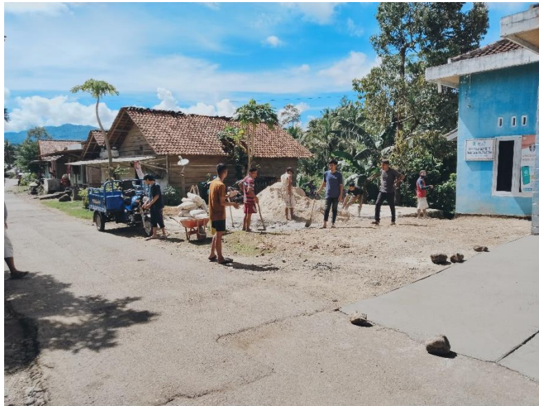
Lampiran 1. 2 Kegiatan kerja bakti