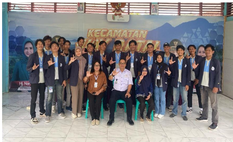
Lampiran 1. 26 Pelepasan di kantor camat dan penjemputan