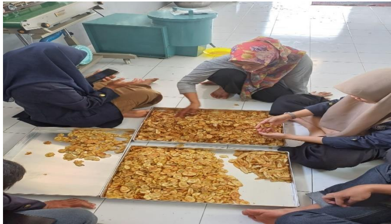
Lampiran 1. 11 Percobaan produksi keripik pisang