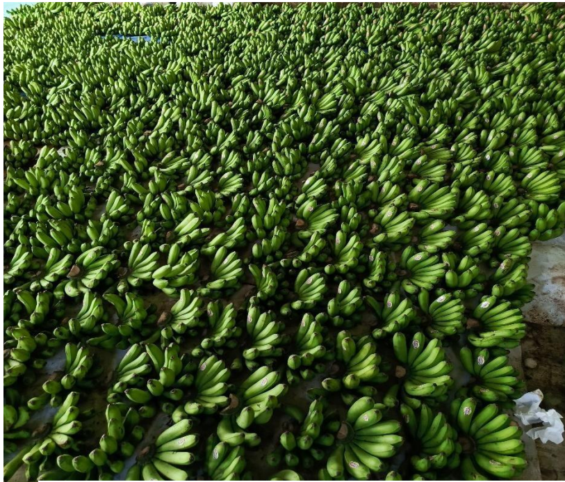
Lampiran 1. 8 Kunjungan ke Gudang penyortiran & pengepakan pisang milik bumdes