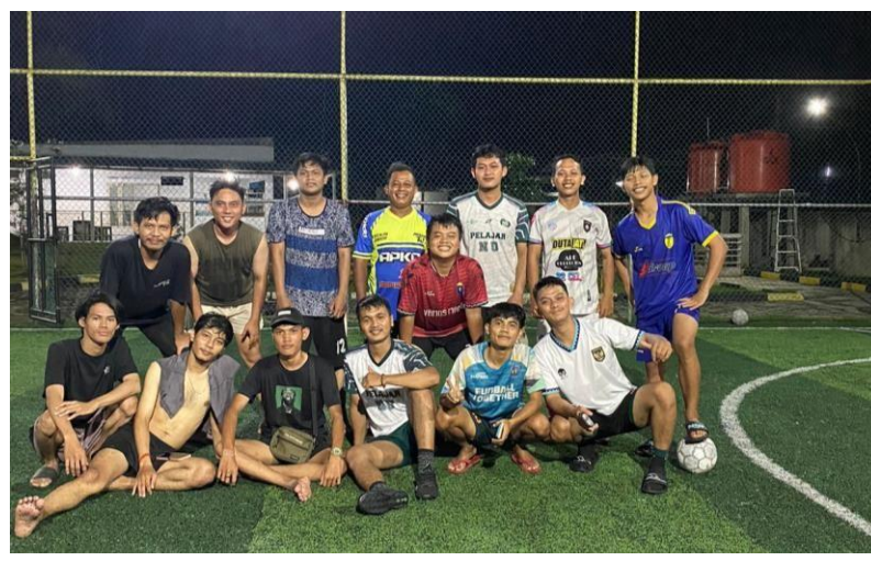
Lampiran 1. 9 Bermain futsal Bersama pemuda ceringin