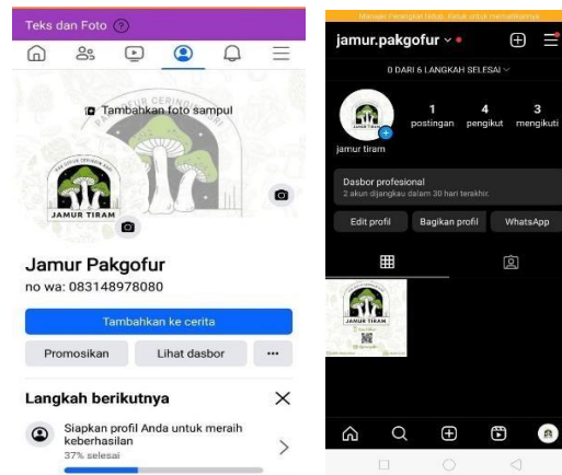
Lampiran 1. 24 Penyerahan akun pemasaran ke UMKM jamur tiram pak gopur