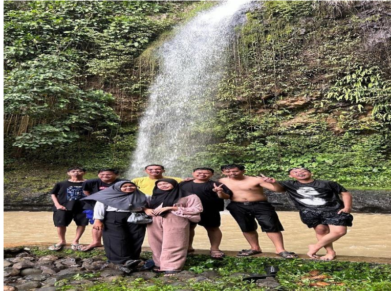
Lampiran 1. 11 Survei Wisata Bahari Air Terjun Kembar