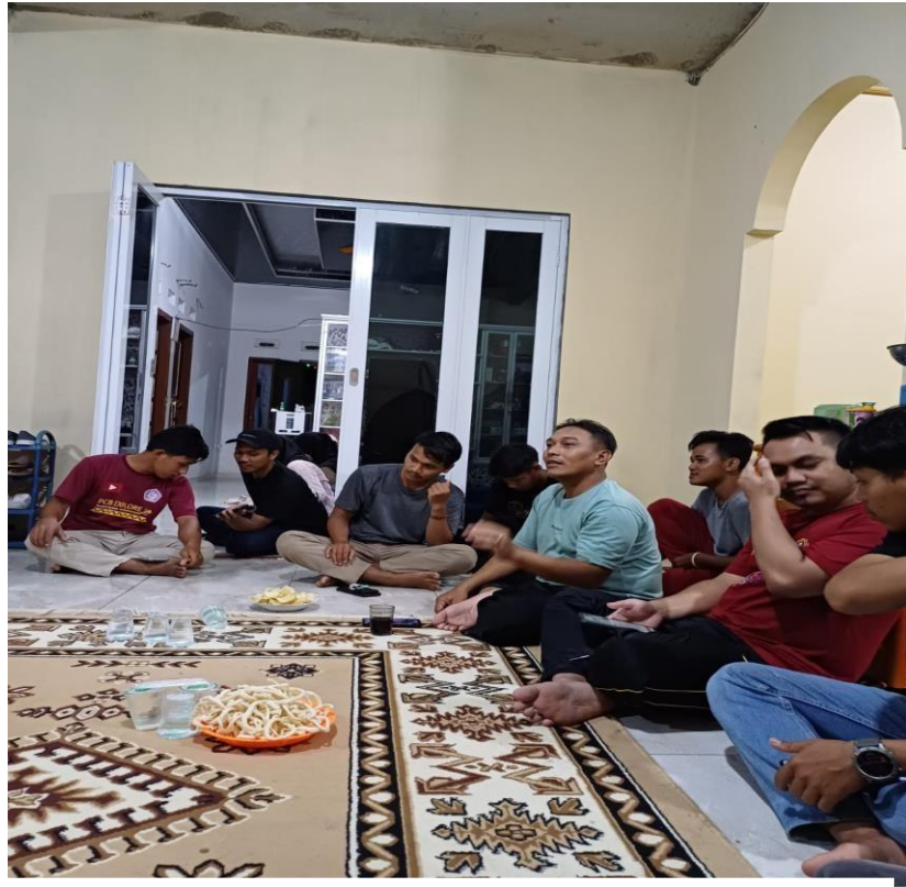
Lampiran 1. 6 Silaturahmi dengan pemuda/i