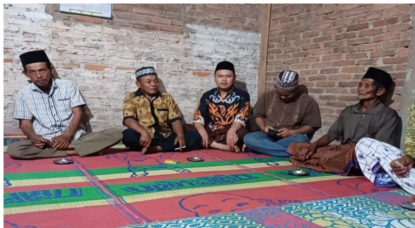
Lampiran 1. 16 Mengikuti yasinan rutin