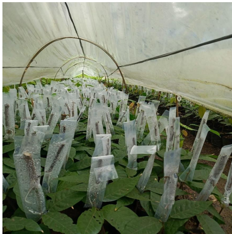
Lampiran 1. 7 Kunjungan ke tempat pembibitan kakao