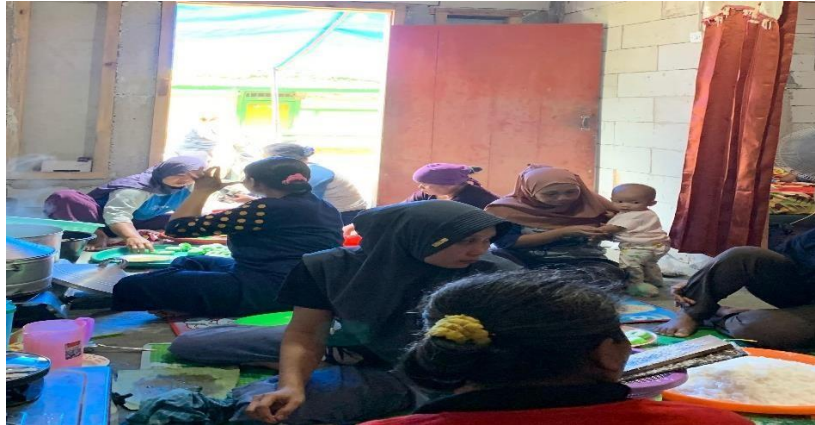
Lampiran 1. 14 Membantu mempersiapkan yasinan rutin