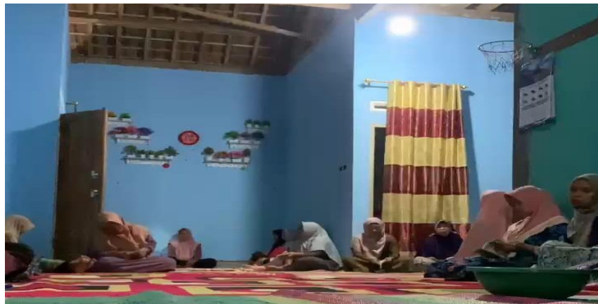
Lampiran 1. 17 Mengikuti yasinan rutin ibu-ibu