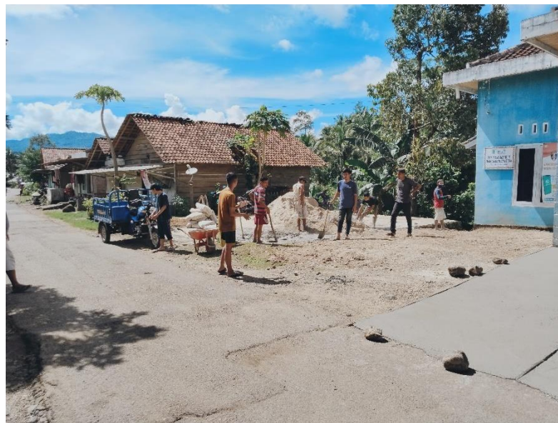
Lampiran 1. 2 Kegiatan kerja bakti