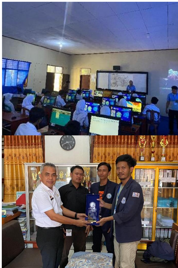
Lampiran 1. 18 Pelatihan e-sertifikat dan cv menggunakan canva dan penyerahan cenderamata di SMA N 02 padang cermin