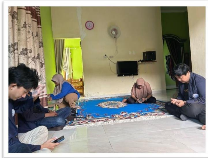
Gambar 2.1 Sosialisasi kepada pemilik UMKM