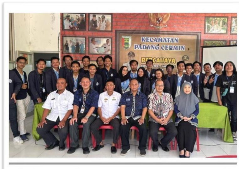
Gambar 2.20 Penarikan dan Presentasi hasil kerja di kecamatan