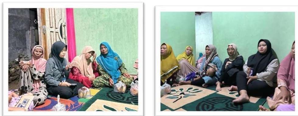
Gambar 2.6 mengikuti pengajian ibu-ibu di tempat ibu rt 02

Mengikuti Pengajian Rutin Ibu-Ibu Rt 02 Setiap Senin Malam