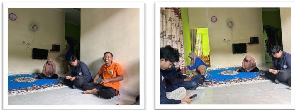
Gambar 2.14 Silaturahmi Ibu Kades Dan Perkenalan Karang Taruna Membuat Hadiah Kecil Untuk Anak-Anak Saat Menjawab Quiz Menarik Yang Diberikan Oleh Kakak-Kakak Pkpm