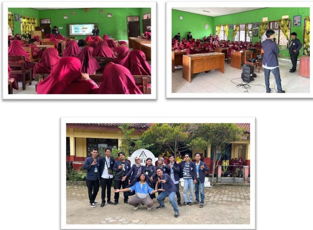
Gambar 2.16 Sosialisasi Ke SDN14 Padang Cermin Tentang Komputer dan Bahaya Internet

Mengikuti Dan Membantu Posyandu Anak-Anak Dan Ibu Hamil Di Desa Sanggi Piabung Guna Menjaga Kesehatan Dan Juga Mempererat Silaturahmi Antara Mahasiswa Dan Warga Desa.