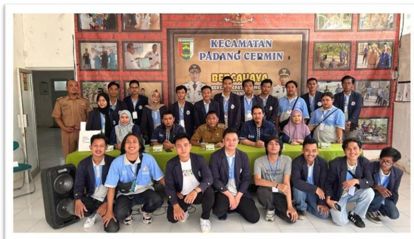
Gambar 2.4 penyambutan mahasiswa PKPM di kecamatan padang cermin.

Keberangkatan dan penyambutan mahasiswa PKPM di kecamatan padang cermin .sekaligus kami melakukan pengenalan kepada aparaturnya untuk kami melaksanakan kegiatan pengabdian dari tanggal 5 februari – 29 februari 2024