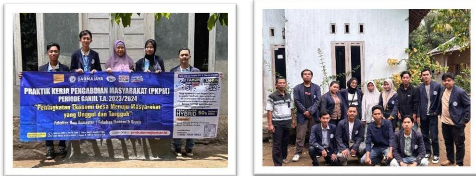
Gambar 2.5 foto bersama ibu pembimbing lapangan di posko

Kunjungan hari pertama kedatangan mahasiswa pkpm dan ibu dosen pembimbing lapangan ke posko.