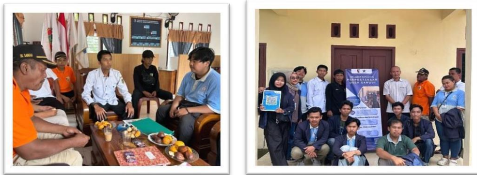
Gambar 2.19 Pemaparan Program Kerja Serta Perpisahan Dengan Aparat Desa