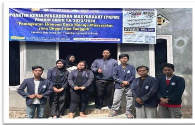
Gambar 2.18 Kunjungan DPL Ke Lokasi Pkpm