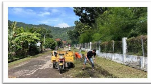
Gambar 2.11 gotong royong membersihkan desa bersama aparaturn desa dan warga