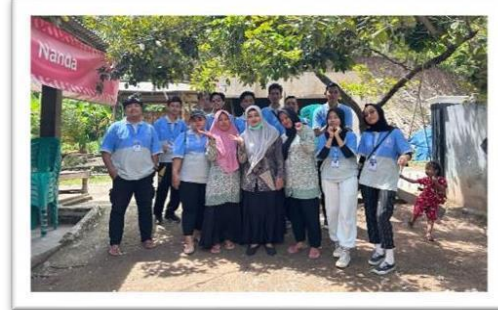
Gambar 2.7 mengikuti posyandu lansia dan senam bersama ibu-ibu desa sanggi

Perkenalan Dan Kunjungan Pemuda-Pemuda Desa Sanggi Di Posko Agar Mempererat Silaturahmi Antara Mahasiswa Dan Pemuda Desa.