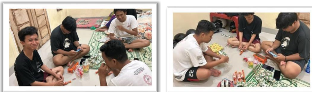
Gambar 2.15 Membuat Hadiah Untuk Sosialisasi Ke SDN 14 Padang Cermin Sosialisasi Kepada Anak-Anak Sekolah Tentang Komputer Dan Bahaya Internet Guna Mencerdaskan Generasi Muda