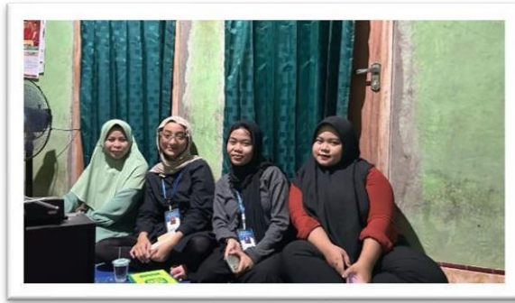
Gambar 2.10 mengikuti pengajian rawis bersama risma desa sanggi