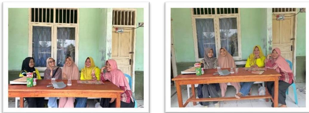
Gambar 2.17 Ikut Serta Dan Membantu Posyandu Anak-Anak Dan Ibu Hamil Didesa Sanggi

Mengikuti Dan Membantu Posyandu Anak-Anak Dan Ibu Hamil Di Desa Sanggi Piabung Guna Menjaga Kesehatan Dan Juga Mempererat Silaturahmi Antara Mahasiswa Dan Warga Desa.