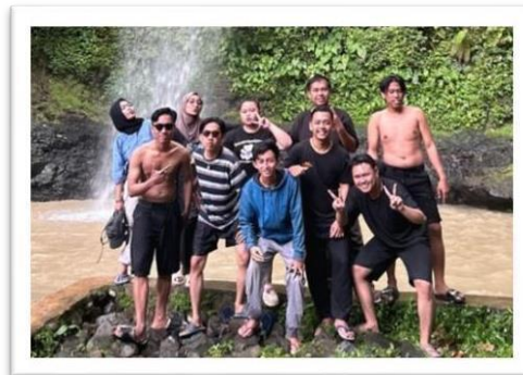
Gambar 2.9 mengunjungi air terjun randu kembar di way ratai

Mengikuti Pengajian Rawis bersama Risma Desa Sanggi Setiap Malam Sabtu