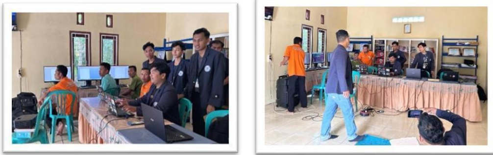
Gambar 2.13 pelatihan Ms.word kepada aparaturnya RT Desa Sanggi Silaturahmi Ibu Kades Dan Perkenalan Karang Taruna Serta Berdiskusi Tentang UMKM Didesa Sanggi.

Pelatihan Ms.Word Yang Diikuti Oleh Aparatur Desa Sanggi Seperti Rt Dan Kadus Yang Dilaksanakan Di Perpus Desa.