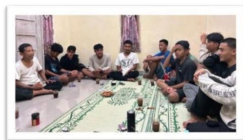
Gambar 2.8 perkenalan dan kunjungan pemuda-pemuda desa sanggi di posko

Mengunjungi Air Terjun Randu Kembar Yang Ada Didesa Way Ratai Bersama Kelompok Pkpm 01 ,03 Dan 10