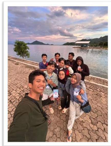
Gambar 2.12 mengunjungi wisata pantai sanggi