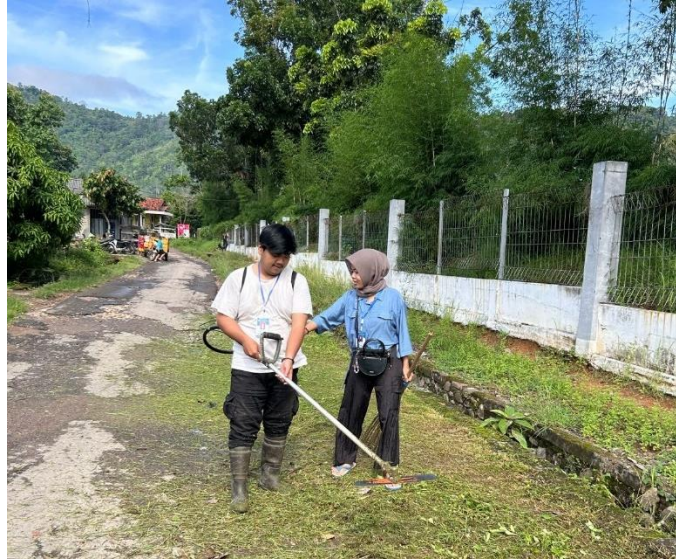
Gambar 2. 5 Gotong royong (Pembersihan selokan dan jalan Dusun Piabung)