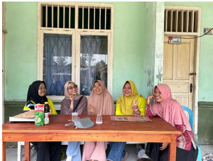
Gambar 2. 10 Posyandu Ibu dan Balita