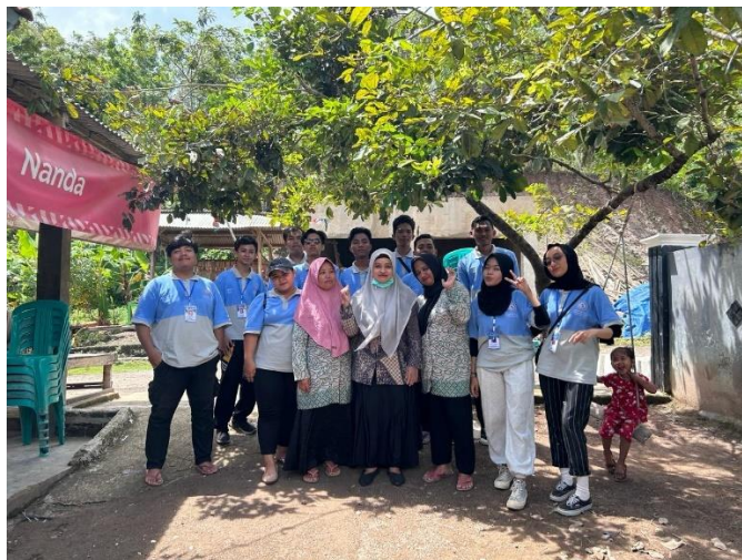
Gambar 2. 4 Panitia Posyandu Lansia dan senam