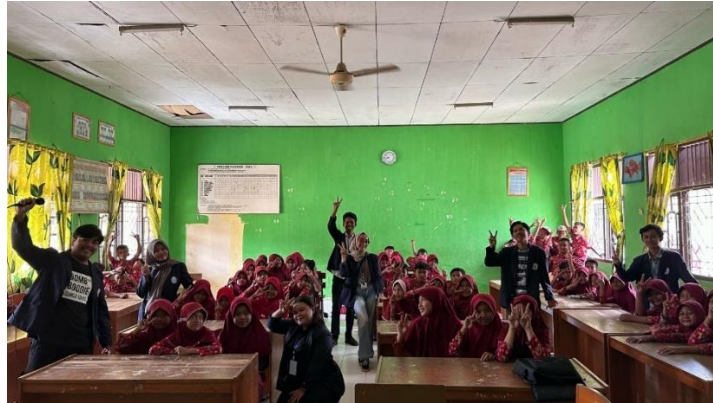
Gambar 2. 9 Sosialisasi Pengenalan Komputer dan bahaya internet SDN 14 Padang Cermin.