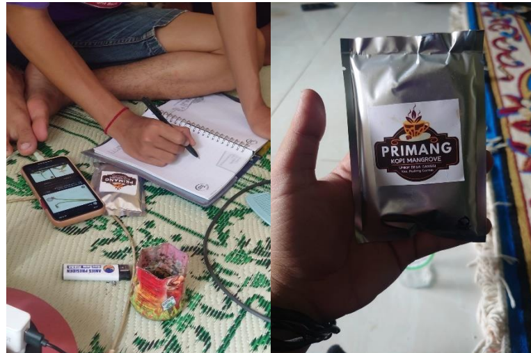
Gambar 2. 14 Pembuatan Revisi Logo, Kemasan dan Sosial media Primang

Kegiatan pembuatan Revisi Logo, Kemasan dan Sosial media Primang di lakukan di posko mahasiswa PKPM di rt 02 dusun piabung, desa sanggi.