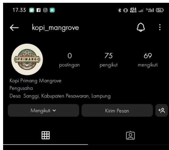
Gambar 2. 15 Hasil Revisi logo dan kemasan Primang Kopi Mangrove serta sosial media.