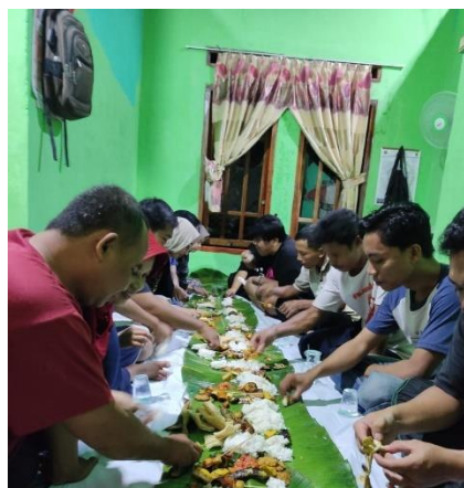
Gambar 2. 16 Makan Bersama Para RT Busun Piabung

Dalam rangka mempererat silaturahmi dengan para ketua RT Dusun piabung kami melakukan makan bersama sebelum hari kepulangan