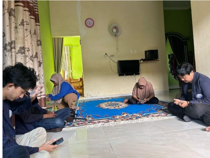
Gambar 2. 7 Kunjungan silaturahmi ke rumah, Kepala Desa, Dan UMKM Primang Kopi Mangrove