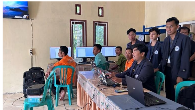
Gambar 2. 6 Pelatihan Ms Word membuat surat resmi bagi para ketua RT Dusun Piabung