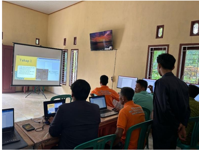
Gambar 2. 13 Kegiatan pelatihan membuat surat resmi