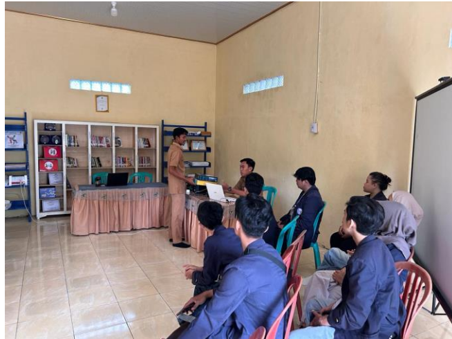
Gambar 2. 3 Sosialisasi dan Diskusi program kerja