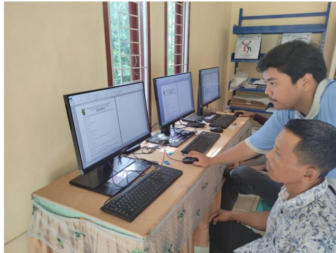
Gambar 2. 11 Pelatihan dan Penyerahan Template surat resmi bagi para ketua RT Dusun piabung