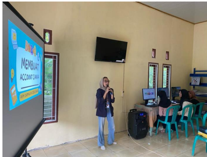
Gambar 2. 8 Pelatihan Canva Bagi Siswa/I Desa Sanggi