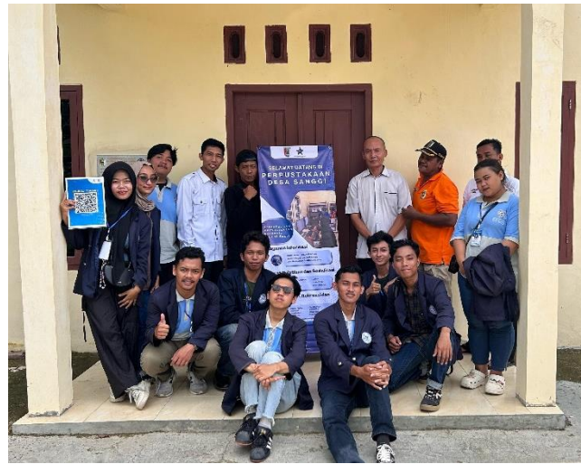
Foto Bersama Dengan Aparatur Dan Penyerahan Design Banner Perpustakaan Serta Scan QR Code Buku Tamu Balai Desa Sanggi Izin Undur diri