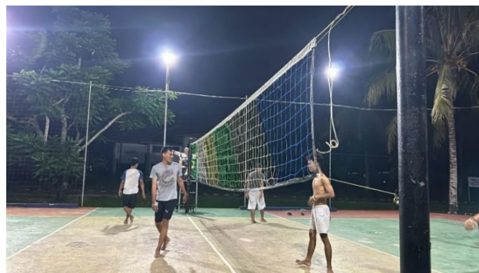
Sparring Volly Bersama Pemuda Dusun Piabung