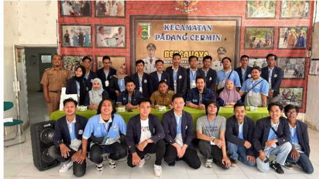
Penerimaan Mahasiswa PKPM di Kecamatan Padang Cermin