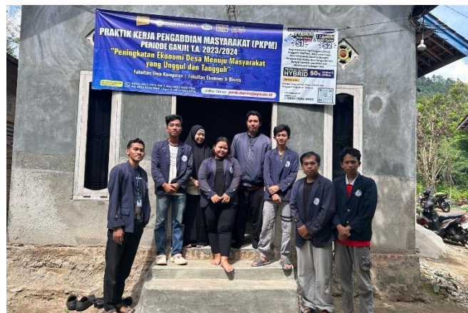
Kunjungan Dosen Pembimbing Lapangan Ke Posko Mahasiswa