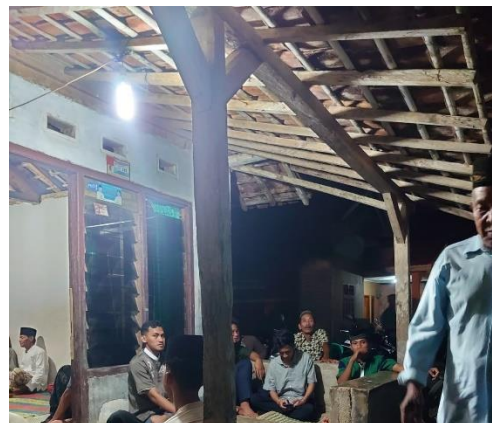
Kegiatan Tahlilan Di RT 02