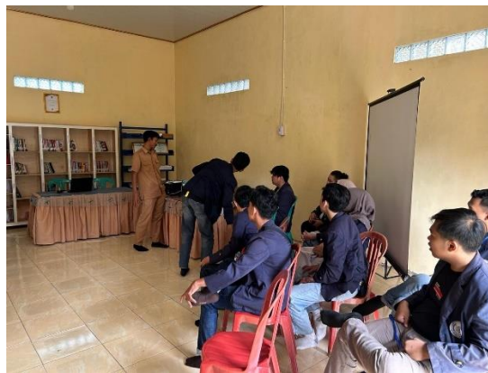
Penerimaan Mahasiswa PKPM di Balai Desa Sanggi