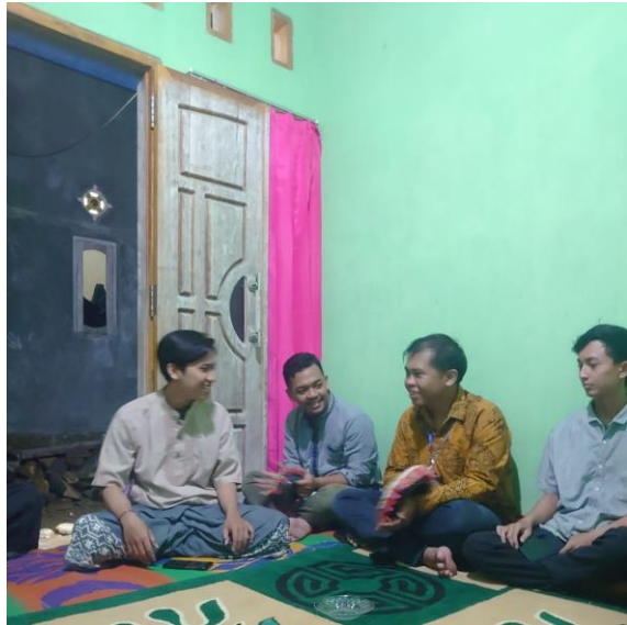
Kegiatan Rebana Dengan Risma Dusun Piabung