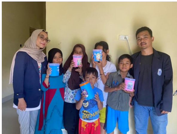
Mengajarkan cara membuat Tabungan menarik dari barang bekas kepada anak-anak