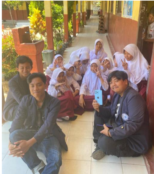
Melakukan Observasi Sebelum Sosialisasi Di SDN 14 Padang Cermin