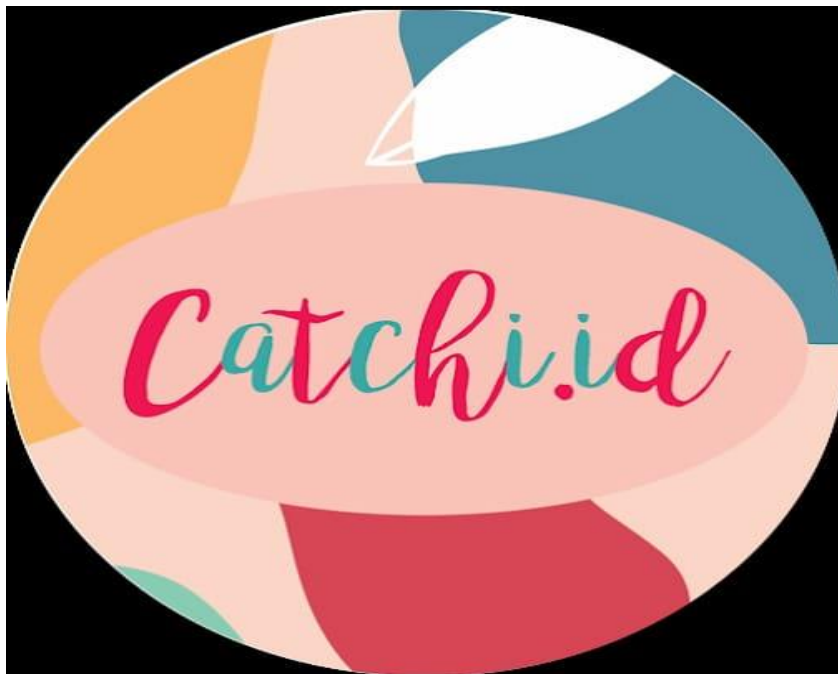
Gambar 2. Logo Toko Catchi id

Toko Catchi id yang bergerak di bidang Fashion seperti penjualan baju, celana, dan berbagai accessories yang di dirikan oleh Bapak Gilang Ramadhan Selaku direktur dari toko Catchi id pada tahun 2020, dan sangat di minati oleh para masyarakat dan penjualannya berkembang hingga saat ini.