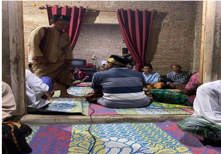
Kegiatan yasinan rutin malam jumat di desa ceringin asri