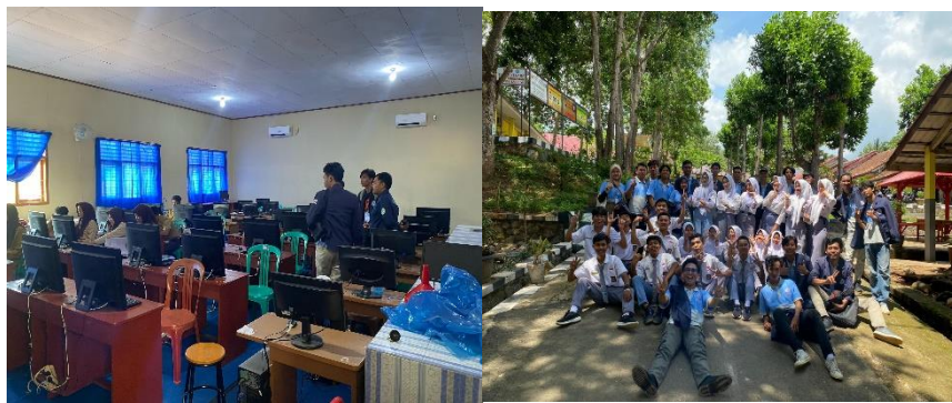
Berkunjung serta bersosialisai di SMAN 2 PADANG CERMIN