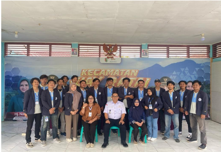
Perpisahan Bersama Aparatur Desa