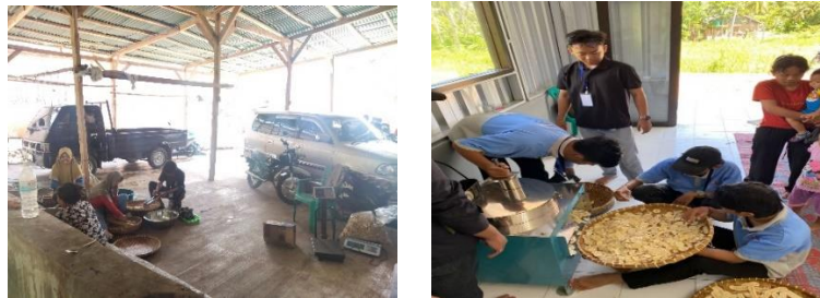
Gambar 2.1 Proses Produksi UMKM Keripik Pisang

kegiatan proses pembuatan keripik pisang dimana keripik pisang ini adalah suatu proyek usaha umkm yang ingin kami kembangkan.