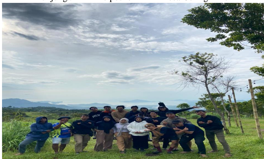
Mengunjungi Destinasi Wisata Alam