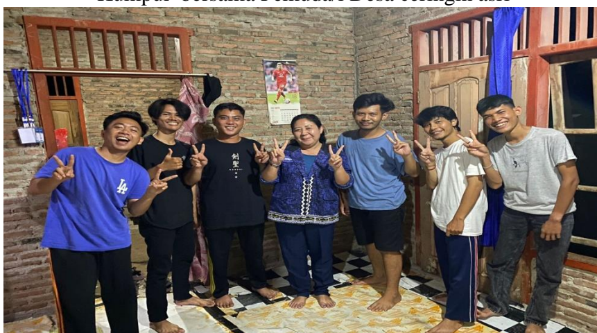
Kunjungan DPL ke posko PKPM Desa Ceringin Asri