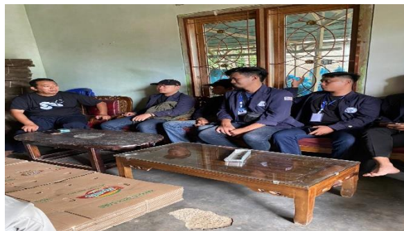
Bermusyawarah bersama kades di bangsal mengenai umkm