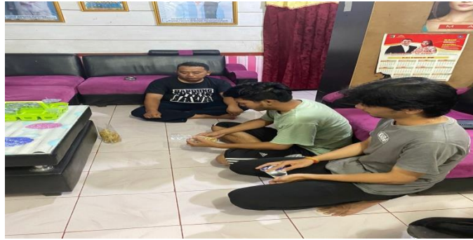
Kunjungan kerumah kades untuk musyawarah terkait pembahasan progja PKPM