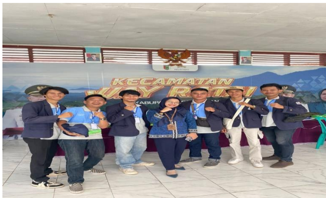
Pelepasan Mahasiswa PKPM