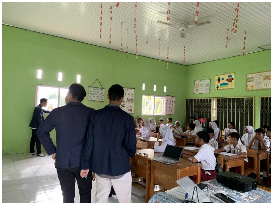
Gambar 2.3 Memberikan Materi Tentang Dampak Dari Internet

Pada kegiatan ini kami kelompok 7 melakukan sosialisasi dampak positif dan negatif dari internet . Sosialisasi ini kami berikan kepada siswa/i yang ada di SD 6 Tegal Arum Dusun 3. Disini kami memberikan penjelasan mengenai dampak apa saja yang mungkin terjadi dari internet baik itu dari segi positif dan segi negatif.