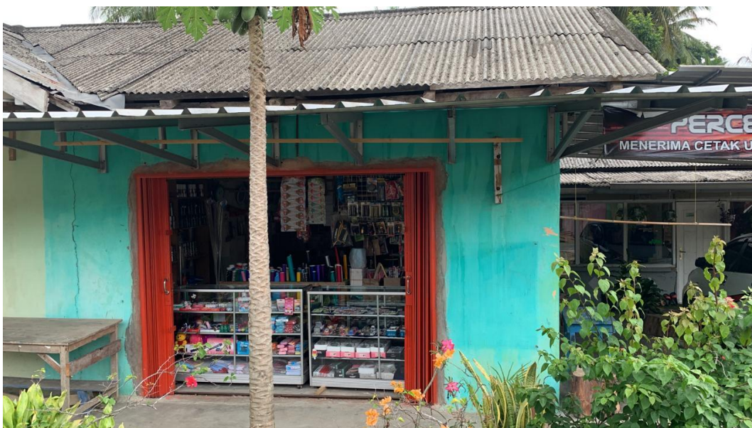
Gambar 2.9 UMKM Percetakan Dan Variasi Mobil Dusun 2