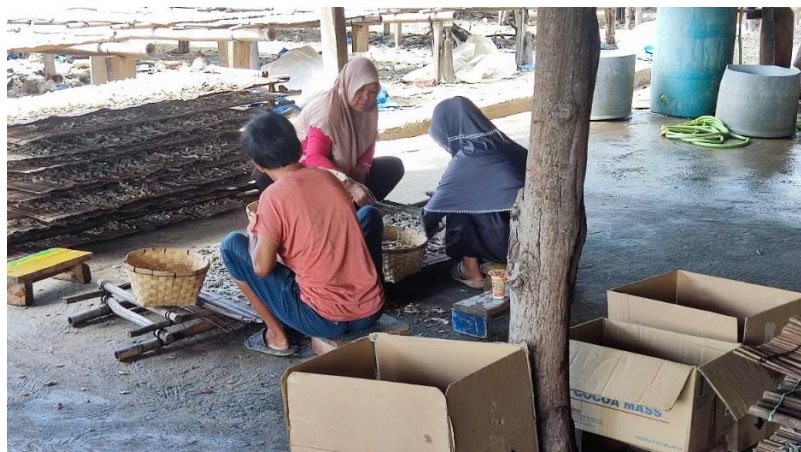
Gambar 2.1 Proses Pengambilan data UMKM

Program kerja individu yang saya kerjakan adalah inventaris dan pemetaan data UMKM di desa durian yang bertujuan untuk merekap data – data UMKM yang belum terdaftar di desa Durian dan merapihkan data tersebut kedalam bentuk Microsoft Excel .