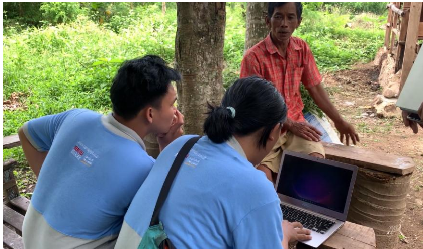
Gambar 2.5 Wawancara dengan pengurus kandang sapi