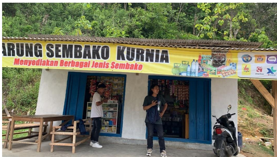
Gambar 2.7 Kunjungan UMKM Dusun 3