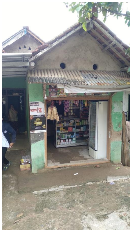
Gambar 2.11 UMKM Warung Kelontong Dusun 4