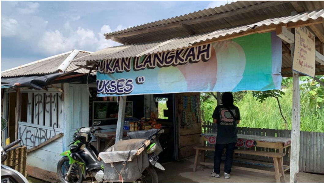
Gambar 2.10 UMKM Warung Kantin Dewe Dusun 3