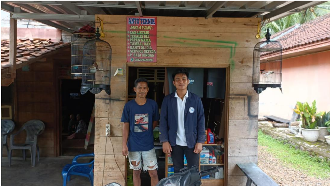
Gambar 2.8 UMKM Auto Teknik Dusun 1

Berikut beberapa dokumentasi yang sudah kami kumpulkan dari UMKM di setiap dusun desa Durian diantaranya.