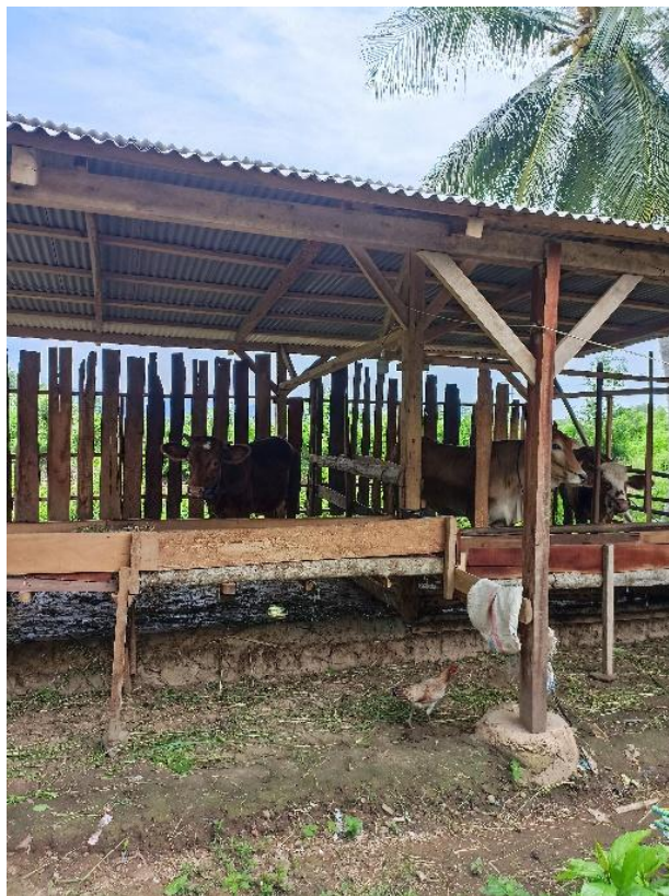
Gambar 2.4 Kandang Sapi Lokasi Pembuatan Biogas

Pada kegiatan ini kami kelompok 7 mengunjungi tempat peternakan sapi yang akan dijadikan rumah untuk biogas nantinya. Pada kegiatan ini kami mewawancarai bapak yang mengurus tempat kandang sapi untuk biogas.