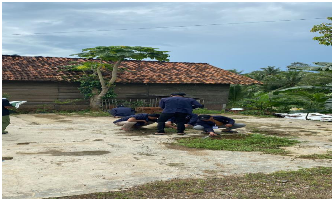
Melaksanakan Kegiatan Gotong Royong