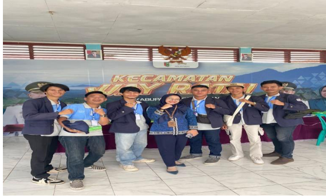
Pelepasan Mahasiswa PKPM