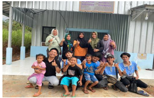
Proses Pembuatan kerupuk Talas bersama ibu pkk