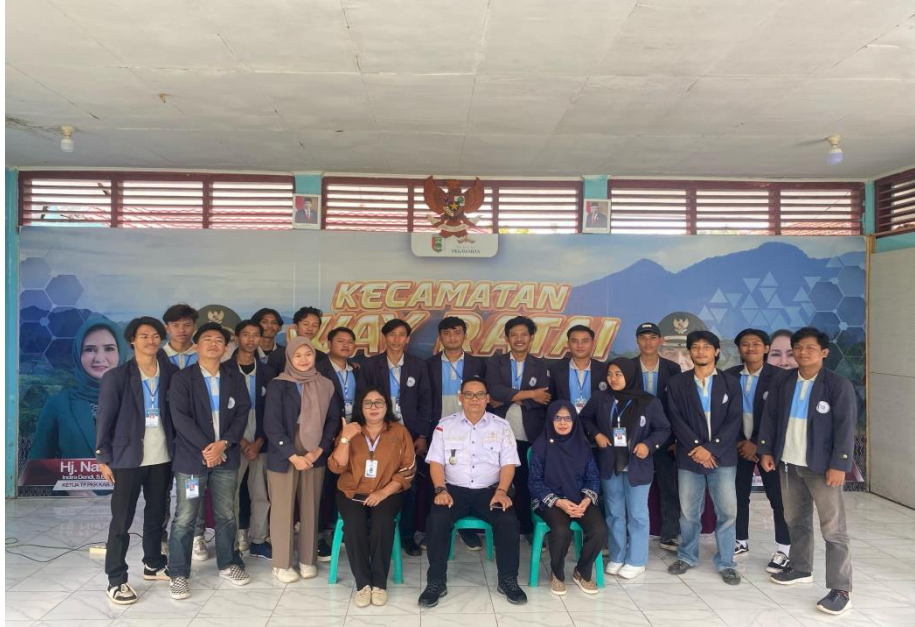
Perpisahan Bersama Aparatur Desa