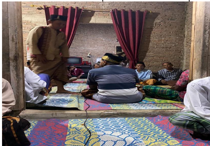
Kegiatan yasinan rutin malam jumat di desa ceringin asri