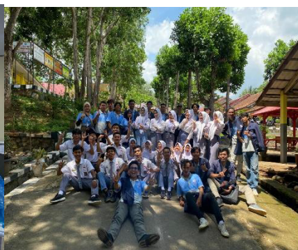
Berkunjung serta bersosialisai di SMAN 2 PADANG CERMIN