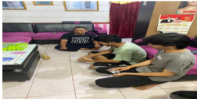
Kunjungan kerumah kades untuk musyawarah terkait pembahasan progja PKPM