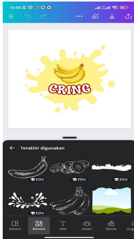
Gambar 1.3 Tampilan Logo Kerpik Pisang