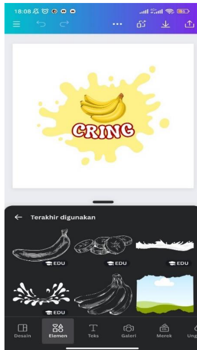
Gambar 1.2 Pembuatan Logo

Melakukan desain logo Keripik Pisang yang bertujuan untuk menarik konsumen sehingga dapat meningkatkan penjualan dan memperluas pasar.