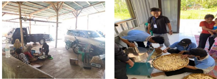
Gambar 2. 1 Proses Produksi UMKM Keripik Pisang

kegiatan proses pembuatan keripik pisang dimana keripik pisang ini adalah suatu proyek usaha umkm yang ingin kami kembangkan.