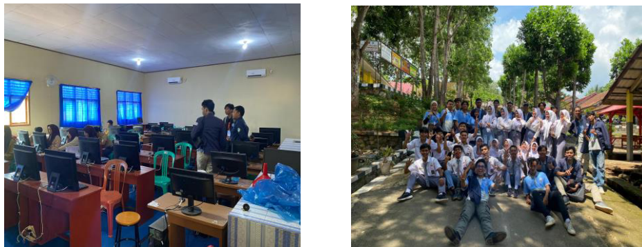
Gambar 2. 2 sosialisasi dan memberi materi kepada siswa/i sman 2 padang cermin

Dalam kegiatan ini bertujuan untuk membantu dan mengajarkan bagaimana cara membuat cv dan sertifikat yang menarik. Terutama berguna untuk siswa/i menjelaskan Riwayat hidup selengkap lengkapnya pada saat ingin melamar suatu pekerjaan di perusahaan.