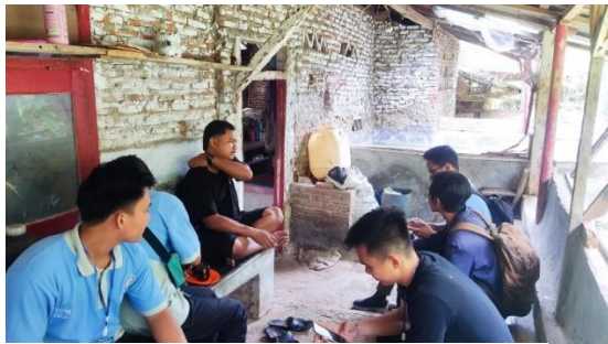
Gambar 2. 4 perbincangan mengenai ayam sekdes yang ada di desa durian