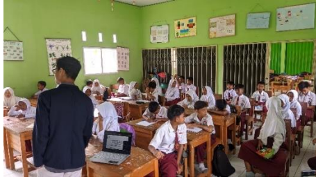
Gambar 2. 12 sosialisasi di SDN Desa Durian

13. Mencari titik koordinat umkm desa durian