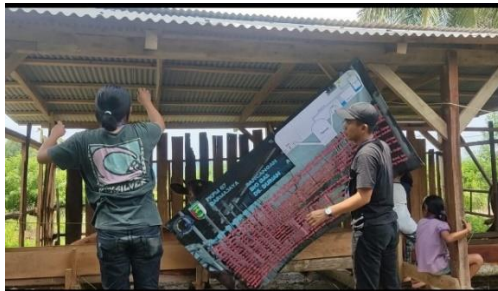
Gambar 2. 14 Pemasangan banner

14. Pemasangan benner biogas yang ada di desa durian