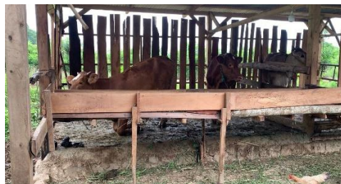
Gambar 2. 8 Melakukan surfey biogas