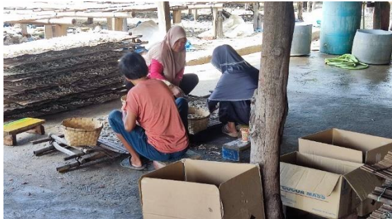
Gambar 2. 3 Produksi ikan asin