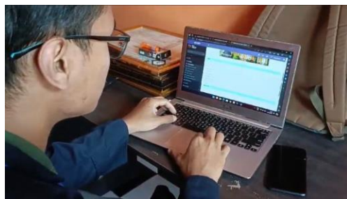
Gambar 2. 7 Melanjutkan pekerjaan web