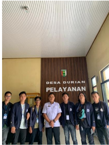
Gambar 2. 5 penyusunan web