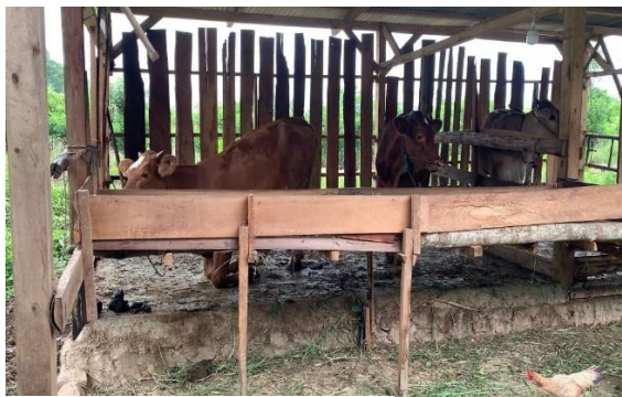
Gambar 2. 6 Survey lokasi biogas