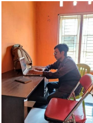
Gambar 2. 15 Pembuatan video

15. Membuat persentasi melalui vidio selama di desa durian