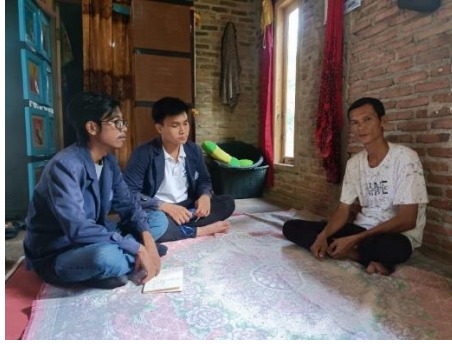
Gambar 2. 2 Perbincangan umkm