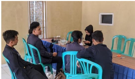
Gambar 2. 1 perbincangan web