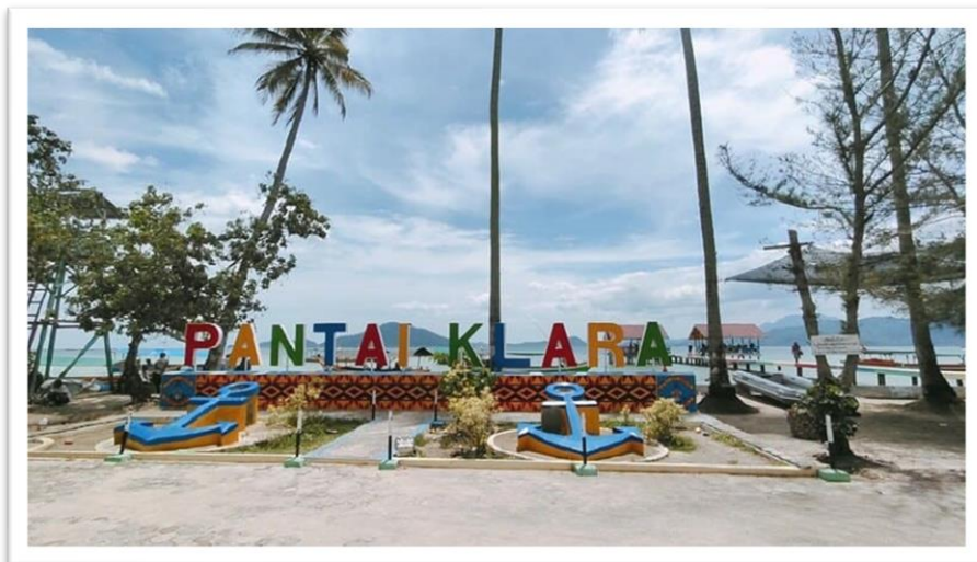
Gambar 2. 2 Pantai Klara 1

terdapat UMKM yang menghasilkan kerajinan tangan seperti anyaman bambu dan souvenir-souvenir unik, serta UMKM yang memproduksi makanan khas daerah seperti kerupuk tradisional dan dodol. Selain itu, ada juga UMKM yang fokus pada pertanian organik, produk kreatif seperti hiasan dinding alami, dan kerajinan kayu seperti patung kecil dan perabotan rumah tangga. Produk-produk kesehatan dan kecantikan alami juga dihasilkan oleh sebagian UMKM di desa ini. Pengembangan homestay dan penginapan oleh beberapa warga juga menjadi bagian dari UMKM yang berkembang di Batu Menyan. Semua UMKM ini tidak hanya memberikan peluang ekonomi bagi masyarakat, tetapi juga menjadi daya tarik bagi wisatawan yang berkunjung dengan menyediakan produk-produk unik dan autentik. Salah satu sumber daya manusia yang ada di Desa Batu Menyan ada pada gambar 2.2.