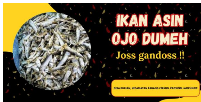
Gambar 3. Proses Pembuatan Feed Instagram UMKM

Pembuatan Feed instagram ini sebuah strategi berupa pembuatan desain platform media sosial seperti instagram dan foto catalog. Dalam implementasiannya,