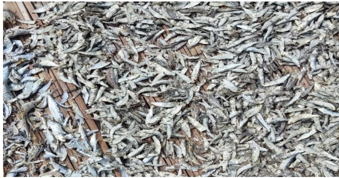
Gambar 1. Produk Ikan Asin Ojo Dumeh

Pengeringan atau pengasinan, baik dengan garam kering maupun air garam, adalah satu-satunya metode pengawetan ikan yang tersedia secara luas sampai abad ke-19. Ikan kering dan ikan asin (atau ikan kering dan asin) adalah makanan pokok di Karibia, Afrika Barat, Afrika Utara, Asia Selatan, Asia Tenggara, Tiongkok Selatan, Skandinavia, sebagian Kanada termasuk Newfoundland, pesisir Rusia, dan kutub Utara. Seperti daging asin lainnya, ia menyediakan protein hewani yang diawetkan bahkan tanpa pendinginan.