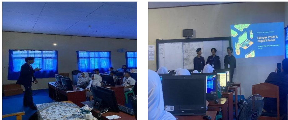
Gambar 11 Sosialisasi ke SMA 2 Padang Cermin

Sosialisasi ke SMA 2 Padang Cermin dilaksanakan pada 20-21 februari 2024, tujuan dilakukannya sosialisasi ke SMA untuk memberikan wawasan tambahan bagi para murid untuk bekal dimasa depan nantinya