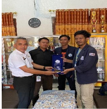
Gambar 12 Penyerahan plakat kepada kepala sekolah