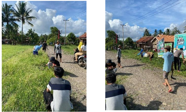
Gambar 4 Kerja bakti dengan warga setempat

Kerja bakti bersama warga dusun Bumi Rejo dilaksanakan 09 februari 2024, kerja bakti dilakukan berupaya untuk membersihkan lingkungan disekitar dusun Bumi Rejo dan juga untuk membentuk ikatan dengan warga sekitar