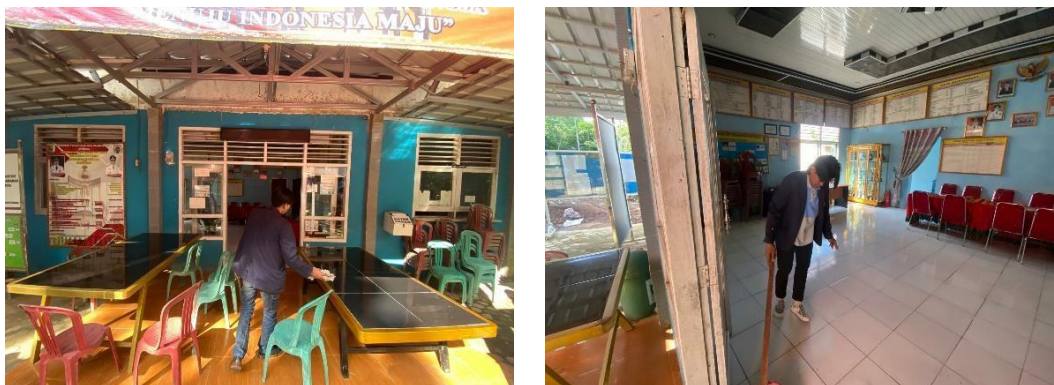
Gambar 7 Piket Balai Desa

Piket Balai Desa dilaksanakan pada Senin, 12 Februari 2024. Piket membersihkan balai desa di Wates Wayratai adalah tanggung jawab bersama untuk menjaga kebersihan dan keteraturan tempat tersebut. Dengan bergantian piket, gotong royong melakukan kegiatan pembersihan, merapikan ruangan, dan memastikan kenyamanan serta keindahan balai desa sebagai pusat kegiatan yang selalu dilakukan di Balai Desa Wates Way ratai.