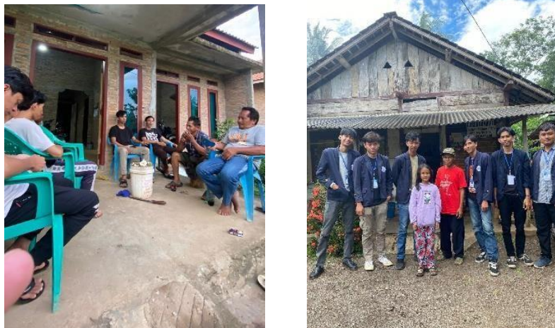
Gambar 5 Kunjungan Ke Rumah RT dan Warga Di Dusun Setempat

Kunjungan ke kediaman kepala dusun dan rt di dusun Bumi Rejo dilaksanakan pada 10 februari 2024, sebagai perkenalan dari kelompok PKPM sekaligus mencari informasi yang dibutuhkan untuk program kerja yang akan dilaksanakan kedepannya.