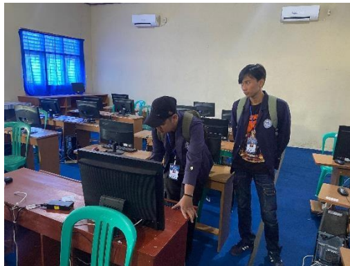
Gambar 10 Survey Lokasi dengan pihak SMA 2 Padang Cermin

Konsolidasi ke SMA 2 Padang Cermin dilaksanakan pada 16 februari 2024, melakukan kordinasi dengan pihak sekolah terkait sosialisasi yang akan dilakukan kelompok PKPM terhadap murid SMA 2 Padang Cermin