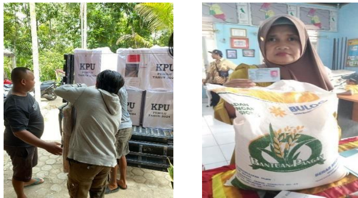
Gambar 8 Membantu Pelayanan Masyarakat

Dalam kegiatan ini membantu pelayanan masyarakat di Balai Desa Wates Wayratai adalah langkah positif untuk berkontribusi dalam kemajuan komunitas. Ini dapat mencakup memberikan informasi kepada warga, membantu administrasi, atau terlibat dalam program sosial yang bertujuan meningkatkan kesejahteraan masyarakat setempat. Dengan keterlibatan aktif, Turut berperan dalam membangun hubungan yang harmonis dan pelayanan masyarakat yang lebih baik.