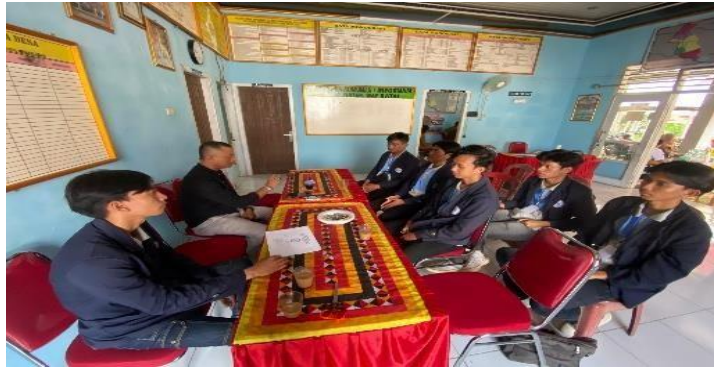
Gambar 6 Pertemuan dengan kepala desa

Pertemuan dengan kepala desa Wates Way Ratai dilaksanakan pada 12 februari 2024, pertemuan dengan kepala desa Wates Way Ratai bermaksud untuk pemaparan program kerja yang akan dilaksanakan.