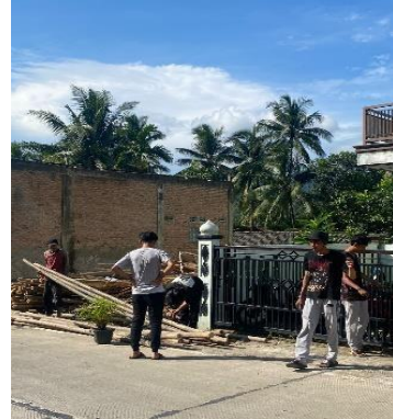
Gambar 13 Gotong Royong di Masjid