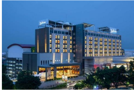
Gambar 2.1 Bentuk Perusahaan Radisson Lampung Kedaton Hotel

Radisson Hospitality, Inc. (berdagang sebagai Radisson Hotel Group) adalah perusahaan perhotelan multinasional Amerika. Ini dimulai sebagai divisi dari Carlson Companies, yang memiliki Radisson Hotels, Country Inns & Suites, dan merek lainnya. Pada tahun 1994, Carlson menandatangani perjanjian waralaba dengan SAS International Hotels (SIH), setelah itu SIH mulai menggunakan merek Radisson SAS di pasar Eropa, Timur Tengah, dan Afrika. Pada tahun 2005, Carlson mengakuisisi 25% saham SIH, yang saat itu dikenal sebagai Rezidor SAS Hospitality. Pada tahun 2010, Rezidor Hotel Group (sebelumnya Rezidor SAS) menjadi anak perusahaan Carlson. Grup hotel yang diperbesar mengadopsi nama dagang baru, Carlson Rezidor Hotel Group, yang merupakan salah satu perusahaan perhotelan teratas pada tahun 2013.[7]