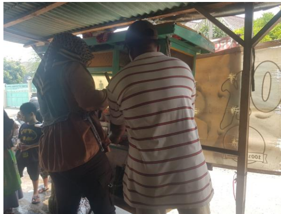
Gambar 3.4 Lokasi Bakso Atok