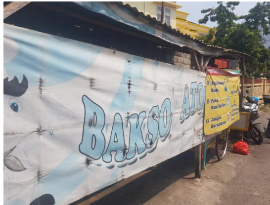
Gambar 3.3 Lokasi Bakso Atok