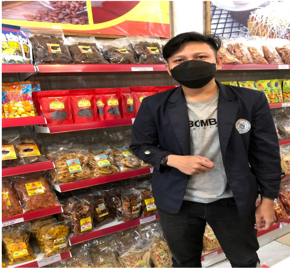
Gambar 7 proses Penelitian