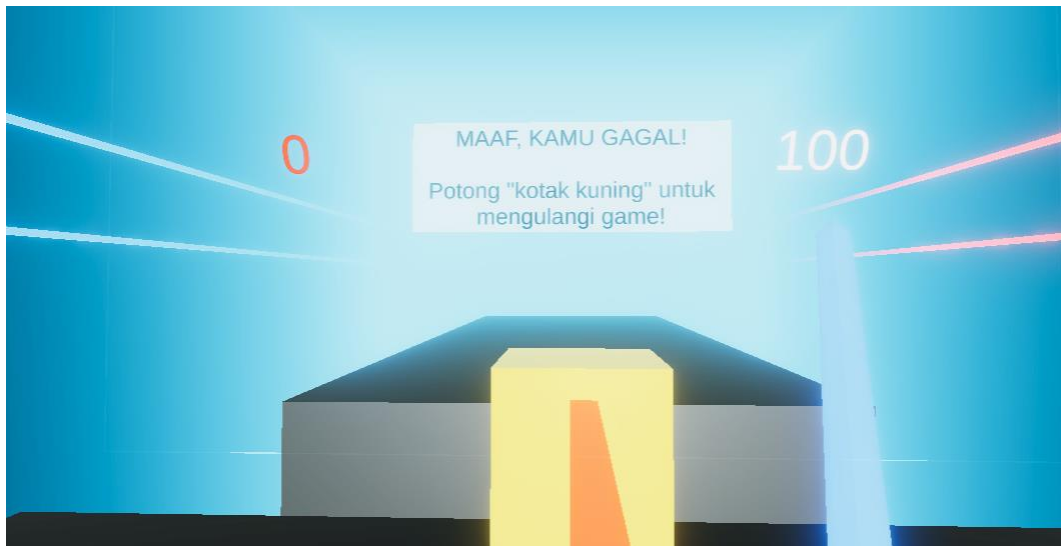
Gambar 8 Scene Game Over

Pada scene ini, tampilan notifikasi akan muncul yang bertuliskan bahwa game sudah selesai. Dan terdapat perintah untuk kita melakukan aksi menggunakan saber kita terhadap box berwarna kuning apabila kita ingin memulai permainan kembali.