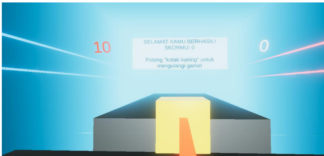
Gambar 9 scene end game

Pada scene end game ini merupakan tampilan game ketika kita berhasil menyelesaikan permainan hingga hingga sampai akhir lagu. Maka pesan yang akan muncul berupa score yang sudah kita peroleh dan box berwarna kuning yang harus kita hit menggunakan saber kita apabila kita ingin bermain kembali.