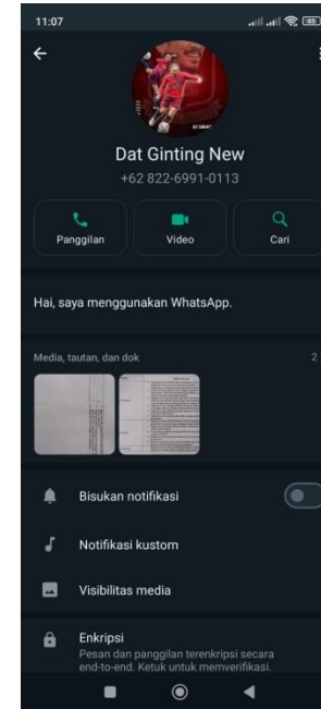
Lampiran 2. Daftar Dokumentasi Wawancara Narasumber