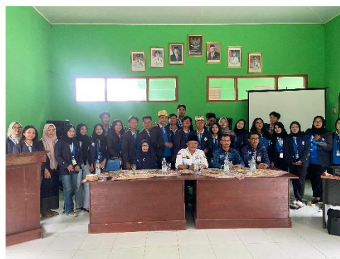
Gambar 19 Penjemputan Mahasiswa PKPM Di Kantor Kecamatan Kedondong