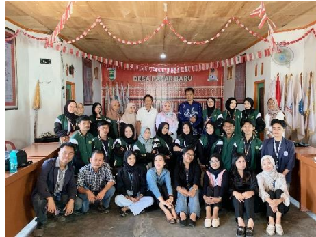
Gambar 8 Menghadiri Acara Pelepasan Kkn Umpri & Uin Ril