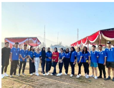
Gambar 9 Berpartisipasi Dalam Kegiatan Jalan Sehat Kecamatan Kedondong