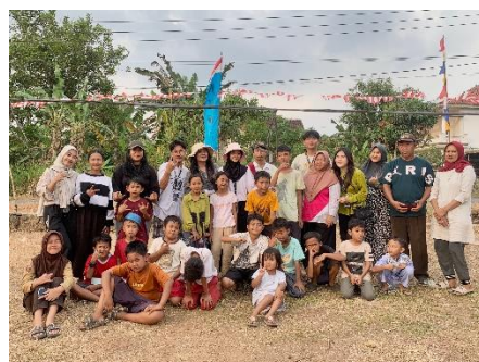
Gambar 7 Pelaksanaan Lomba Hut Kemerdekaan Ri