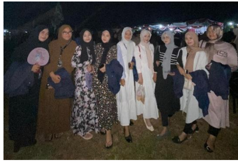
Gambar 10 Menghadiri Acara Kedondong Bersholawat