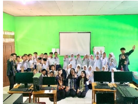
Gambar 15 Melakukan Sosialisasi Ke Mts