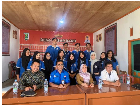
Gambar 2 Pengantaran Oleh Dpl Dan Penerimaan Peserta Pkpm Dibalai Desa Pasar Baru