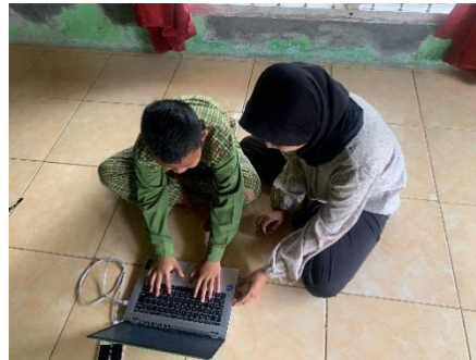
Gambar 5 Pengenalan Dasar Komputer Pada Anak-Anak Desa Pasar Baru