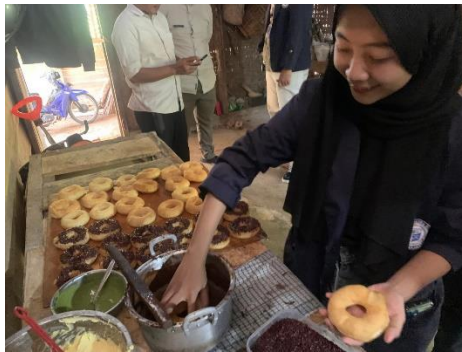
Gambar 11 Kunjungan Umkm