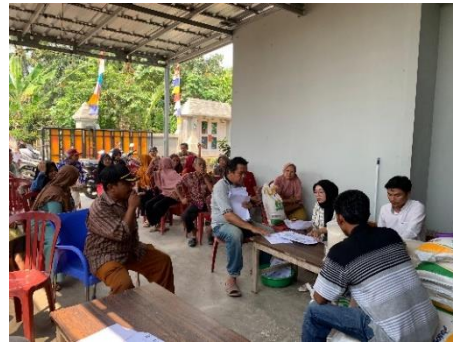
Gambar 16 Membantu Kegiatan Penyaluran Blt-Dd