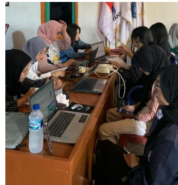
Gambar 17 Kegiatan Rutin Piket Balai Desa