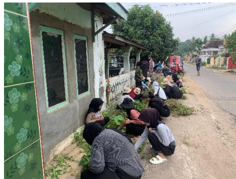
Gambar 13 Gotong Royong Dengan Warga Setempat