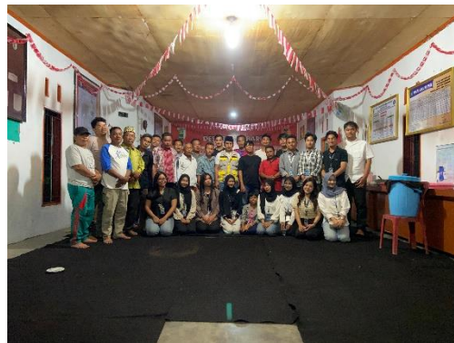
Gambar 18 Acara Perpisahan Mahasiswa Pkpm Di Balai Desa Pasar Baru