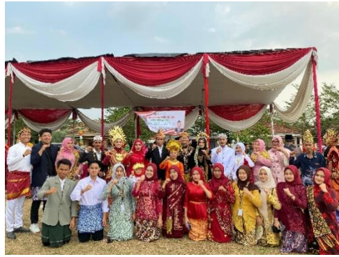
Gambar 12 Berpartisipasi Dalam Acara Festival Budaya Kecamatan Kedondong