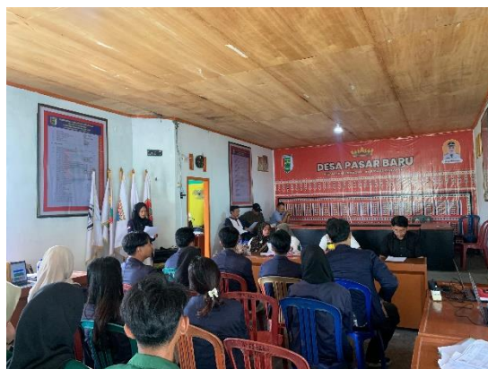
Gambar 3 Pemaparan Program Kerja Di Balai Desa Pasar Baru