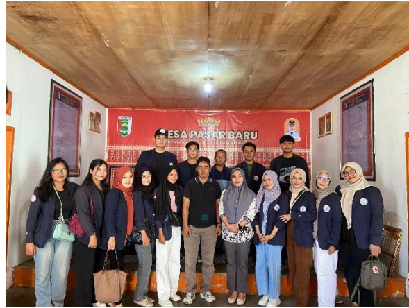
Gambar 1 Survei Lokasi Dan Permintaan Izin Kepada Kepala Desa Pasar Baru