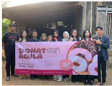
Gambar 14 Penyerahan Dan Pemasangan Banner Umkm