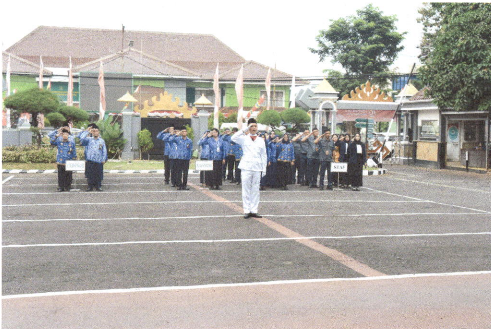
Mengikuti Upacara HUT RI ke-79 di Pengadilan Tinggi Tanjungkarang