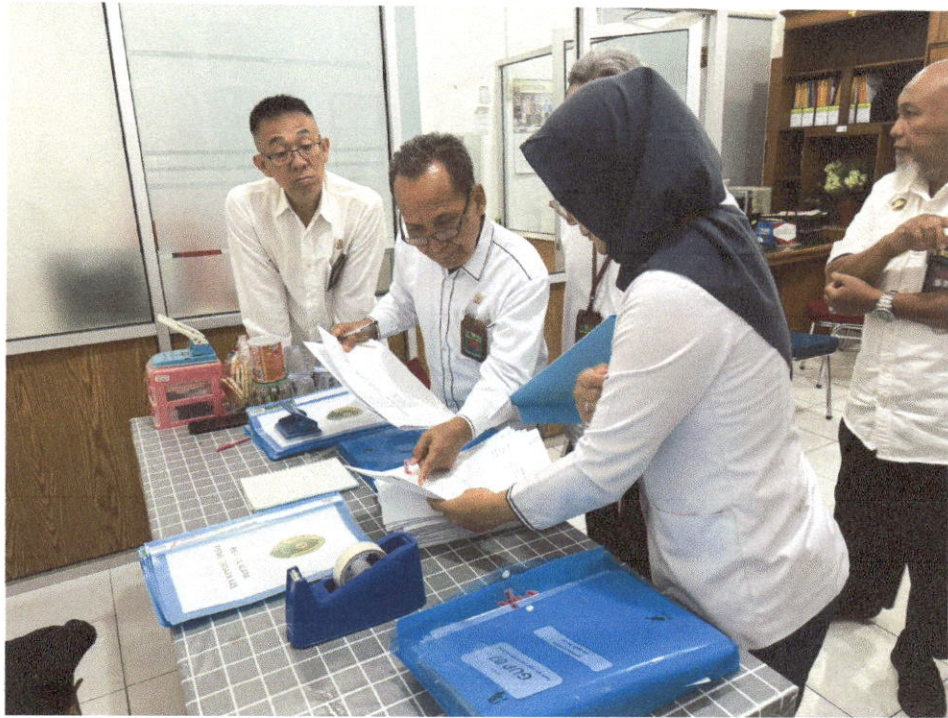
Audit Internal Bagian Keuangan oleh Tim Audite