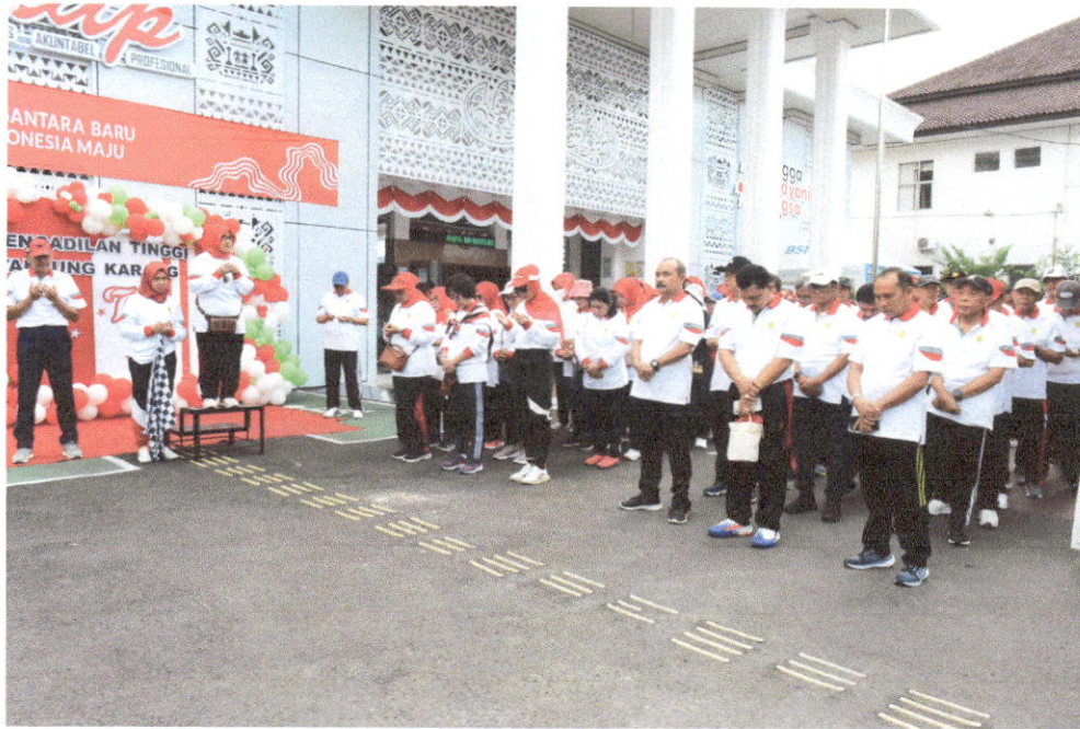
Mengikuti Kegiatan Jalan Sehat dalam Rangka HUT Mahkamah Agung RI ke-79 di Pengadilan Tinggi Tanjungkarang