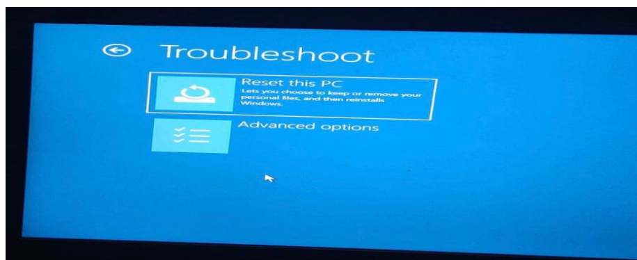
Gambar 4.1 Tampilan Troubleshoot safe mode

Tampilan perbaikan system operasi pada Hotel agar dapat digunakan dengan maksimal tanpa kendala. Hal ini merupakan langkah penting dalam meningkatkan kinerja staff yang menggunakan alat operasional di Hotel. Tampilan perbaikan system operasi dapat dilihat pada gambar 4.1