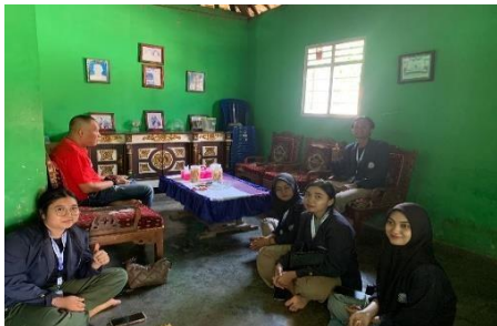
Silaturahmi kerumah Kepala Desa Kagungan Ratu