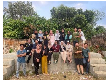
Jalan Sehat Bersama di Desa Pejambon