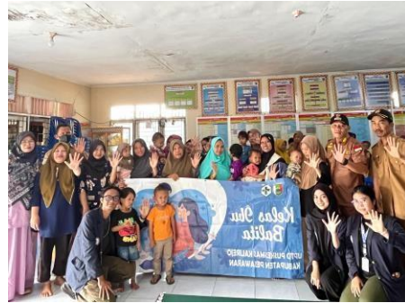
Kegiatan Posyandu di Balai Desa