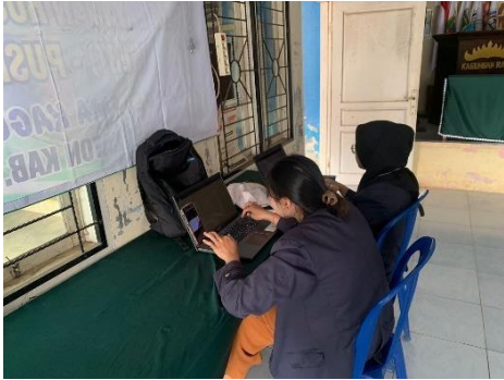
Kegiatan rutin piket Balai Desa