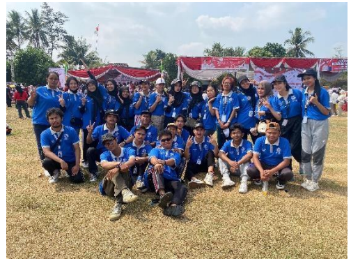
Penyerahan Banner UMKM