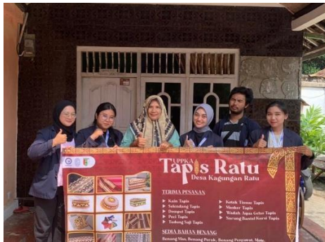
Pemapanan Hasil Program Kerja