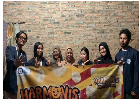
Penyerahan cendramata Creativ Maps