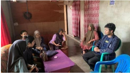
Survey Desa Kagungan Ratu oleh Mahasiswa PKPM