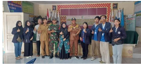
Pelepasan Mahasiswa PKPM oleh DPL