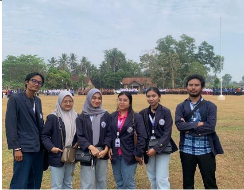
Penyerahan Banner UMKM