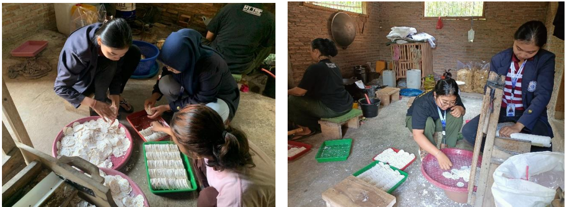
Gambar 2.5 Ikut serta pembuatan dan pengemasan Keripik Tempe

Mahasiswa ikut adil dalam pembuatan proses keripik Tempe koin Harmonis