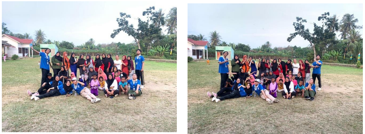
Gambar 2.7 Kegiatan Senam Bersama ibu ibu Dusun Wonorejo

Melakukan kegiatan Bersama ibu ibu dusun wonorejo setiap hari Minggu sore