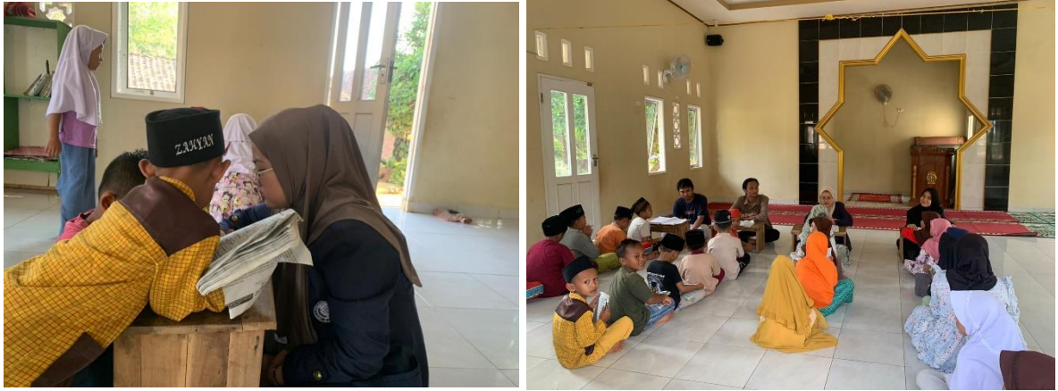
Gambar 2.6 Berpartisipasi Dalam Kegiatan Mengajar Ngaji

Kegiatan rutin yang dilakukan setiap hari Rabu dan Sabtu dilakukan di dusun Wonorejo