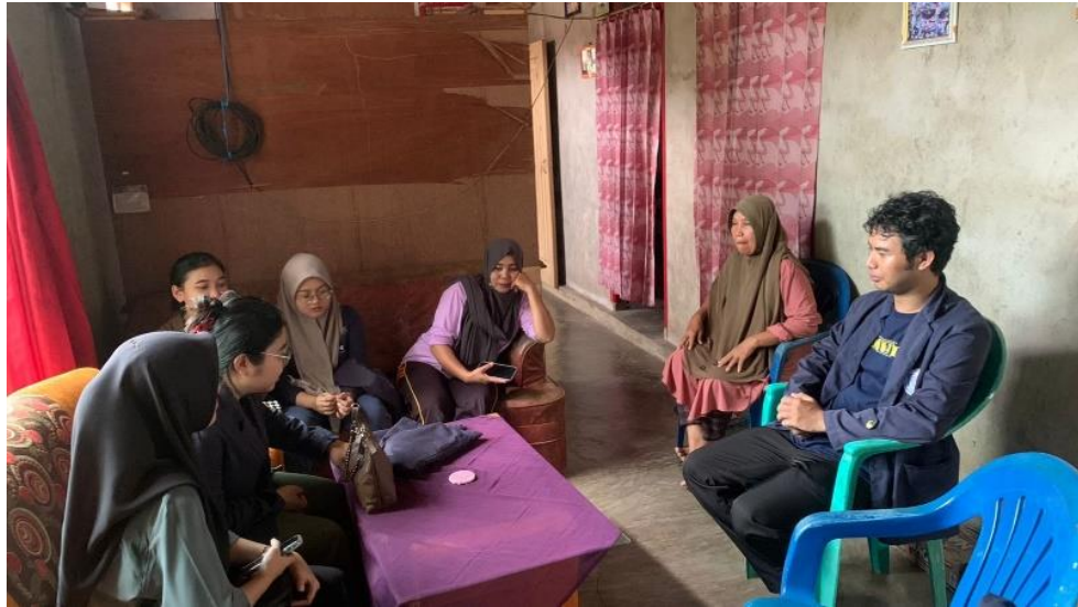
Gambar 2.1 Survey Lokasi dan mendata UMKM

Melakukan survei lokasi kegiatan Praktek Kerja Pengabdian Masyarakat ( PKPM) di Desa Kagungan Ratu Tujuan dari survei tersebut adalah untuk mengetahui lokasi serta mengidentifikasi dan mengenali UMKM yang memiliki keunggulan dalam berbagai aspek seperti produk, inovasi, kualitas, dan pemasaran