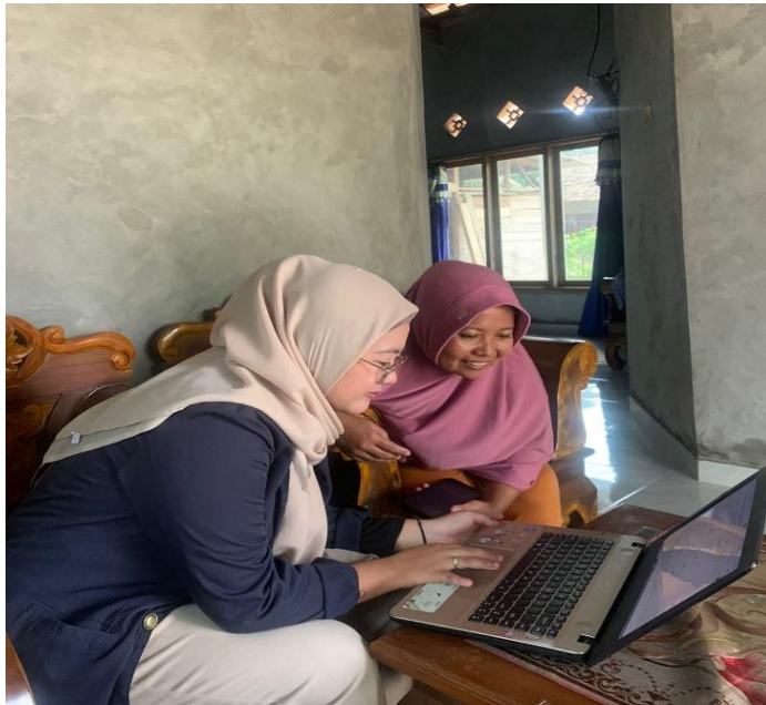
Gambar 2.4 Pendampingi Penerbitan NIB