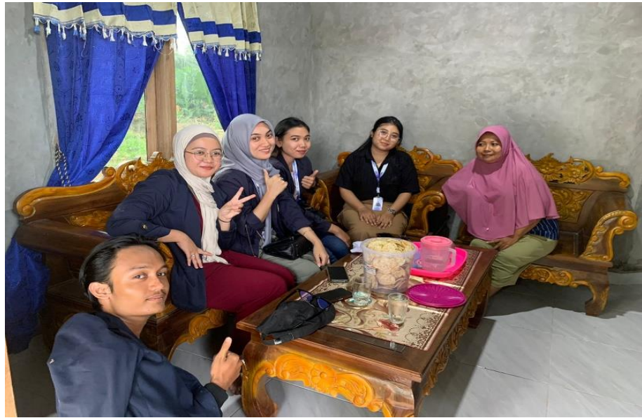
Gambar 2.2 Survey Lokasi UMKM