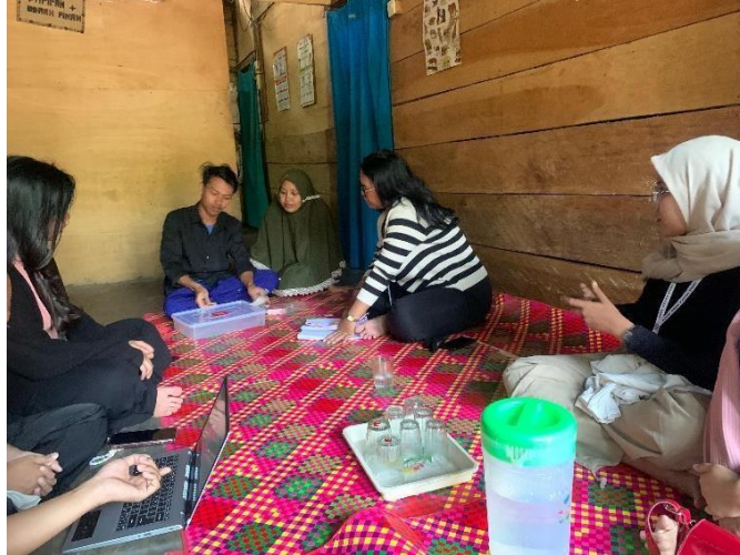
Gambar 2.1 Kunjungan ke UMKM

Kunjungan ke pemilik UMKM Donat Aqila dan meminta izin untuk keberlangsungan kegiatan. Hal ini diperlukan untuk menjalin silaturahmi dengan pemilik UMKM agar mahasiswa/i memiliki hubungan yang baik dengan UMKM dan juga dapat mempererat ikatan dalam membantu mengembangkan UMKM selama kegiatan PKPM.