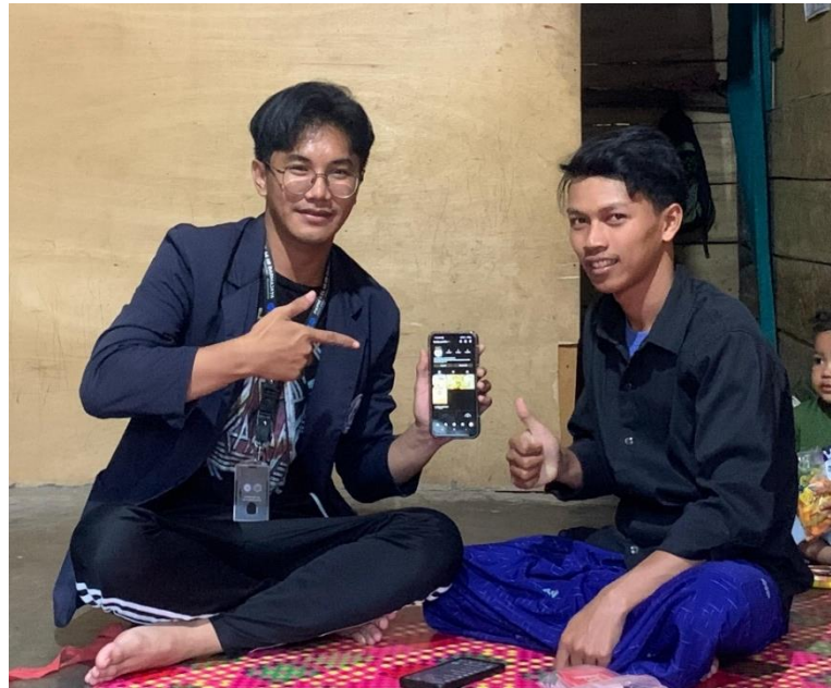
Gambar 2.2 Penyerahan Akun Media Sosial Instagram ke UMKM Donat Aqila

Media sosial saat ini menjadi sarana untuk mempromosikan suatu produk agar lebih dikenal masyarakat luas dan mendapatkan lebih banyak konsumen. Dalam kegiatan ini dilakukan pembuatan akun instagram guna untuk meningkatkan pemasaran melalui platform media sosial, agar bisnis donat ini memiliki pangsa pasar yang luas serta lebih di kenal oleh masyarakat luas. dengan pemanfaatan media sosial sebagai alat media promosi ini, kami juga memberikan dasar pengenalan strategi apa yang harus digunakan dalam mempromosikan suatu produknya agar lebih di kenal oleh masyarakat, informasi yang kami sampaikan mengenai dasar dasar pemasaran digital mulai dari cara membuat konten yang menarik, menggunakan tagar yang tepat, mengelola akun secara konsisten untuk meningkatkan engagement serta pengoptimalan media sosial untuk mendatangkan keuntungan bagi UMKM. Dalam hal ini juga kami terus memantau dan memperhatikan hasil yang di dapatkan oleh pemilik UMKM dalam memasarkan bisnisnya ke dalam media sosial.