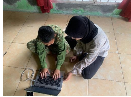
Pengenalan Komputer Pada Anak-anak Desa Pasar Baru