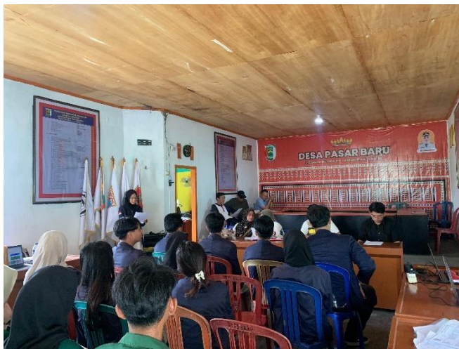
Pemaparan Progja yang Akan Dilaksanakan