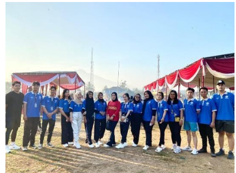
Berpartisipasi Dalam Kegiatan Jalan Sehat Kecamatan Kedondong