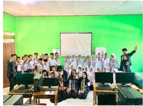
Sosialisasi ke MTs