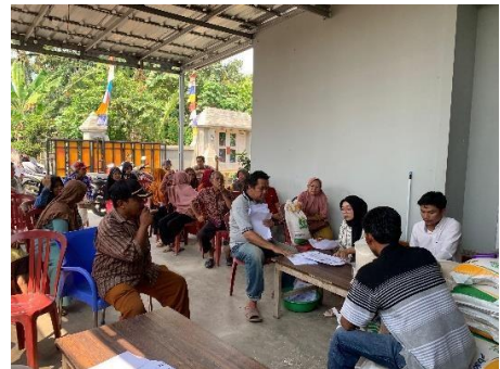
Membantu Kegiatan Penyaluran BLT-DD