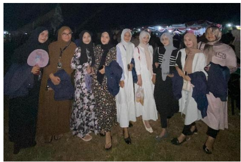
Menghadiri Acara Kedondong Bersholawat