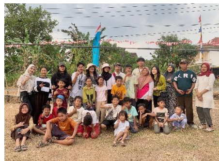
Pelaksanaan Lomba HUT Kemerdekaan RI