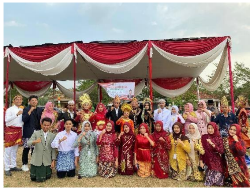
Berpartisipasi Dalam Acara Festival Budaya Kecamatan Kedondong