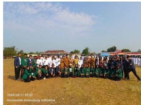
Upacara Memperingati Hari Kemerdekaan