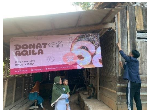
Penyerahan dan Pemasangan Banner UMKM