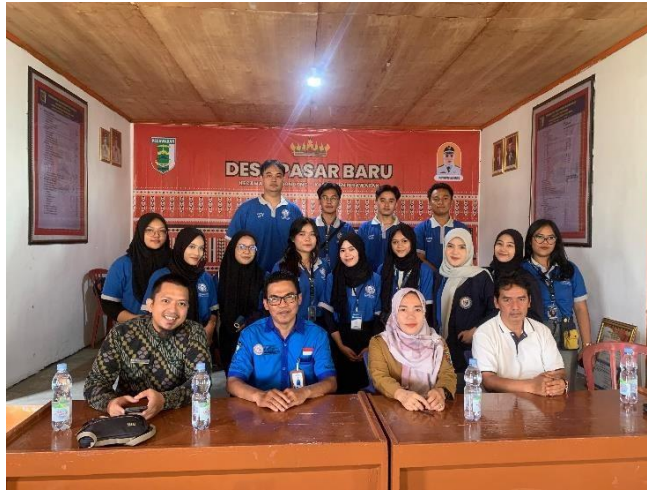
Penyambutan di Balai Desa