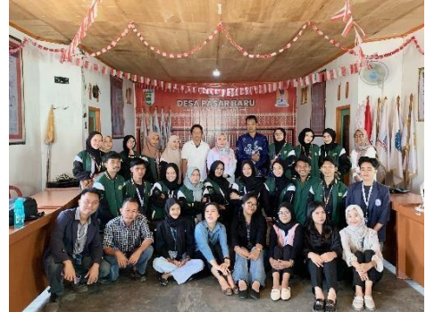
Menghadiri Acara Pelepasan KKN UMPRI & UIN RIL