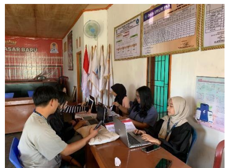
Kegiatan Rutin Piket Balai Desa