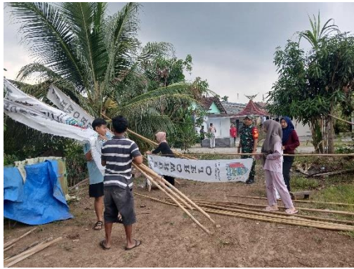
Pemasangan Umbul Umbul