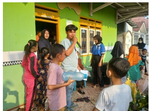
Pembagian hadiah 17 Agustusan