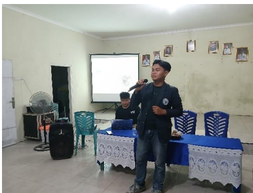
Acara Loka Karya dan Sosialisasi Cyber Crime Bersama Aparat Desa