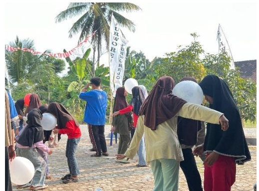
Mengadakan Acara Lomba 17 Agustusan