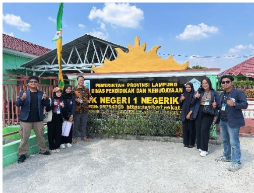
Kunjungan ke SMKN 1 Negeri Katon