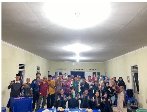
Acara Perpisahan Bersama Masyarakat dan Aparat Desa