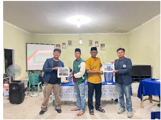
Penyerahan cinderamata kepada Sekertaris Desa dan BUMDes