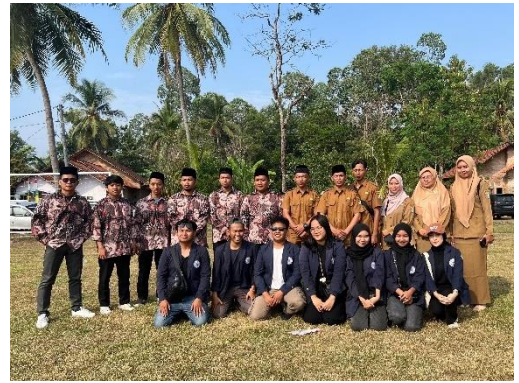
Mengikuti Upacara Hari Kemerdekaan Indonesia