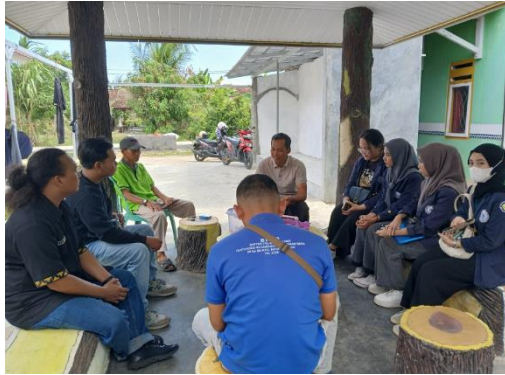
Survey Lokasi Desa Purworejo