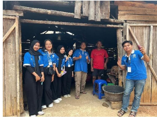
Kunjungan ke UMKM keripik Ubi Ungu Mas