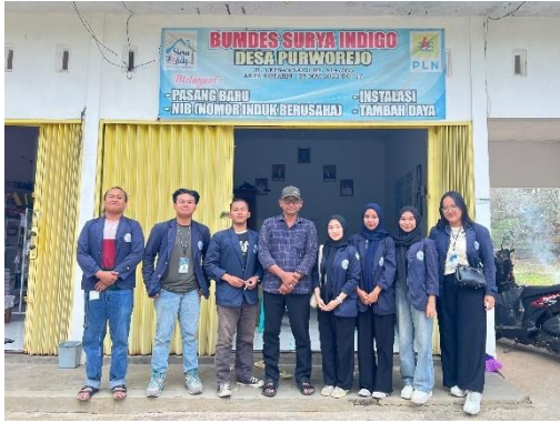
Kunjungan ke BUMDes Surya Indigo