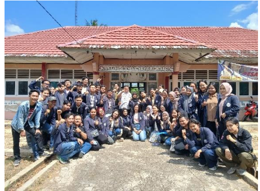
Penyambutan Mahasiswa di kecamatan Negeri Katon