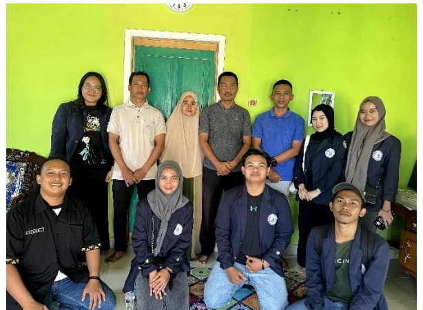
Penyambutan Mahasiswa di Posko