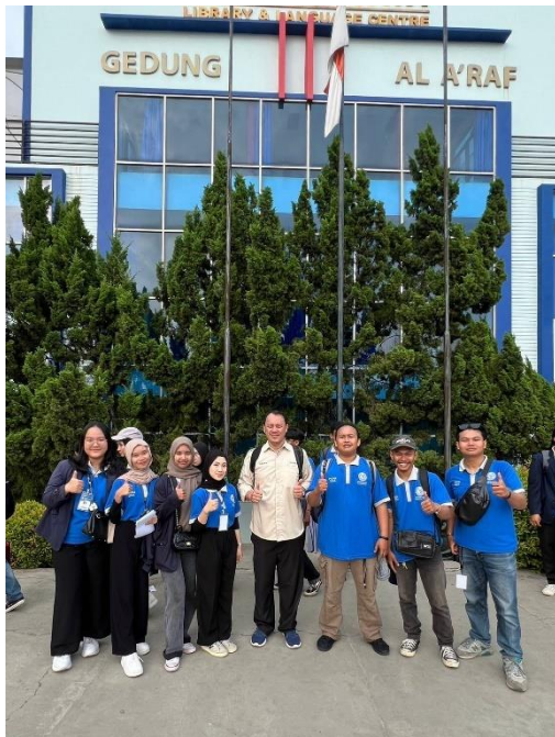
Pelepasan Mahasiswa PKPM