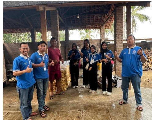
Kunjungan ke UMKM keripik Mustar