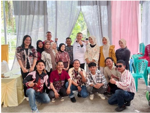
Mengikuti acara khitanan di rumah Mantan Lurah Bersama bapak Bupati