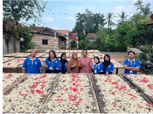
Kunjungan ke UMKM klatring Azzahra