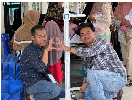
Mengikuti acara Posyandu Balita