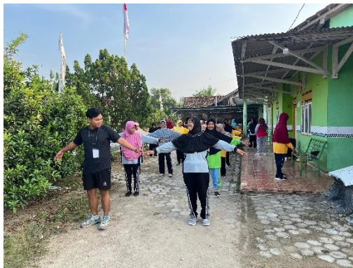
Senam Bersama Lansia