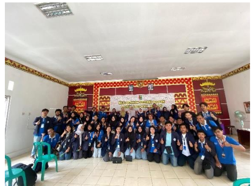
Acara Perpisahan Bersama Kecamatan Negeri Katon