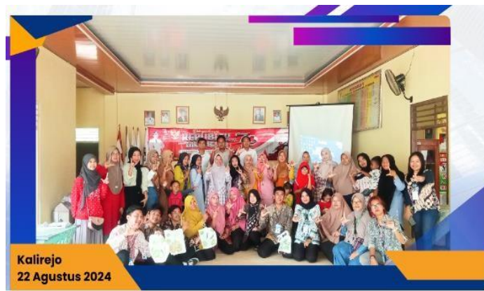
Gambar 2 11 Sosialisasi Ecoprint & Branding

Sosialisasi ini bertujuan untuk meningkatkan pengetahuan dan keterampilan pelaku UMKM dalam pemanfaatan teknologi digital. Dan diharapkan untuk menambah UMKM didesa kaliarejo, terkhususnya dusun mekarjaya. Berikut Sosialisasi Ecoprint & Branding yang dapat dilihat.