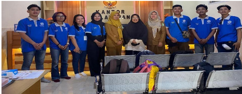
Gambar 2 2 Pelepasan Aparatur Desa