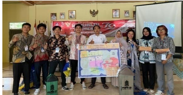
Gambar 2 12 Penyerahan Cendramata

PKPM IIB Darmajaya kepada desa kalirejo. Berikut Penyerahan Cendramata yang dapat dilihat.