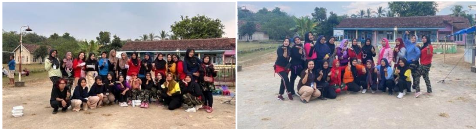
Gambar 2 13 Senam Bersama Ibu Ibu

Kegiatan rutin yang dilakukan oleh ibu-ibu desa kalirejo yang dilaksanakan setiap hari rabu dan sabtu. Berikut kegiatan senam rutin bersama Ibu-Ibu desa Kalirejo yang dapat dilihat.