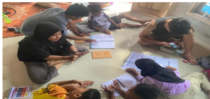
Gambar 2 16 Bimbel

Bimbel diberikan kepada anak-anak sekolah dasar yang berada disekitaran posko, guna membantu mereka dalam mengerjakan PR dan memberikan pembelajaran pendukung lainnya. Berikut Pembelajaran kepada anak-anak melalui Bimbel rutin yang dapat dilihat.