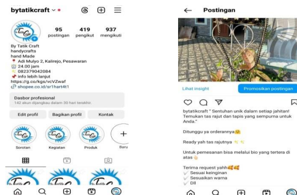
Gambar 2 5 Pembuatan Instagram Bisnis

Penggunaan Instagram Bisnis, terutama dalam konteks membenaran bio dan caption, menawarkan banyak manfaat untuk UMKM. salah satunya Bio Instagram adalah tempat pertama yang dilihat oleh pengunjung profil. Dengan bio yang jelas dan informatif, Anda dapat secara langsung mengkomunikasikan apa yang bisnis Anda lakukan, nilai-nilai inti, dan apa yang membedakan Anda dari pesaing, Dan Caption yang menarik dan relevan dapat mendorong pengikut untuk berinteraksi dengan postingan Anda melalui like, komentar, dan berbagi. Keterlibatan yang tinggi dapat meningkatkan visibilitas konten Anda di algoritma Instagram. Dengan memanfaatkan bio dan caption secara efektif di Instagram Bisnis, UMKM dapat meningkatkan visibilitas, keterlibatan, dan konversi, serta membangun merek yang kuat dan berkesan di platform sosial media tersebut. Berikut Pembuatan Instragram Bisnis & dan Caption yang dapat dilihat.