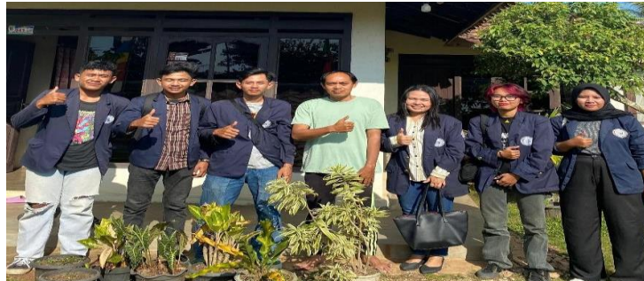
Gambar 2 1 Survey Lokasi

Mencari tempat untuk kegiatan PKPM di daerah Kalirejo, Pesawaran yang sesuai dengan UMKM yang diarahkan kampus dengan tema yakni “Peningkatan Ekonomi Desa Menuju Masyarakat Yang Unggul dan Tangguh Berbasis Digital. Berikut Survey Lokasi yang dapat dilihat.