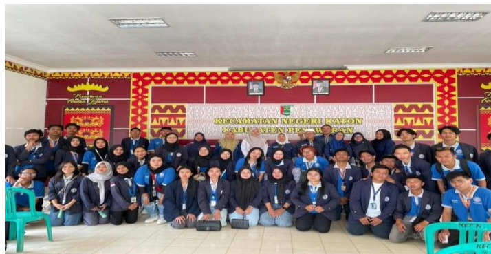
Gambar 2 3 Pelepasan PKPM

Salah satu hal yang harus dilaksanakan ketika sudah menyelesaikan kegiatan PKPM dan berpamitan kepada perangkat desa serta pihak UMKM dan berterimakasih telah diizinkan melaksanakan kegiatan di daerah tersebut. Berikut Pelepasan PKPM yang dapat dilihat.