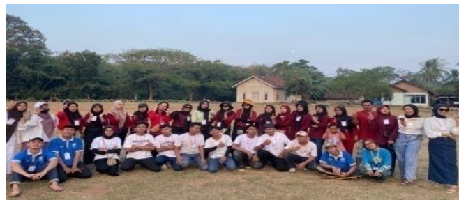
Gambar 2 15 Panitia 17 Agustus

Berpartisipasi dalam kegiatan yang diselenggarakan oleh desa kalirejo dan dusun mekarjaya dalam memeriahkan HUT RI Ke-79 dengan berbagai macam perlombaan. Berikut kegiatan Panitia 17 Agustus di desa Kalirejo yang dapat dilihat.