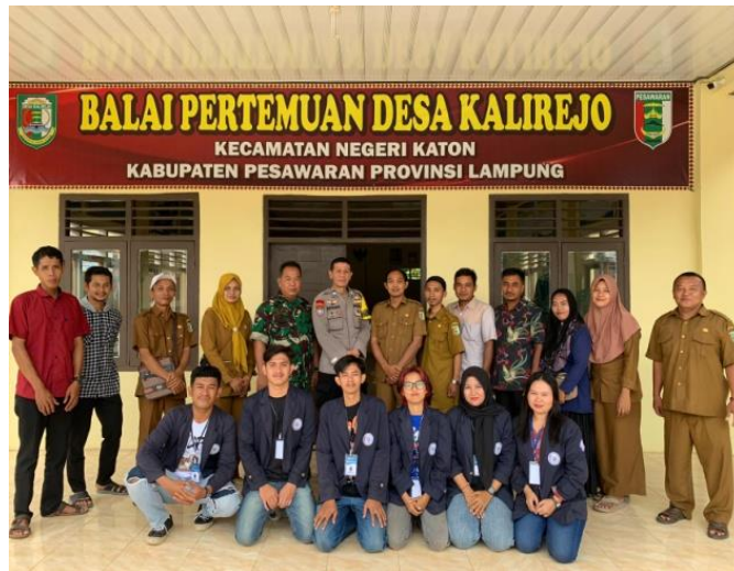
Gambar 2 8 Silaturahmi Bersama Aperatur Desa