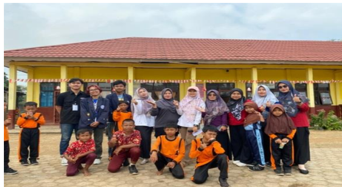
Gambar 2 9 Observasi ke SD

Observasi dilakukan untuk memperkenalkan mahasiswa PKPM Darmajaya kepada murid-murid dan guru-guru di SD 8 Negeri Katon agar tali silaturahmi semakin luas di desa Kali Rejo. Berikut Observasi ke Sekolah SD 8 Negeri Katon yang dapat dilihat.