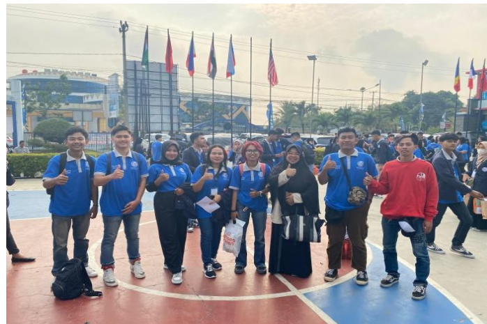
Gambar 2 7 Pelepasan Peserta PKPM

Pelepasan ini adalah awal kegiatan PKPM yang didampingi langsung oleh Dosen pembimbing Lapangan dan mengantarkan Mahasiswa ke posko PKPM di desa Kali Rejo Kecamatan Negeri Katon Kabupaten Pesawaran. Berikut pelepasan peserta PKPM yang dapat dilihat.