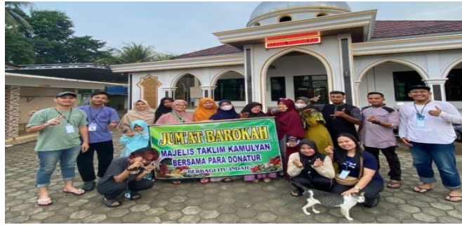
Gambar 2 14 Jumat Berkah