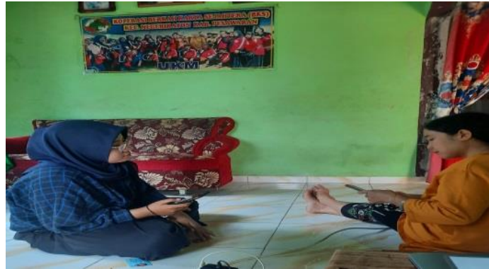
Gambar 2 10 Observasi UMKM

mengenai potensi UMKM By Tatik Craft dan mengetahui bagaimana proses pembuatan By Tatik Craft yang nanti akan dipasarkan. Berikut Observasi UMKM By Tatik Craft yang dapat dilihat.