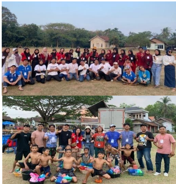
Gambar 16 panitia lomba 17 agustus

Berpartisipasi dalam kegiatan yang diselenggarakan oleh desa kalirejo dan dusun mekarjaya dalam memeriahkan HUT RI Ke-79 dengan berbagai macam perlombaan.