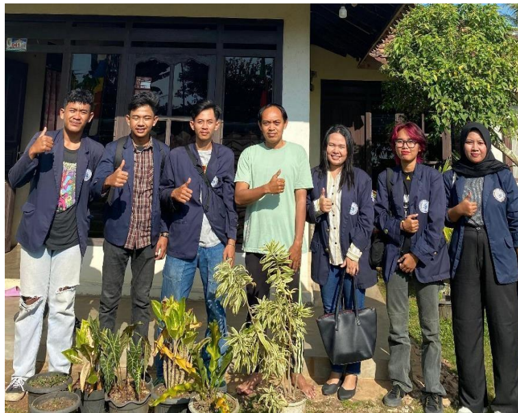
Gambar 2 Survei Lokasi PKPM

Mencari tempat untuk kegiatan PKPM di daerah Kali Rejo, Pesawaran yang sesuai dengan UMKM yang diarahkan kampus dengan tema yakni “Peningkatan Ekonomi Desa Menuju Masyarakat Yang Unggul dan Tangguh Berbasis Digital”