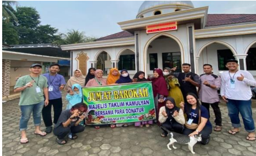
Gambar 15 kegiatan rutin jumat berkah

Kegiatan rutin yang dilakukan oleh ibu-ibu desa kalirejo yang dilaksanakan setiap hari jumat yaitu berbagi sayuran gratis kepada seluruh warga