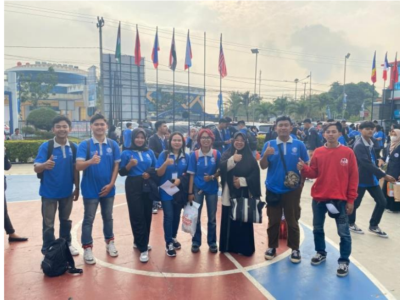
Gambar 5 Pelepasan peserta PKPM