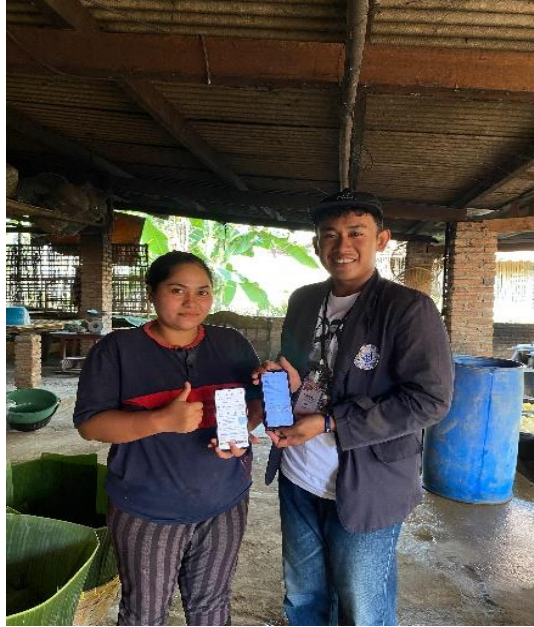
Gambar 13 penyerahan akun instagram dan google business