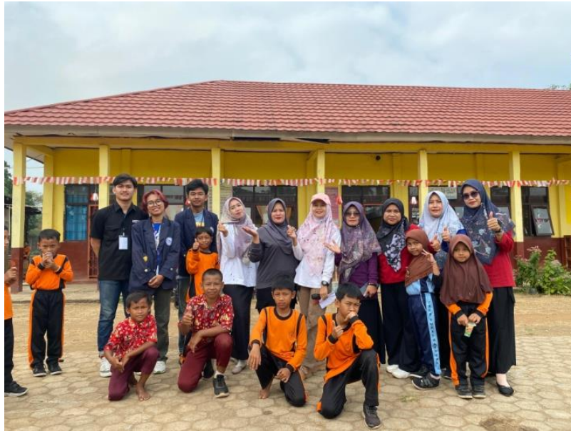
Gambar 7 Observasi ke sekolah dasar

Observasi dilakukan untuk memperkenalkan mahasiswa PKPM Darmajaya kepada murid-murid dan guru-guru di SD Negeri Katon agar tali silaturahmi semakin luas di desa Kali Rejo.