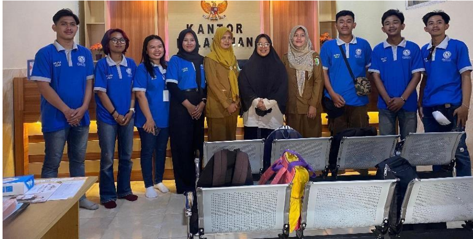
Gambar 3 Permohonan Izin ke Balai Desa kalirejo

Permohonan surat izin yang disampaikan kepada Aparatur Desa Kali Rejo yang bertujuan untuk melaksanakan kegiatan PKPM yang dimulai dari tanggal 30 Juli 2024 – 29 Agustus 2024