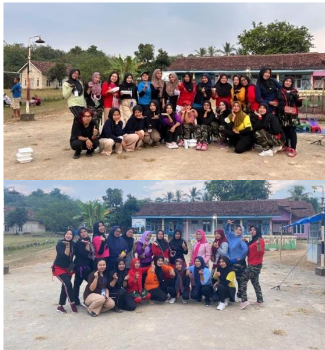
Gambar 14 senam rutin ibu ibu

Kegiatan rutin yang dilakukan oleh ibu-ibu desa kalirejo yang dilaksanakan setiap hari rabu dan sabtu