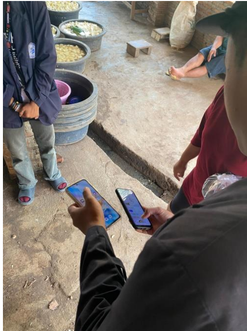
Gambar 8 Observasi UMKM GG Tape Singkong