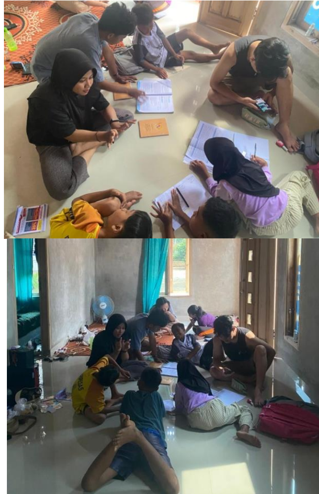
Gambar 17 bimbel di posko

Bimbel diberikan kepada anak-anak sekolah dasar yang berada disekitaran posko, guna membantu mereka dalam mengerjakan PR dan memberikan pembelajaran pendukung lainnya