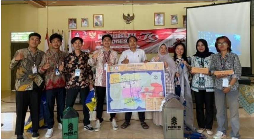
Gambar 12 Penyerahan cinderamata ke balai desa kalirejo

Penyerahan cendera mata yang dimaksud untuk menjadi kenang-kenangan PKPM IIB Darmajaya kepada desa kalirejo, dan berikut hasil dokumentasi bersama Sekretaris Desa Kalirejo