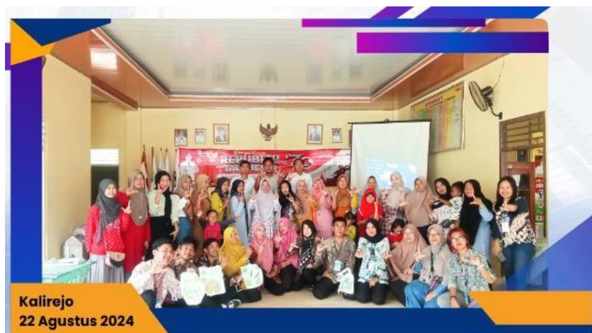
Gambar 11 Sosialisasi Ecoprint dan Branding

Sosialisasi ini bertujuan untuk meningkatkan pengetahuan dan keterampilan pelaku UMKM dalam pemanfaatan teknologi digital. Untuk mengenalkan Branding dan penggunaan Canva Dan diharapkan untuk menambah UMKM didesa kalirejo, terkhususnya dusun mekarjaya.