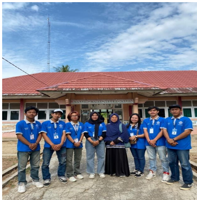
Gambar 4 penjemputan mahasiswa PKPM

Salah satu hal yang harus dilaksanakan ketika sudah menyelesaikan kegiatan PKPM dan berpamitan kepada perangkat desa serta pihak UMKM dan berterimakasih telah diizinkan melaksanakan kegiatan di daerah tersebut.