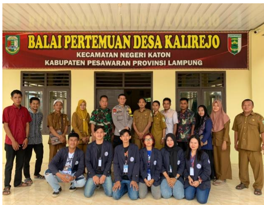
Gambar 6 Silaturahmi ke balai Desa kalirejo

Tujuan Silaturahmi ini adalah untuk memperkenalkan masing-masing mahasiswa PKPM Darmajaya kepada Aparatur desa dan mendapatkan beberapa informasi mengenai potensi desa yang bertujuan untuk meningkatkan kesejahteraan, kesehatan, dan perkembangan UMKM di Desa Kalirejo.