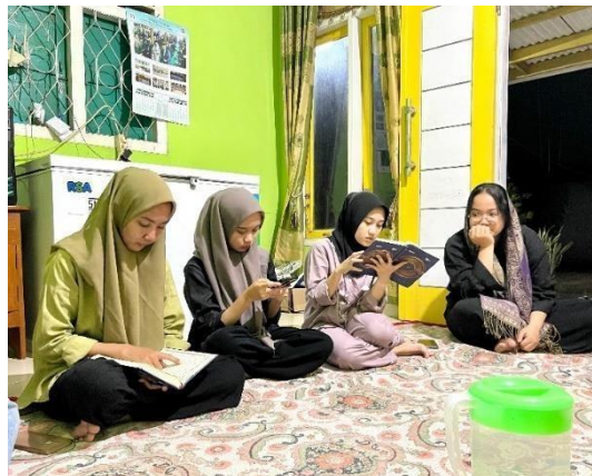
Gambar 2.16 pengajina mingguan

Bertujuan untuk meningkatkan pemahaman keagamaan, mempererat tali silaturahmi antarwarga di Desa Purwprejo dan membentuk masyarakat yang lebih berakhlak serta berwawasan luas dalam ajaran agama Islam, Yang terdapat pada gambar 2.16