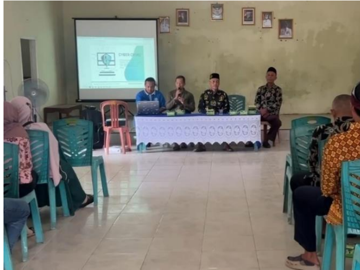
Gambar 2.4 Sosialisasi Cryber Crime di Era Teknologi 4.0

Salah satu kegiatan yang dilakukan pada saat PKPM yaitu mengadakan lokakarya untuk mempresentasikan program kerja yang akan dijalankan selama PKPM di Desa Purworejo yang terdapat pada gambar 2.4