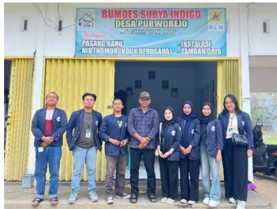
Gambar 2.12 kunjungan ke kantor Bumdes Surya Idigo

Dilakukan bertujuan untuk silaturahmi sekaligus mengetahui informasi terkait UMKM dan informasi untuk pembuatan Ekatalog BUMDes Surya Indigo yang ada di Desa Purworejo, Negeri Katon, Pesawaran, yang terdapat pada gambar 2.12