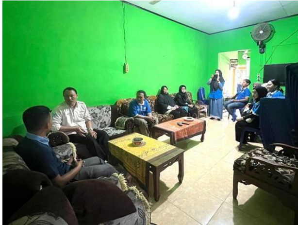
Gambar 2.9 Penyerahan peserta PKPM pada aparat desa

Pelepasan ini adalah awal kegiatan PKPM yang di dampingi langsung oleh Dosen Pembimbing Lapangan dan mengantarkan Mahasiswa ke posko PKPM di Desa Purworejo, Negeri Katon, Pesawaran, yang terdapat pada gambar 2.9