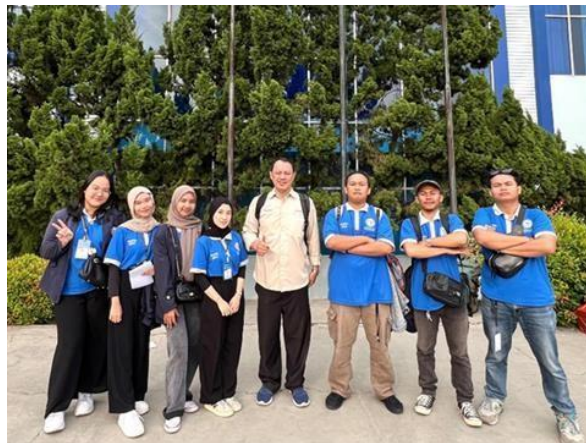
Gambar 2.3 Pelepasan Mahasiswa PKPM dari Kampus

Salah satu hal yang harus dilakukan yaitu kampus mengadakan pelepasan mahasiswa PKPM yang akan diberangkatkan ke desa untuk melaksanakan kegiatan di daerah tersebut, yang terdapat pada gambar 2.3