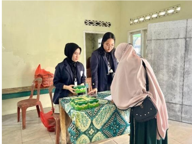
Gambar 2.13 lokakarya di Lokakarya di Balai

Dilakukan bertujuan untuk memaparkan program kerja yang akan dilaksanakan selama PKPM di Desa Purworejo, Negeri Katon, Pesawaran, yang terdapat pada gambar 2.13