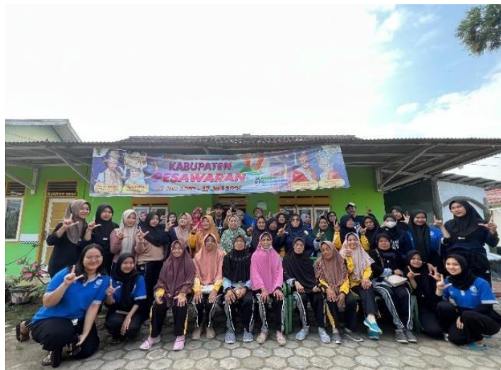
Gambar 2.14 Lansia Desa Purworejo

Bertujuan untuk menjaga kesehatan fisik dan mental para lanjut usia, meningkatkan kebugaran, mencegah penyakit terkait usia, serta memperkuat ikatan sosial antar peserta, yang terdapat pada gambar 2.14