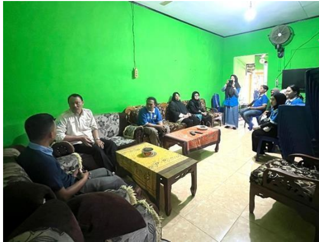
Gambar 2.2 Permohonan izin ke aparat desa purworejo

Permohonan izin yang disampaikan kepada perangkat kelurahan Purworejo, yang bertujuan untuk melaksanakan kegiatan PKPM yang dimulai dari tanggal 30 Juli - 29 Agustus 2024. Yang terdapat pada gambar 2.2