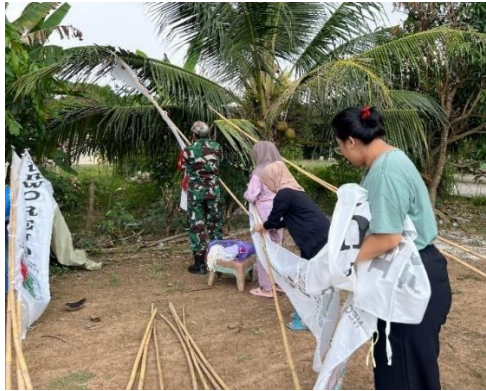
Gambar 2.11 pemasangan umbul umbul desa purworejo

Salah satu tujuan dari gotong royong adalah menumbuhkan sikap saling membantu antar masyarakat. Dimana orang-orang mau membantu dan menolong orang lain yang membutuhkan. Menyelesaikan suatu tantangan secara bersama, dapat mempererat tali persaudaraan, meningkatkan rasa solidaritas, yang terdapat pada gambar 2.11