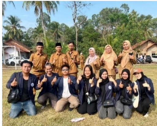
Gambar 2.15 upacara HUT RI 79

Upacara HUT-RI untuk memperingati hari sacral kemerdekaan bangsa Indonesia. Upacara peringatan kemerdekaan bangsa Indonesia dan pengibaran sang merah putih serta lomba di tingkat Desa. Upacara bendera dapat meningkatkan sikap kebersamaan dan persatuan di institut maupun di Desa. Karena mengingat perjuangan para pahlawan yang telah gugur, terdapat pada gambar 2.15