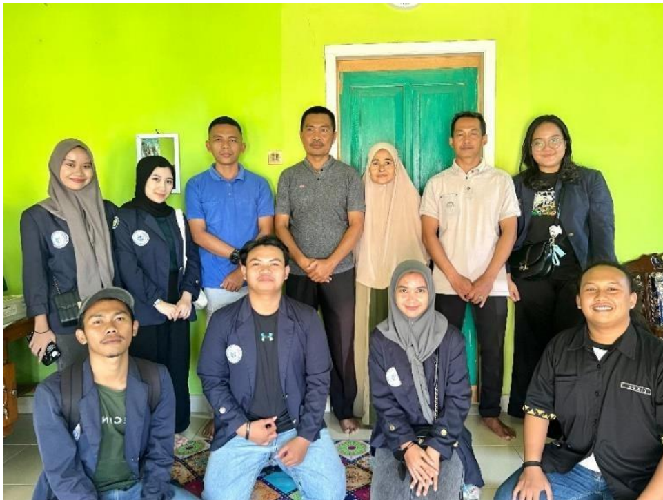
Gambar 2.1 Surve Lokasi Kegiatan PKPM

Mencari tempat untuk kegiatan PKPM di daerah Purworejo, Negeri Katon, Pesawaran yang sesuai dengan UMKM yang diarahkan kampus dengan tema yakni “Peningkatan Ekonomi Desa Menuju Masyarakat yang Unggul dan Tangguh Berbasis Digital”. Yang terdapat di gambar 2.1