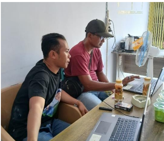
Gambar 2.5 Pengumpulan data Bumdes