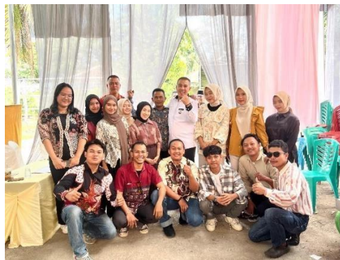
Gambar 2.10 Foto bersama bupati Pesawaran di acara kepala desa

Berpartisipasi dalam acara khitanan di kediaman Kepala Desa Purworejo bersama Bapak Bupati Pesawaran Dr. H. Demdi Ramadhona.K.ST.M.Tr.IP, yang terdapat pada gambar 2.10