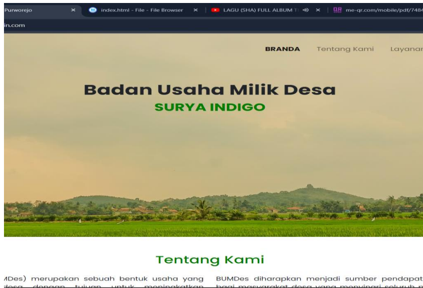
Gambar 2.7 Website BUMDes