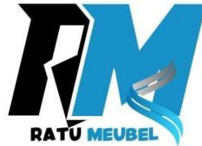
Gambar 2.5 Logo UMKM

Memiliki logo yang dirancang dengan baik yang bertujuan untuk memberikan kesan profesionalisme dan dedikasi terhadap bisnis. Ini dapat meningkatkan kepercayaan pelanggan dan kenyamanan dalam bertransaksi, yang sangat penting bagi UMKM yang berusaha membangun reputasi di pasar. Berikut logo dari UMKM Ponco Ratu Meubel