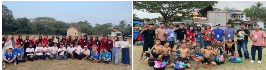
Gambar 2.19 Kepanitiaian Kemerdekaan RI

Berpartisipasi dalam kegiatan yang diselenggarakan oleh desa kalirejo dan dusun mekarjaya dalam memeriahkan HUT RI Ke-79 dengan berbagai macam perlombaan. Berikut terlampir dari kepanitiaian kemerdekaan RI