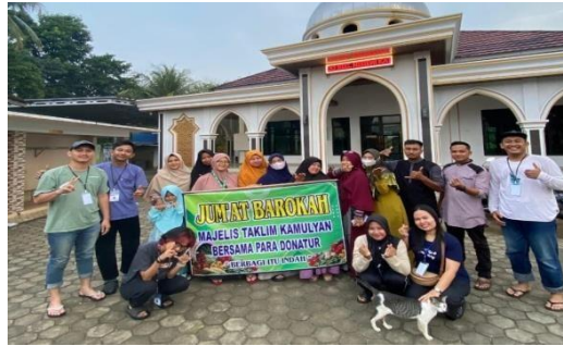
Gambar 2.18 Jumat Berkah