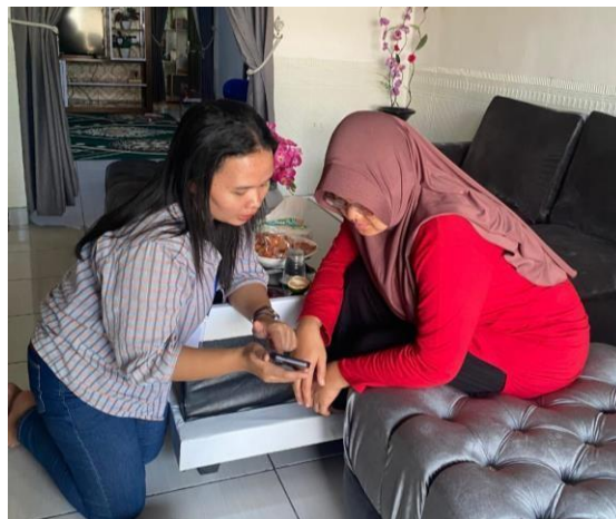
Gambar 2.6 Pendaftaran Google Maps

Mendaftarkan google maps Pendaftaran di Google Maps memungkinkan UMKM untuk memberikan informasi penting kepada pelanggan, seperti alamat, nomor telepon, jam buka, dan deskripsi usaha. Ini membantu konsumen untuk mendapatkan informasi yang mereka butuhkan dengan cepat dan efisien dan juga dapat meningkatkan penjualan. Berikut ini pendaftaran google maps yang dapat dilihat.