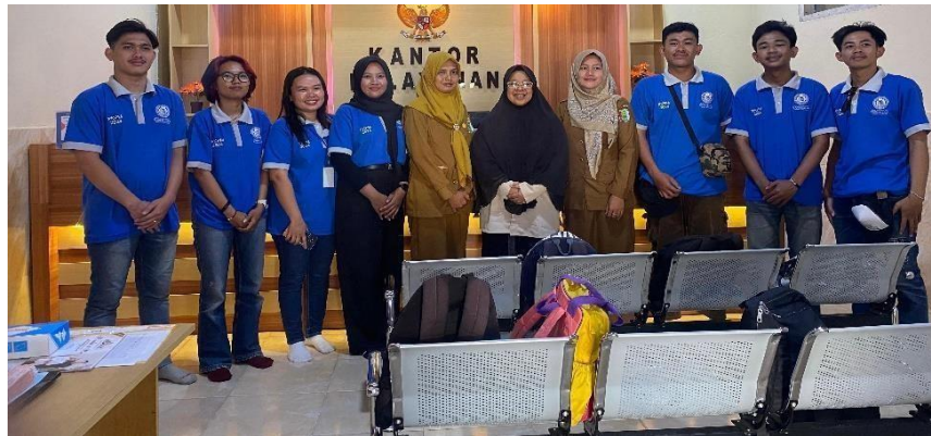
Gambar 2.3 Foto permohonan Izin