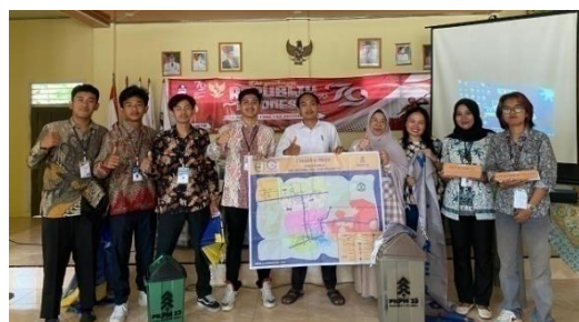
Gambar 2.15 Penyerahan Cenderamata

Penyerahan cendera mata yang dimaksud untuk menjadi kenang-kenangan PKPM IIB Darmajaya kepada desa kalirejo. Berikut terlampir penyerahan cenderamata dari PKPM IIB Darmajaya ke desa Kalirejo