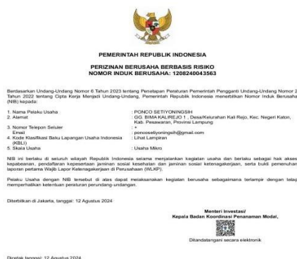
Gambar 2.12 NIB Ponco Ratu Meubel

Untuk mendapatkan perlindungan hukum dari hal yang tidak diinginkan serta memiliki daya tarik konsumen untuk meningkatkan nilai produk., berikut terlampir dari NIB UMKM Ponco Ratu Meubel