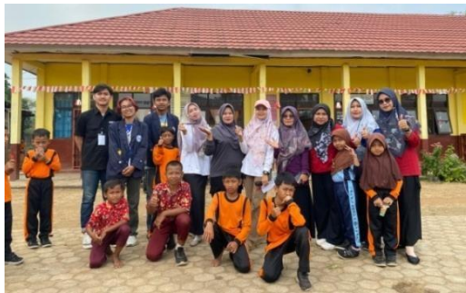
Gambar 2.9 Observasi ke SDN 08 Negeri Katon

Observasi dilakukan untuk memperkenalkan mahasiswa PKPM Darmajaya kepada murid-murid dan guru-guru di SD Negeri Katon agar tali silaturahmi semakin luas di desa Kali Rejo. Berikut observasi ke SDN 08 Negeri Katon.