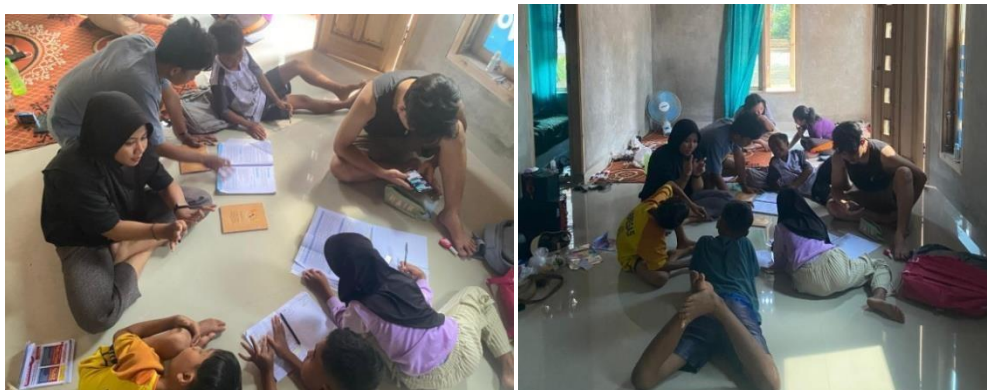
Gambar 2.20 Bimbel rutin

Bimbel diberikan kepada anak-anak sekolah dasar yang berada disekitaran posko, guna membantu mereka dalam mengerjakan PR dan memberikan pembelajaran pendukung lainnya. Berikut terlampir dari gambar bimbel rutin di posko PKPM