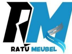
Gambar 2.13 Logo Ponco Ratu Meubel