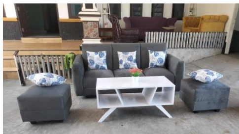
Gambar 2.10 Observasi UMKM Ponco Ratu Meubel

Tujuan kunjungan ini dilakukan adalah untuk mendapatkan beberapa informasi mengenai potensi UMKM Ponco Ratu Meubel dan mengetahui bagaimana proses pembuatan Meubel yang nanti akan dipasarkan. Berikut observasi UMKM Ponco Ratu Meubel yang dapat dilihat.