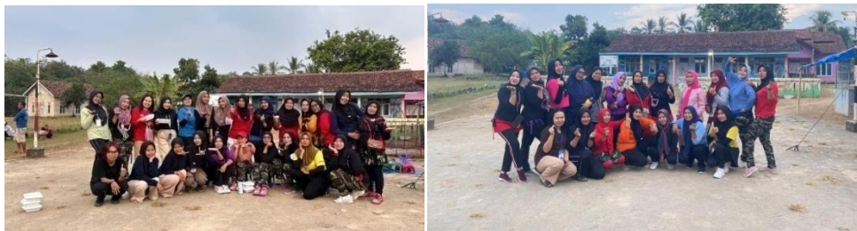
Gambar 2.17 Senam bersama

Kegiatan rutin yang dilakukan oleh ibu-ibu desa kalirejo yang dilaksanakan setiap hari rabu dan sabtu. Berikut terlampir dari senam bersama ibu-ibu desa kalirejo