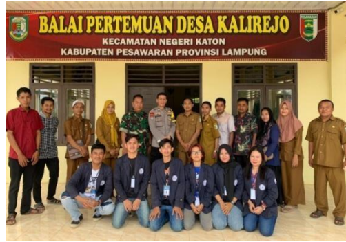
Gambar 2.8 Silaturahmi Aparatur desa