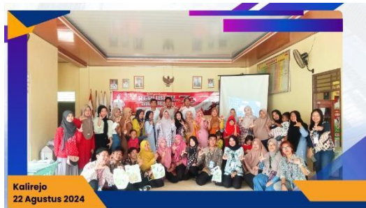
Gambar 2.14 Sosialisasi Ecoprint dan Branding

Sosialisasi ini bertujuan untuk meningkatkan pengetahuan dan keterampilan pelaku UMKM dalam pemanfaatan teknologi digital. Dan diharapkan untuk menambah UMKM didesa kaliarejo, terkhususnya dusun mekarjaya. Berikut terlampir sosialisasi ecoprint dan branding