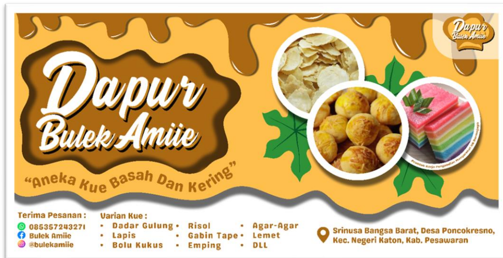
Gambar 2.3.2 Hasil Output Program Re-desain Logo