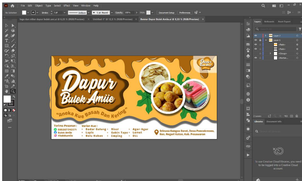
Gambar 2.4.1 Proses Pembuatan Program Kerja