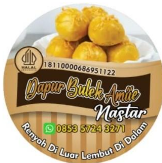
Gambar 2.3.1 Hasil Program Re-desain Logo