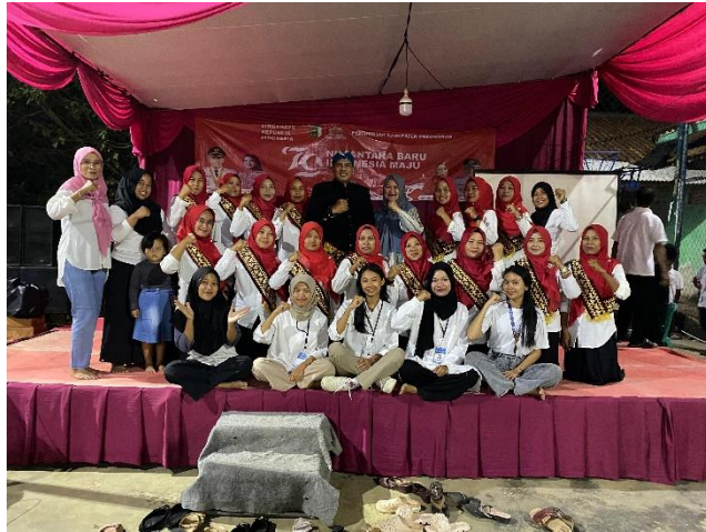
Gambar 2.7 Melaksanakan Kegiatan Malam Puncak HUT R1 Ke-79