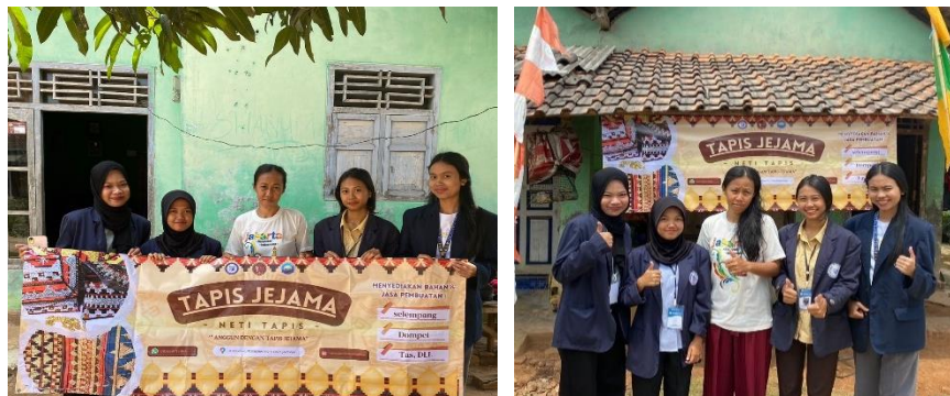
Gambar 5.8 Penyerahan Banner

PKPM Darmajaya melakukan pemberian banner kepada UMKM Tapis Jejama