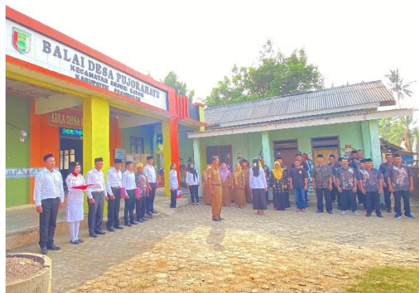
Gambar 2.6 Melaksanakan Upacara Bendera HUT R1 Ke-79

Penulis dan tim diminta oleh masyarakat Desa Sukanegara untuk menjadi petugas upacara 17 Agustus. Penulis menjadi anggota perlengkapan upacara 17 Agustus.