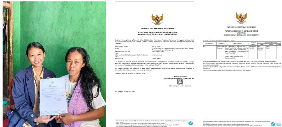
Gambar 2.4 Melakukan Pembuatan NIB