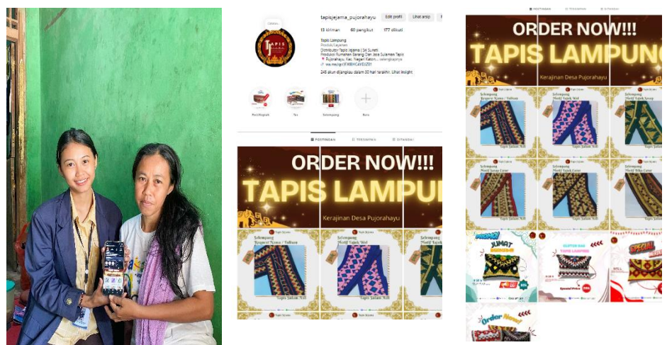
Gambar 2.3 Melakukan Pendaftaran Akun Dan Pembuatan Konten Marketing Instagram

Berikut adalah gambar pembuatan akun Instagram Tapis Jejama dan Kontent Marketing :