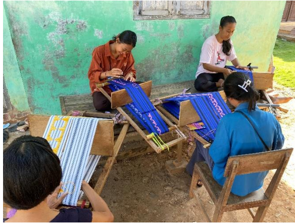
Gambar 2.1 Kegiatan Produksi penyulaman benang untuk membuat motif kain tapis wol