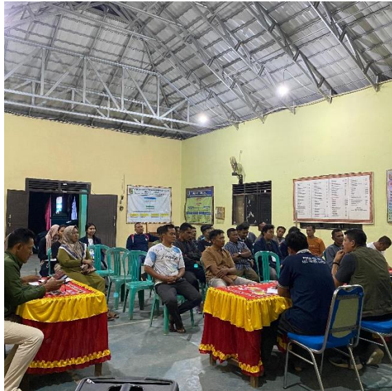
Gambar 2.5 Melaksanakan Rapat HUT R1 Ke-79