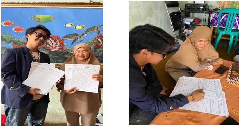
Gambar 2.3. Membuat Kartu Stok Gudang

Kartu stok gudang sangat penting bagi UMKM yang bergerak di bidang produksi kue karena berfungsi sebagai alat untuk mengelola dan mengontrol persediaan bahan baku serta produk jadi. Alasan mengapa kartu stok gudang penting untuk UMKM kue.