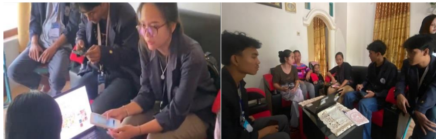
Gambar 2. 1 Pemaparan Materi Tentang Media Sosial

Dalam pelatihan yang kami berikan kepada UMKM Opak Mama Cheri di Desa Wiyono, salah satu materi dasar yang Kami sampaikan adalah Gambaran Umum Tentang Media Sosial. Materi ini bertujuan untuk memberikan pemahaman yang komprehensif tentang peran dan pentingnya media sosial dalam mendukung pertumbuhan bisnis, khususnya bagi Usaha Mikro Kecil dan Menengah seperti Opak Mama Cheri. Media sosial adalah platform online yang memungkinkan pengguna untuk membuat, berbagi, dan berinteraksi dengan konten yang dibuat oleh pengguna lain. Platform ini mencakup berbagai