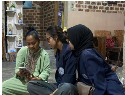
Gambar 2. 3 Pelatihan Cara Menggunakan Media Sosial Melalui Aplikasi Instagram dan Tiktok Kepada UMKM Opak Mama Cheri

Pelatihan penggunaan media sosial melalui aplikasi Instagram dan TikTok kepada UMKM Opak Mama Cheri di Desa Wiyono telah Kami laksanakan dengan baik. Pelatihan ini bertujuan untuk memberdayakan pelaku UMKM dalam memanfaatkan media sosial sebagai alat pemasaran yang efektif. Berikut adalah hasil-hasil yang dicapai dari kegiatan ini: