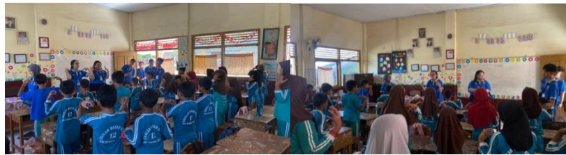
Gambar 2. 7 Kunjungan ke SDN 12 Gedong Tataan

Berkunjung ke SDN 12 Gedong Tataan memberikan motivasi belajar dan bermain game.