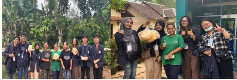
Gambar 2. 12 Kunjungan ke UMKM Produksi Opak