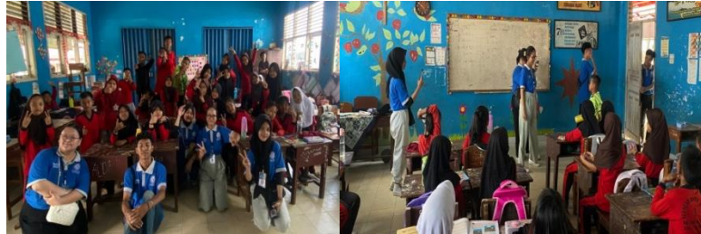
Gambar 2. 6 Kunjungan ke SDN 01 Gedong Tataan

Berkunjung ke SDN 01 Gedong Tataan memberikan motivasi belajar dan bermain game.