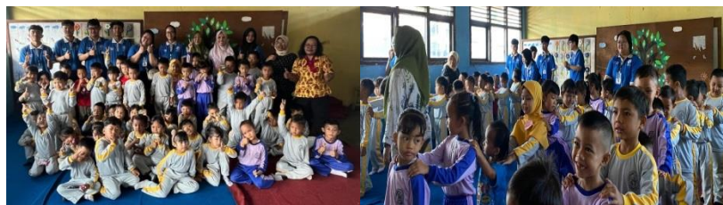
Gambar 2. 8 Kunjungan ke TK Dharma Wanita Wiyono

Berkunjung ke TK Dharma Wanita belajar berhitung sambil bermain game