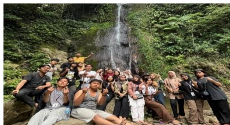
Gambar 2. 14 Kunjungan ke Wisata Air Terjun Gunung Betung

Kunjungan ke Wisata Air Terjun Gunung Betung bersama warga lokal dan rekan PKPM dari kelompok 24, 27, 28, dan 40.