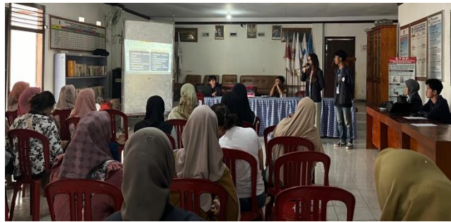
Gambar 2. 4 Seminar Digitalisasi UMKM

Target peserta dalam kegiatan ini yaitu Pelaku UMKM di Desa Wiyono dengan tujuan agar para pelaku UMKM di Desa Wiyono bisa lebih berkembang. Adapun materi yang disampaikan dalam seminar tersebut yaitu deskripsi UMKM, Branding, E-Commerce , Media Sosial serta Konten Marketing.