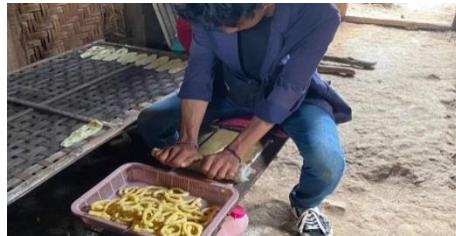
Gambar 2. 10 Kunjungan ke UMKM Produksi Klanting

Berkunjung ke UMKM Produksi Kelanting dan membantu proses pembuatan kelanting di Dusun Candi Harjo.