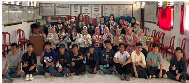
Gambar 2. 5 Pelatihan Ide Bisnis Bucket Snack

Target peserta dalam kegiatan ini yaitu Ibu PKK di Desa Wiyono dengan tujuan memberikan peluang Usaha kepada masyarakat Desa Wiyono.