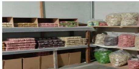
Gambar 2. 11 Kunjungan ke UMKM Produksi Rengginang

Berkunjung ke UMKM Rengginang Cumbuy di Dusun Way Hui.