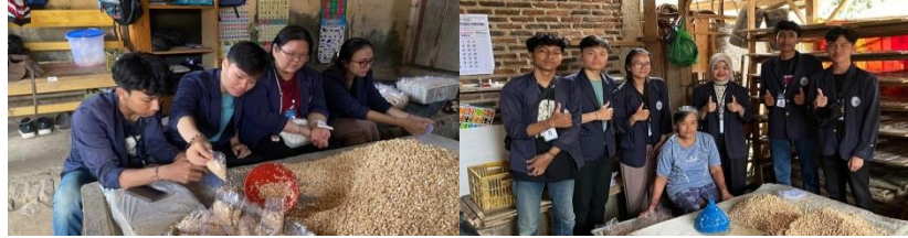
Gambar 2. 9 Kunjungan ke UMKM Produksi Tempe

Berkunjung ke UMKM Produksi Tempe dan membantu proses pembuatan tempe.