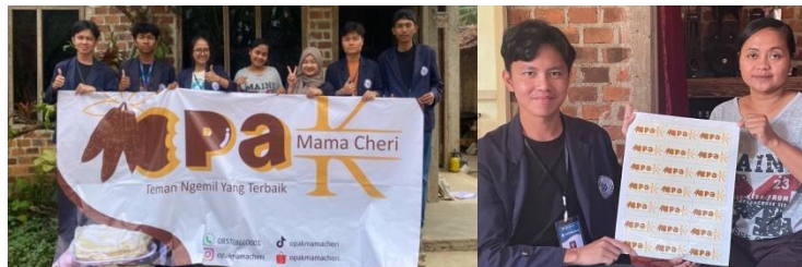
Gambar 2. 13 Penyerahan Stiker Logo dan Banner Kepada UMKM Opak Mama Cheri

Setelah diizinkan untuk membantu mengembangkan usahanya, kami memberikan stiker logo dan banner kepada UMKM Opak Mama Cheri.