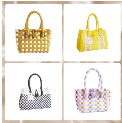
Gambar2.3Kegiatan Foto Produk