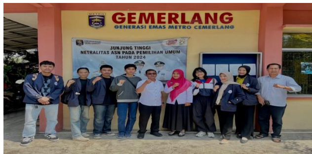
Gambar 2.1 Survei Lokasi Kegiatan PKPM

Mencari tempat untuk kegiatan PKPM di Kelurahan Metro, Lampung yang sesuai dengan UMKM yang diarahkan kampus dengan tema yakni “Peningkatan Ekonomi Desa Menuju Masyarakat yang Unggul dan Tangguh Berbasis Digital”