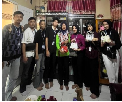
Gambar2.2Pengabdian kepada UMKM Viona Collection