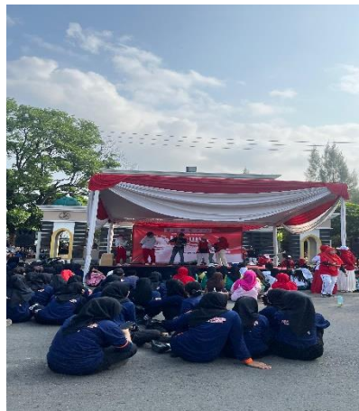
Apel rutin setiap hari senin di Kecamatan Metro Timur.