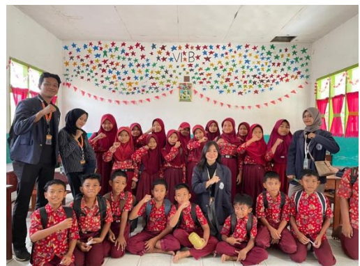
Gambar 2.1 Sosialisasi Gemar Menabung di SDN 17 Negeri Katon