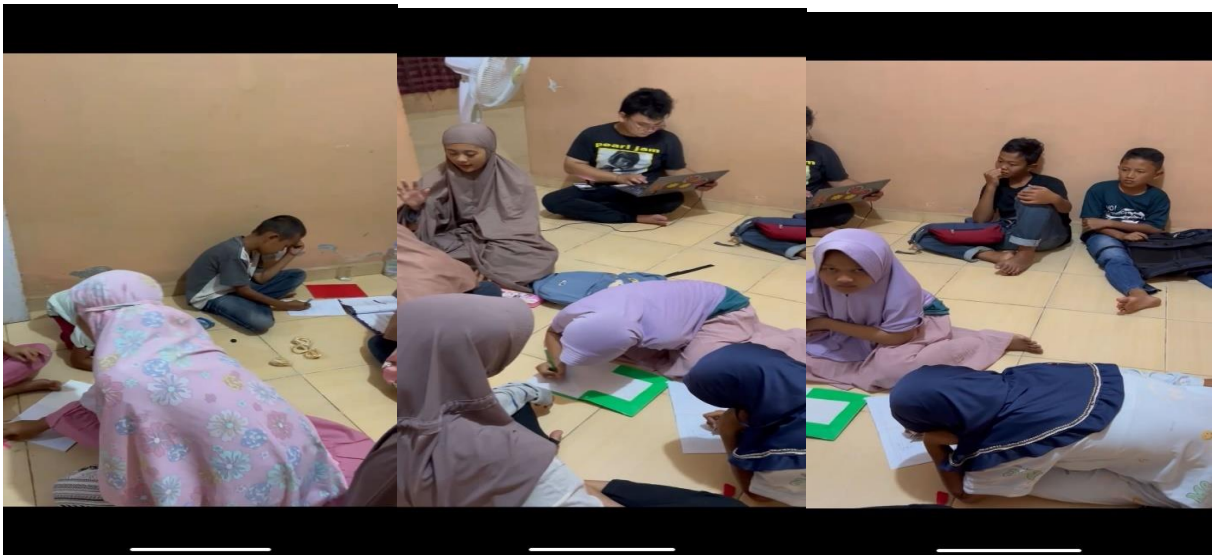
Gambar 2. 3 Rumah Belajar