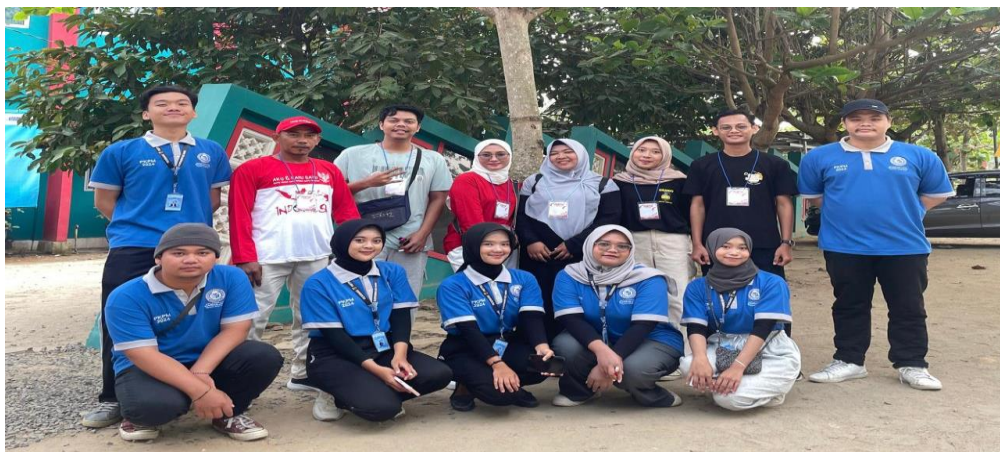
Gambar 2. 4 Kegiatan Jalan Sehat