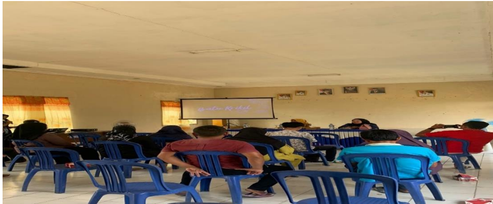
Gambar 2. 2 Sosialisasi Pelatihan Digital Marketing