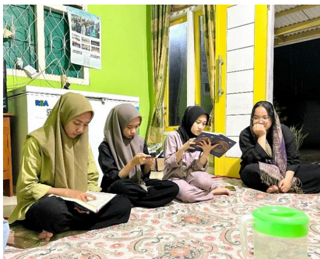
Gambar 2.15 Mengikuti Pengajian Rutin

Pengajian ini diadakan untuk meningkatkan pemahaman keagamaan serta mempererat tali silaturahmi antar warga dan memiliki akhlak yang baik. Dapat dilihat pada gambar 2.15.