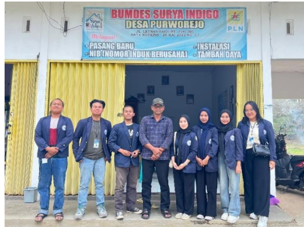
Gambar 2.10 Kunjungan Ke Kantor BUMDes Surya Indigo Desa Purworejo

Dilakukan bertujuan untuk silaturahmi sekaligus mengetahui informasi terkait UMKM dan informasi untuk pembuatan website UMKM Center yang ada di Desa Purworejo, Negeri Katon, Pesawaran. Dapat dilihat pada gambar 2.10.