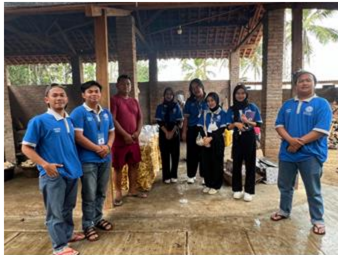
Gambar 2.5 Pengabdian Terhadap UMKM Keripik Pisang Mustar

Salah satu kegiatan yang dilakukan pada saat PKPM yaitu melakukan pengabdian kepada UMKM Keripik Pisang Mustar yakni dengan upaya melakukan kegiatan pembuatan titik lokasi pada Google Maps untuk mempermudah pelanggan. Dapat dilihat pada gambar 2.5.