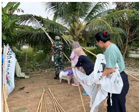
Gambar 2.9 Melakukan Pemasangan Umbul-umbul Bersama Warga Sekitar

Salah satu tujuan dari gotong royong adalah menumbuhkan sikap saling membantu antar masyarakat. Contohnya pemasangan umbul-umbul dengan warga sekitar untuk memperingati 17 agustus dan menjalin silaturahmi antar warga setempat. Dapat dilihat pada gambar 2.9.