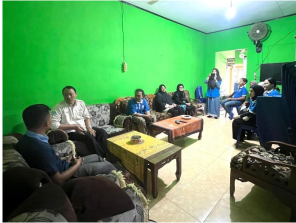
Gambar 2.2 Permohonan Izin