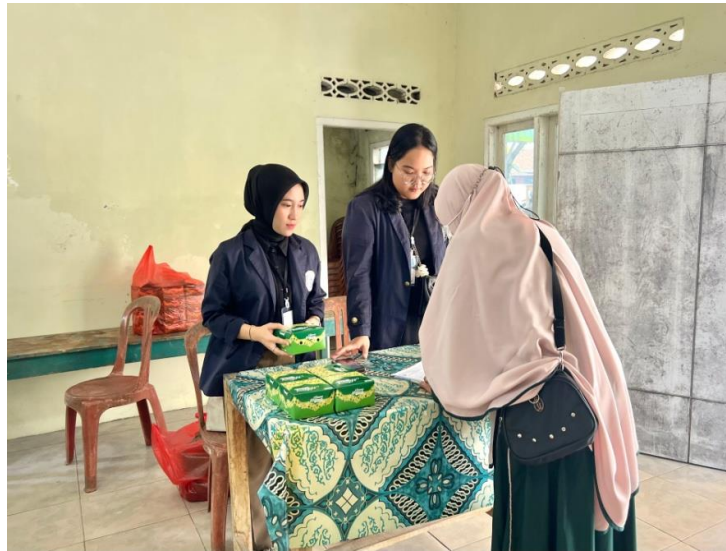
Gambar 2.4 Melakukan Kegiatan Lokakarya