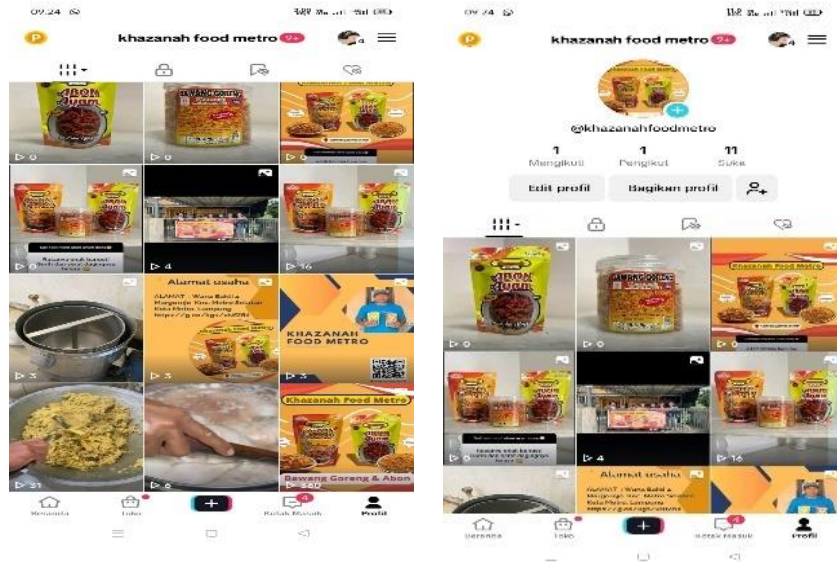
Gambar 2. 6 Akun Tiktok