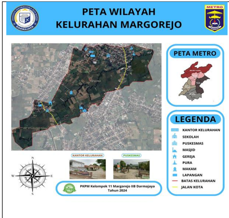
Gambar 2. 11 Peta Kelurahan Margorejo