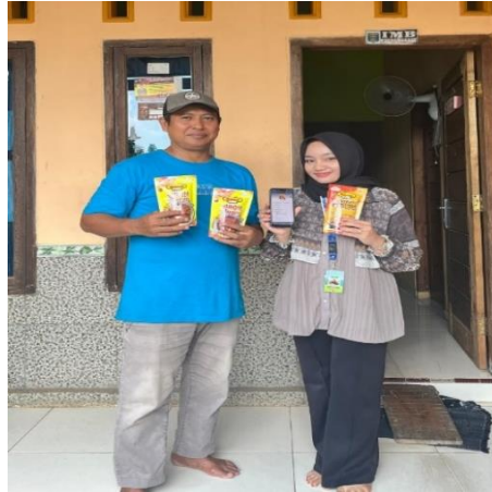
Gambar 2. 10 penyerahan sosial mediia UMKM