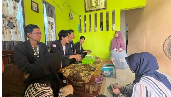
Gambar 2. 8 Kunjungan UMKM