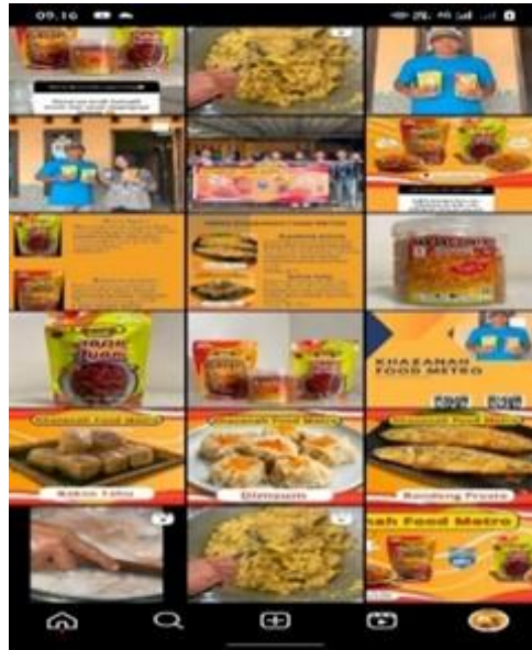
Gambar 2. 5 Akun Tiktok