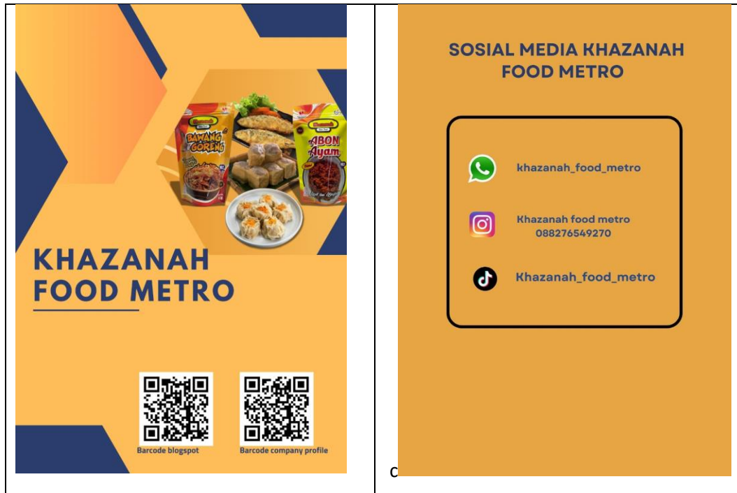
Gambar 2. 4 Company Profile

memasukkan data-data yang tak valid. Sebuah profil perusahaan perusahaan juga akan dinyatakan berhasil apabila berhasil menarik minat serta target pembacanya.