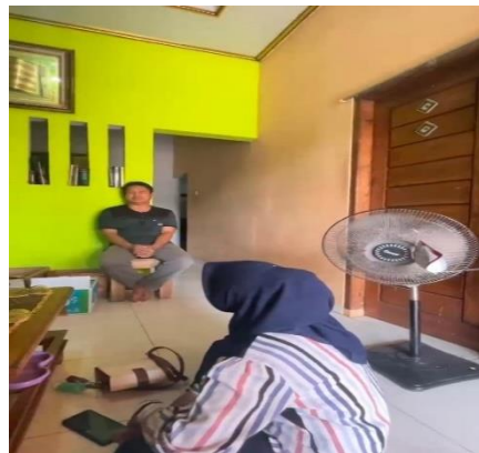
Gambar 2. 2 Survei UMKM Khazanah Food Metro

Sebelum melaksanakan program kerja PKPM di UMKM Khazanah Food Metro kami melakukan kunjungan terlebih dahulu guna mengetahui terkait apa saja kegiatan yang di lakukan dalam sehari-hari di UMKM Khazanah Food Metro dan juga sedikit berbincang dengan pemilik UMKM tersebut mengenai tahapan proses pembuatan produk Khazanah Food Metro