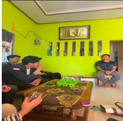
Gambar 2. 3 Meminta Izin Kepada UMKM