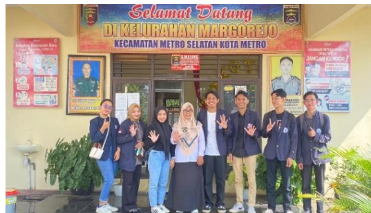
Gambar 2. 1 Koordinasi dengan kepala desa

Sebelum melaksanakan kegiatan survey pada UMKM dan potensi desa perlu untuk koodinasi dengan kepala desa maupun perangkat desa sehingga mendapat arahan yang lebih baik dan semua dapat berjalan dengan lancar pada kegiatan PKPM.