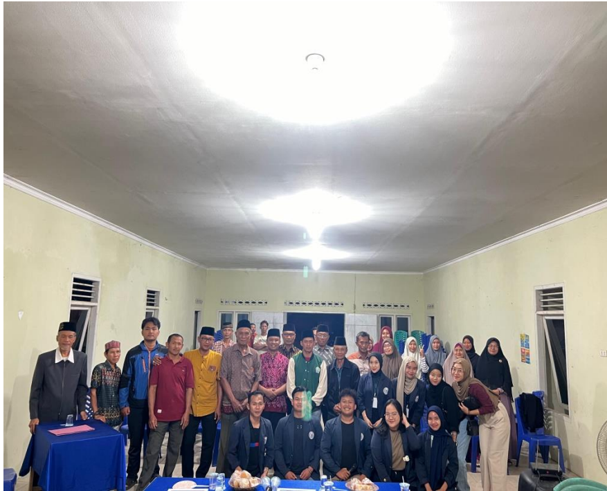
Acara Perpisahan Bersama Masyarakat dan Aparat Desa