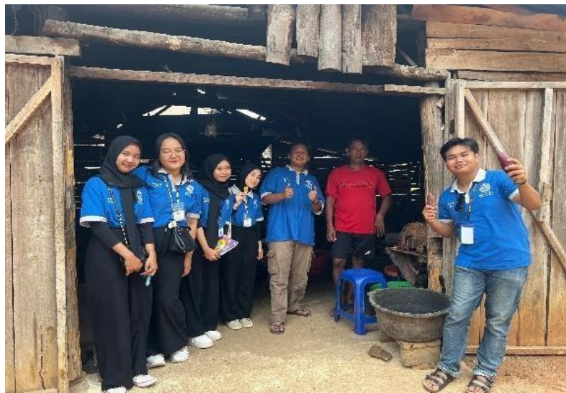
Kunjungan ke UMKM keripik Ubi Ungu Mas