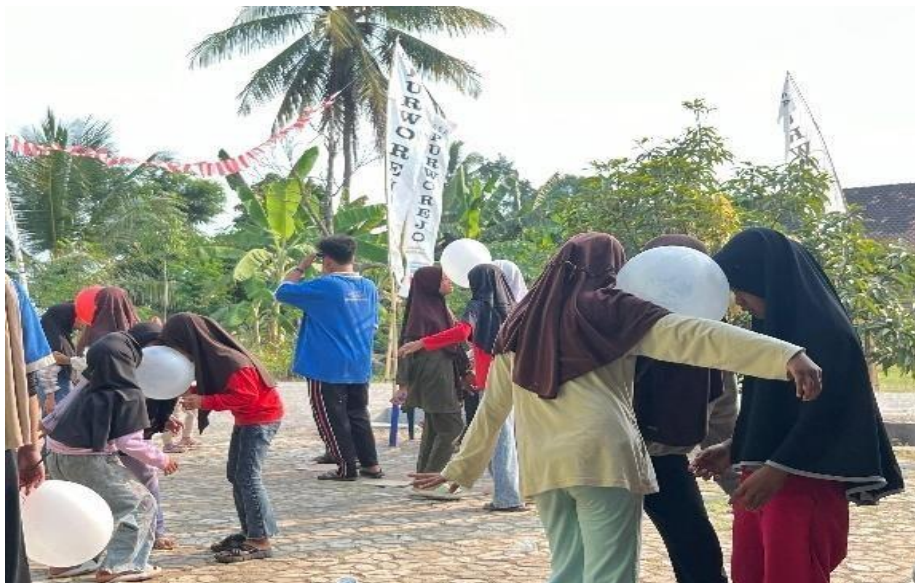
Mengadakan Acara Lomba 17 Agustus