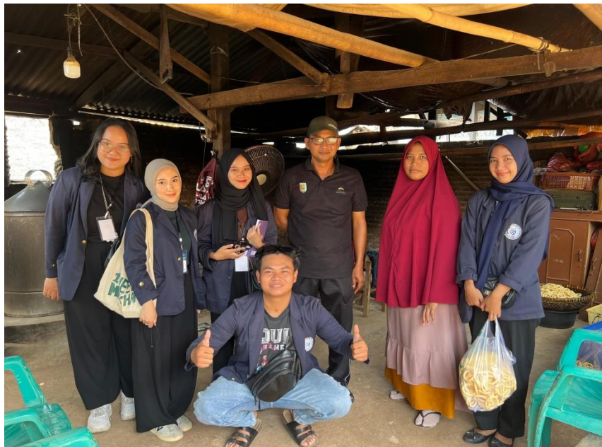
Kunjungan ke UMKM kelanting Getuk