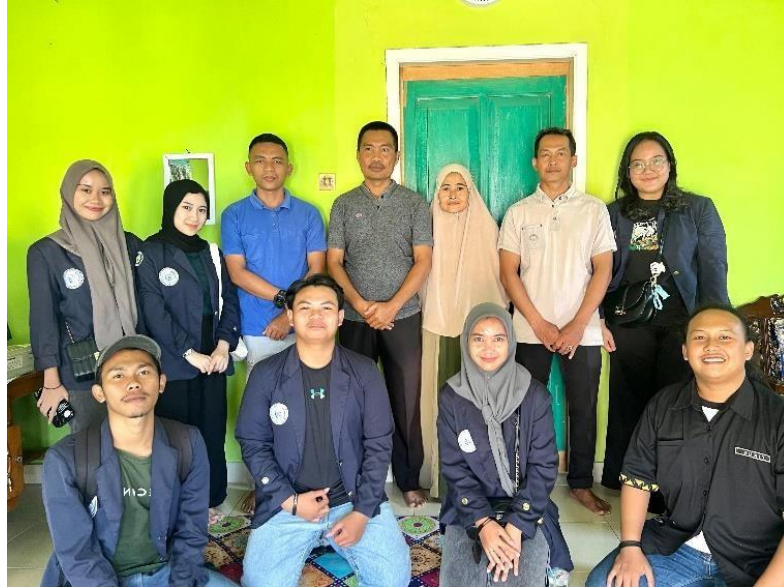
Survey Lokasi PKPM ke desa purworejo