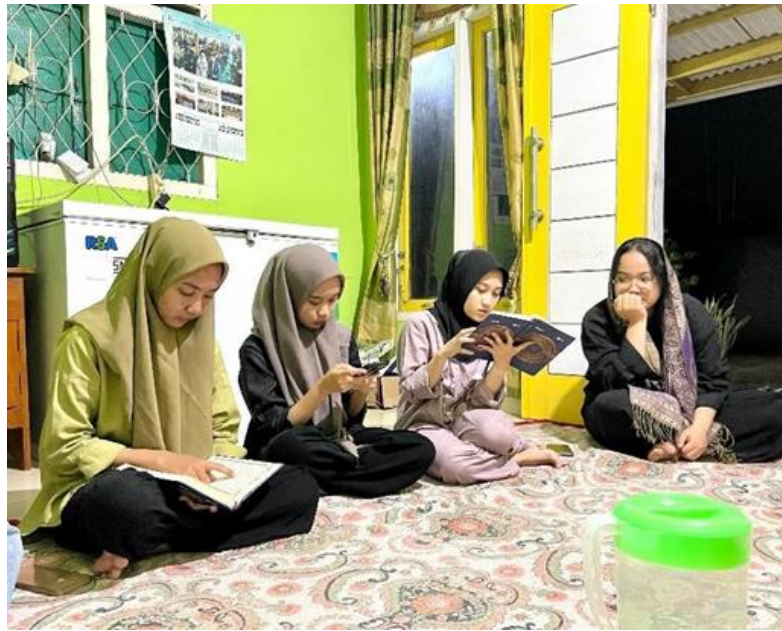
Pengajian rutin setiap malam selasa dan malam sabtu