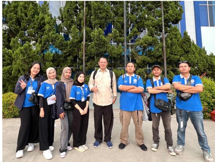
Gambar 2.3 Melakukan Pelepasan PKPM

Salah satu hal yang harus dilaksanakan yaitu melukan pelepasan oleh kampus kepada mahasiswa PKPM dan akan diberangkatkan ke desa untuk melakukan kegiatan di desa tersebut. Dapat dilihat pada gambar 2.3.