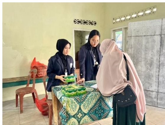
Gambar 2.11 Melakukan Kegiatan Lokakarya Di Balai Desa Purworejo dan Sosialisasi Cyber Crime Di Era Teknologi 4.0

Dilakukan bertujuan untuk memaparkan program kerja yang akan dilaksanakan selama PKPM di Desa Purworejo, Negeri Katon, Pesawaran. Dapat dilihat pada gambar 2.11.