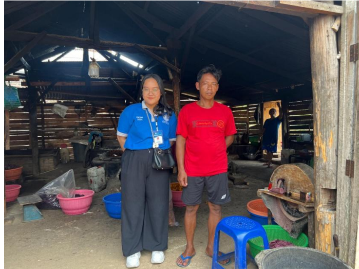
Gambar 2.5 Pengabdian Terhadap UMKM Keripik Ubi Ungu Rangga

Salah satu kegiatan yang dilakukan pada saat PKPM yaitu melakukan pengabdian kepada UMKM Keripik Ubi Ungu Rangga yakni dengan upaya melakukan kegiatan harga pokok produksi yang bertujuan untuk mengetahui biaya produk. Dapat dilihat pada gambar 2.5.