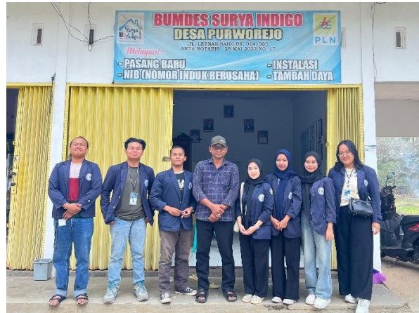
Gambar 2.10 Kunjungan Ke Kantor BUMDes Surya Indigo Desa Purworejo

Dilakukan bertujuan untuk silaturahmi sekaligus mengetahui informasi terkait UMKM dan informasi untuk pembuatan website UMKM Center yang ada di Desa Purworejo, Negeri Katon, Pesawaran. Dapat dilihat pada gambar 2.10.