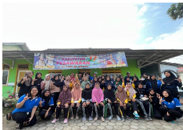
Gambar 2.13 Senam Lansia Rutinitas Mingguan Desa Purworejo

Bertujuan untuk menjaga kesehatan fisik dan mental para lanjut usia, meningkatkan kebugaran, mencegah penyakit terkait usia, serta memperkuat ikatan sosial antar peserta. Senam rutin ini juga untuk meningkatkan keakraban dan kekompakan antar masyarakat di Desa Purworejo. Dapat dilihat pada gambar 2.13.