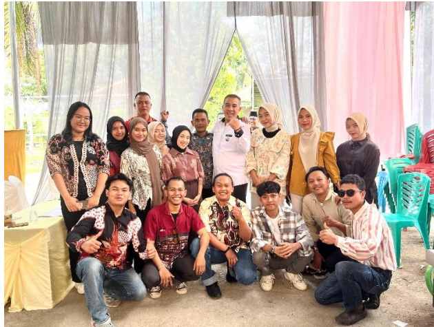
Gambar 2.8 Berpartisipasi Dalam Acara Khitanan Di Kediaman Kepala Desa Purworejo