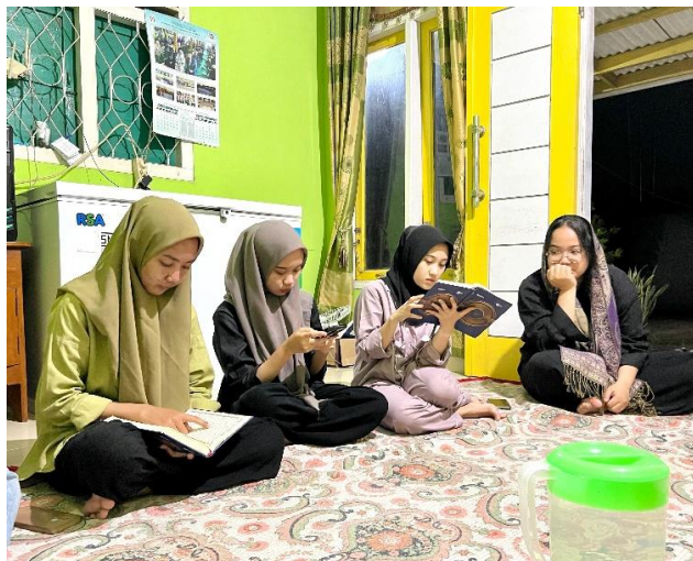
Gambar 2.15 Mengikuti Pengajian Rutin

Pengajian ini diadakan untuk meningkatkan pemahaman keagamaan serta mempererat tali silaturahmi antar warga dan memiliki akhlak yang baik. Dapat dilihat pada gambar 2.15.