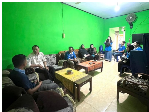
Gambar 2.2 Permohonan Izin

Permohonan izin yang disampaikan kepada perangkat kelurahan Purworejo, yang bertujuan untuk melaksanakan kegiatan PKPM yang dinilai dari tanggal 30 Juli- 29 Agustus 2024. Dapat dilihat pada gambar 2.8.