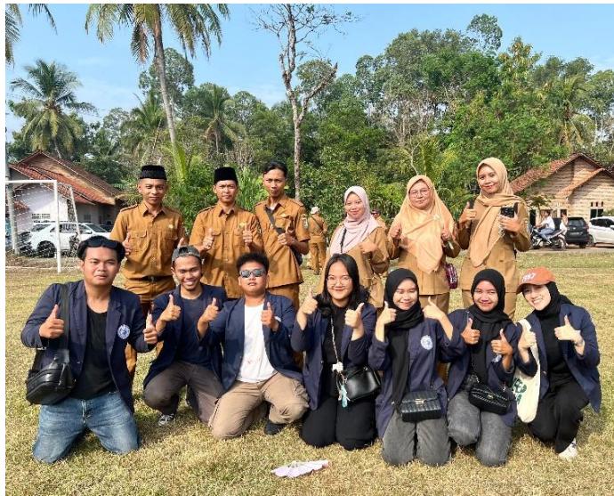
Gambar 2.14 Upacara HUT RI Ke-79 dan Lomba Tujuh Belasan

Mengikuti Upacara serta menjadi petugas Upacara HUT NKRI Yang ke-79 guna menciptakan rasa nasionalisme dan mengenang pahlawan yang telah gugur. Dapat dilihat pada gambar 2.14.