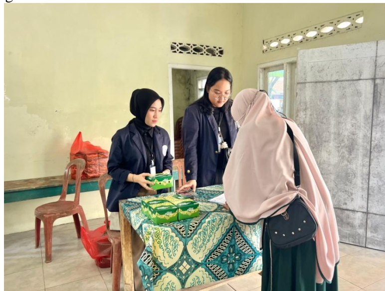
Gambar 2.4 Melakukan Kegiatan Lokakarya

Salah satu kegiatan yang dilakukan pada saat PKPM yaitu mengadakan lokakarya untuk mempresentasikan program kerja yang akan dijalankan selama PKPM di Desa Purworejo. Dapat dilihat pada gambar 2.4.