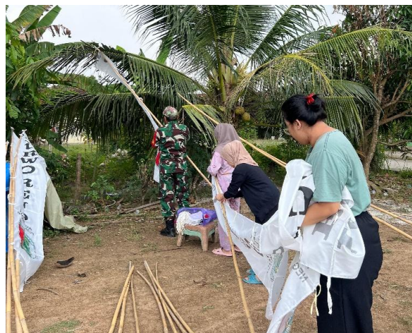
Gambar 2.9 Melakukan Pemasangan Umbul-umbul Bersama Warga Sekitar

Salah satu tujuan dari gotong royong adalah menumbuhkan sikap saling membantu antar masyarakat. Contohnya pemasangan umbul-umbul dengan warga sekitar untuk memperingati 17 agustus dan menjalin silaturahmi antar warga setempat. Dapat dilihat pada gambar 2.9.