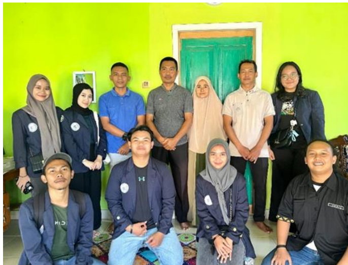
Gambar 2.1 Survei Lokasi Kegiatan PKPM

Mencari tempat untuk kegiatan PKPM di daerah Purworejo, Negeri Katon, Pesawaran yang sesuai dengan UMKM yang diarahkan kampus dengan tema yakni “Peningkatan Ekonomi Desa Menuju Masyarakat yang Unggul dan Tangguh Berbasis Digital”.