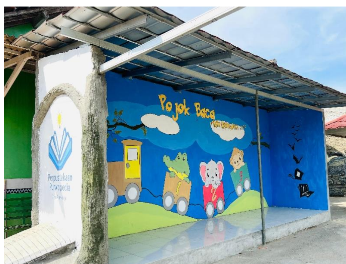
Gambar 2.15 Membuat Mural Pojok Baca

Mural pojok baca terletak di samping Kantor Desa. Dilengkapi dengan berbagai koleksi buku, baik fiksi maupun non-fiksi serta area nyaman untuk membaca. Pojok baca bertujuan untuk meningkatkan minat baca di kalangan warga desa, menyediakan akses ke sumber informasi dan pengetahuan, serta mendukung pendidikan dan pengembangan diri di lingkungan desa.