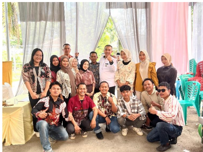
Gambar 2.8 Acara Khitanan Di Kediaman Kepala Desa Purworejo