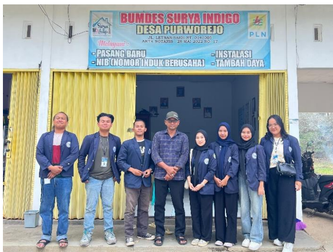
Gambar 2.10 Kunjungan ke kantor BUMDes