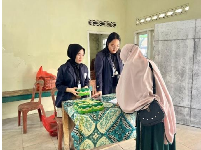
Gambar 2.4 Kegiatan Lokakarya dan Sosialisasi Cyber Crime Sumber : Dokumentasi Pribadi Penulis

Salah satu kegiatan yang dilakukan pada saat PKPM yaitu mengadakan lokakarya untuk mempresentasikan program kerja yang akan dijalankan selama PKPM di Desa Purworejo.