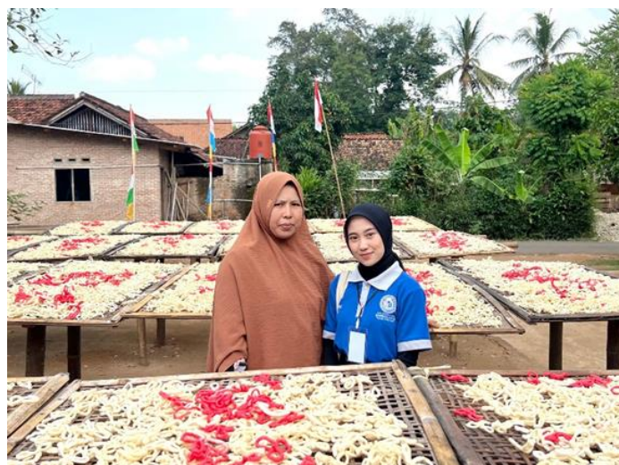
Gambar 2.5 Berkunjung ke UMKM Kelanting Azahra

Salah satu kegiatan yang dilakukan pada saat PKPM yaitu melakukan pengabdian kepada UMKM yakni Kelanting Azzahra dengan upaya melakukan perhitungan harga pokok produksi yang bertujuan untuk mengetahui biaya pembuatan produk, sehingga UMKM bisa menetapkan harga jual yang tepat dan mendapatkan keuntungan.