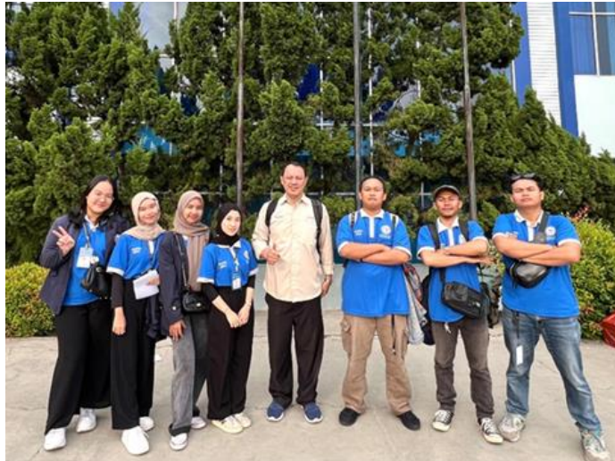
Gambar 2.2 Pelepasan Mahasiswa PKPM dari Kampus IIB Darmajaya