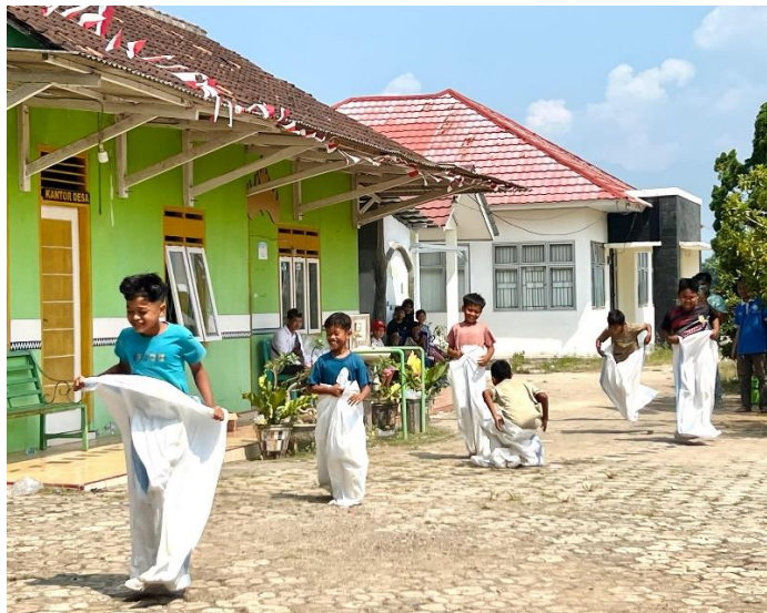
Gambar 2.13 Mengikuti Upacara HUT RI Ke-79 dan Lomba 17 Agustus Di Desa Purworejo