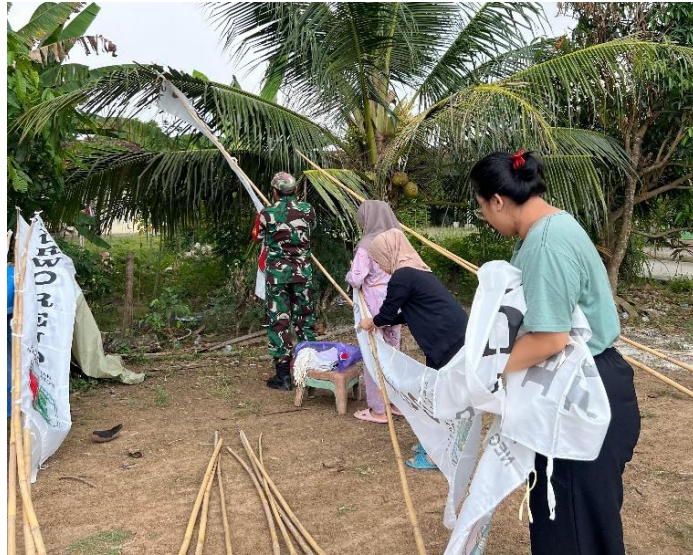
Gambar 2.9 Pemasangan Umbul Umbul Bersama Warga Sekitar

Salah satu tujuan dari gotong royong adalah menumbuhkan sikap saling membantu antar masyarakat. Dimana orang-orang mau membantu dan menolong orang lain yang membutuhkan. Menyelesaikan suatu tantangan secara bersama, dapat mempererat tali persaudaraan, meningkatkan rasa solidaritas.