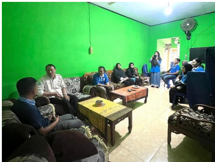
Gambar 2.3 Pengantaran Mahasiswa PKPM ke Desa oleh DPL

Pengantaran Mahasiswa PKPM ke Desa yang disampaikan kepada perangkat kelurahan Purworejo, yang bertujuan untuk melaksanakan kegiatan PKPM yang dimulai dari tanggal 30 Juli - 29 Agustus 2024.