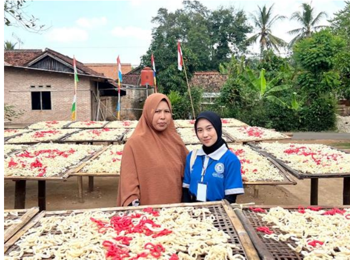
Gambar 2.12 Kunjungan ke UMKM Kelanting Azzahra Sumber : Dokumentasi Pribadi Penulis

dan silaturahmi dengan pemilik UMKM serta berbincang mengenai permasalahan-permasalahan yang terjadi. Sehingga hasil dari perbincangan tersebut dapat menemukan titik terang mengenai program kerja yang akan dilaksanakan agar dapat membantu dari segala permasalahan.