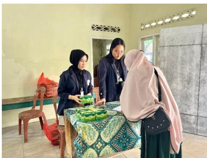
Gambar 2.11 Kegiatan Lokakarya dan Sosialisasi Cyber Crime

Dilakukan bertujuan untuk memaparkan program kerja yang akan dilaksanakan selama PKPM di Desa Purworejo, Negeri Katon, Pesawaran.