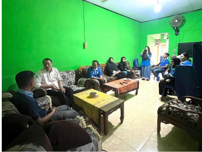
Gambar 2.7 Pelepasan Peserta PKPM dan Silaturahmi ke Balai Desa

Pelepasan ini adalah awal kegiatan PKPM yang di dampingi langsung oleh Dosen Pembimbing Lapangan dan mengantarkan Mahasiswa ke posko PKPM di Desa Purworejo, Negeri Katon, Pesawaran.