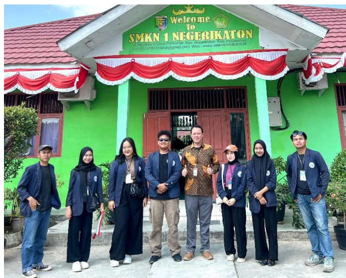
Gambar 2.14 Sosialisasi Pentingnya Pendidikan Di SMKN 1 Negeri Katon Bersama Dosen Pembimbing Lapangan