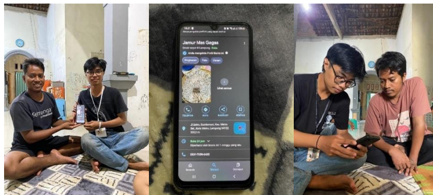
Gambar 2.3.2 Hasil Kegiatan Pembuatan Akun Google My Business